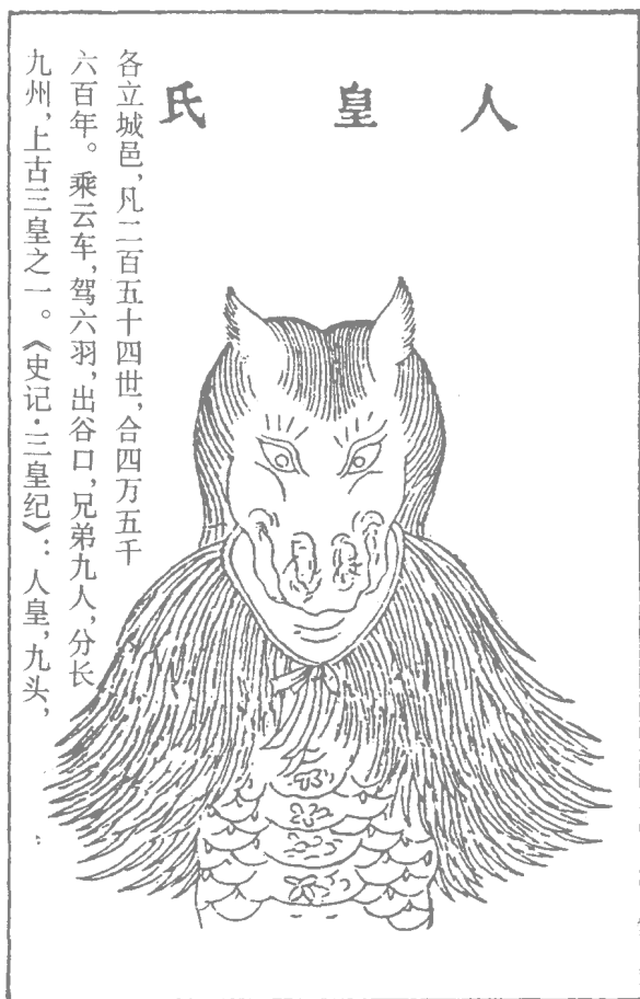
图 1-5 人皇氏