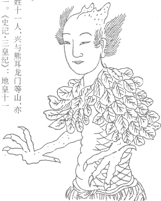
图 1-4 地皇氏

各万八千岁。 头，头德，王姓十一人，兴与熊耳龙门等山，亦 上古三皇之一。《史记·三皇纪》：地皇十一