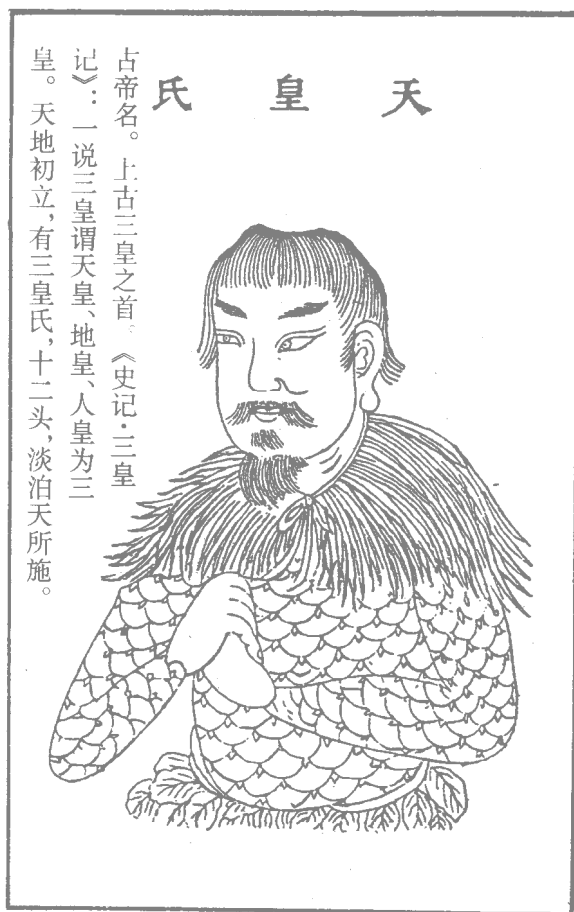
图 1-3 天皇氏