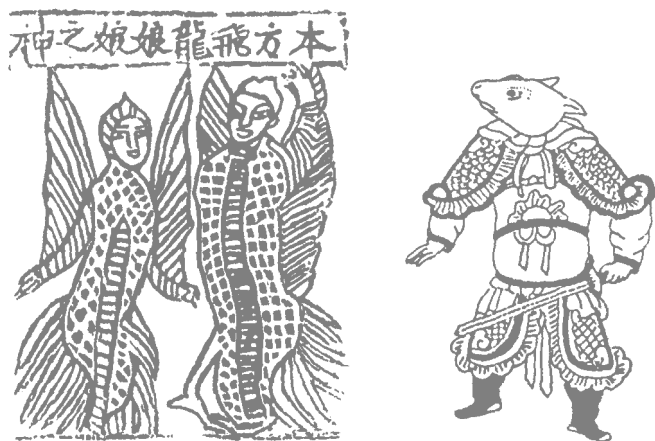
图 1-1 半人半兽神像