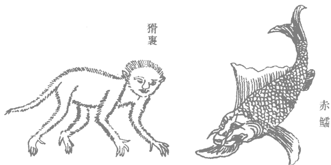
山海经兽身人面图