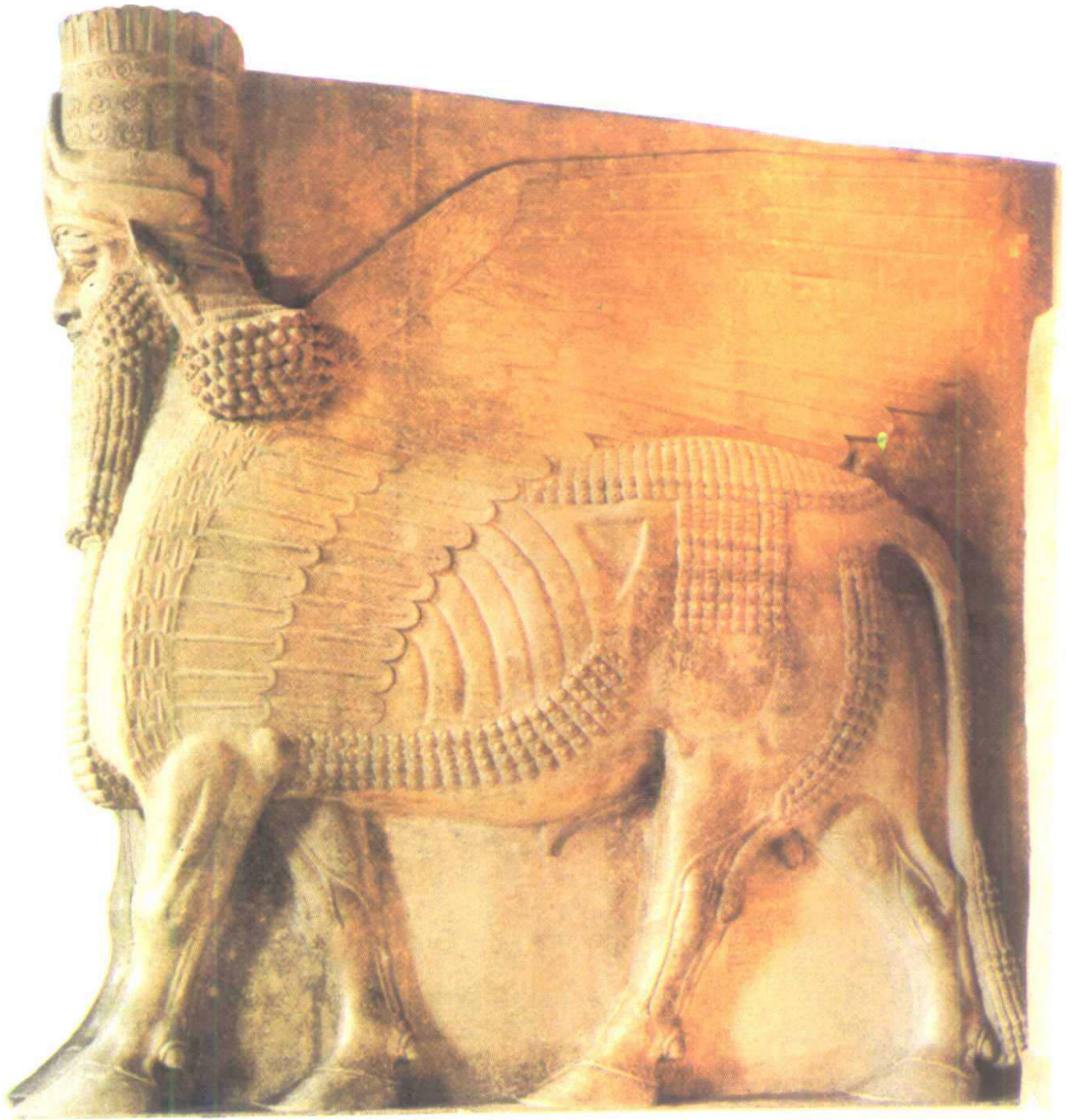
人面双翼石狮雕像