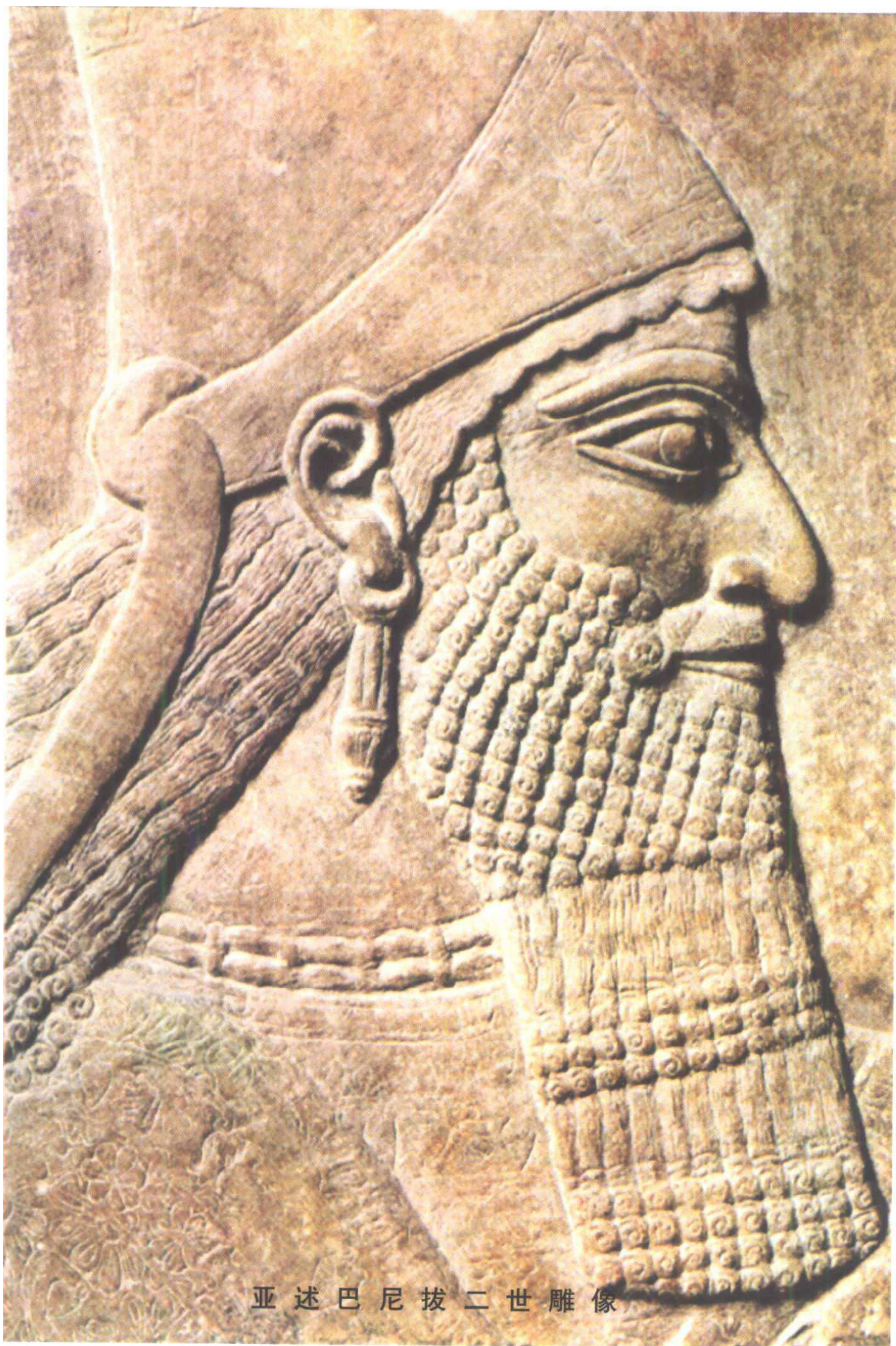
亚述巴尼拔二世雕像