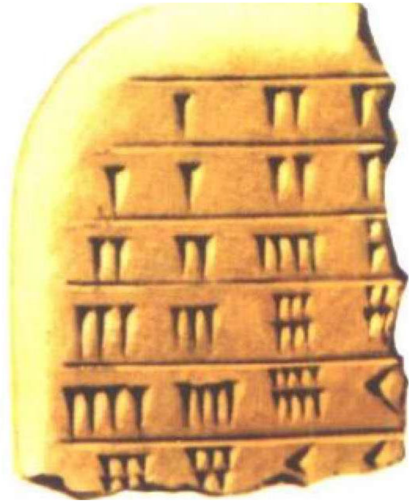
巴比伦乘法表泥板残片