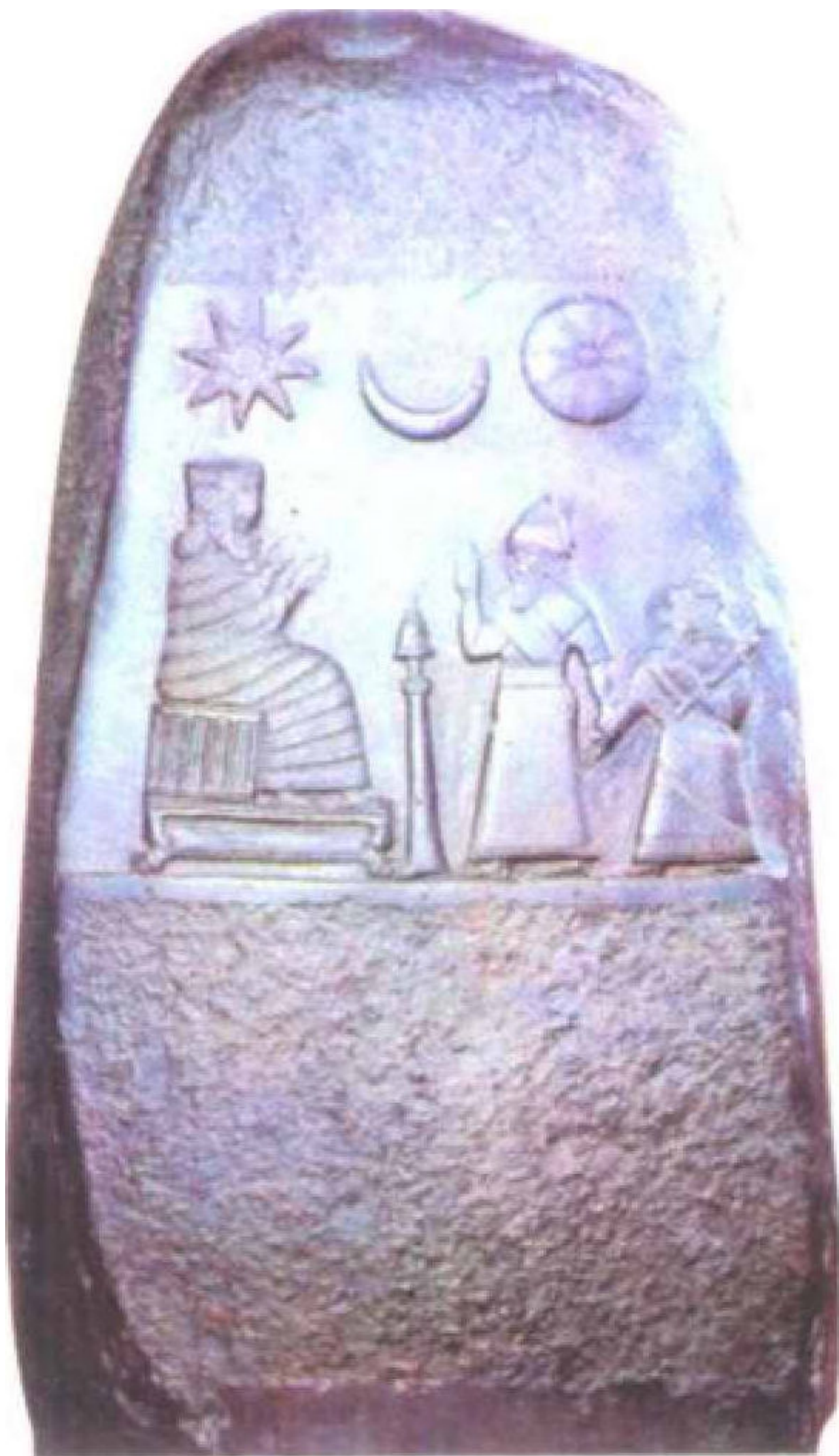
汉谟拉比法典石柱