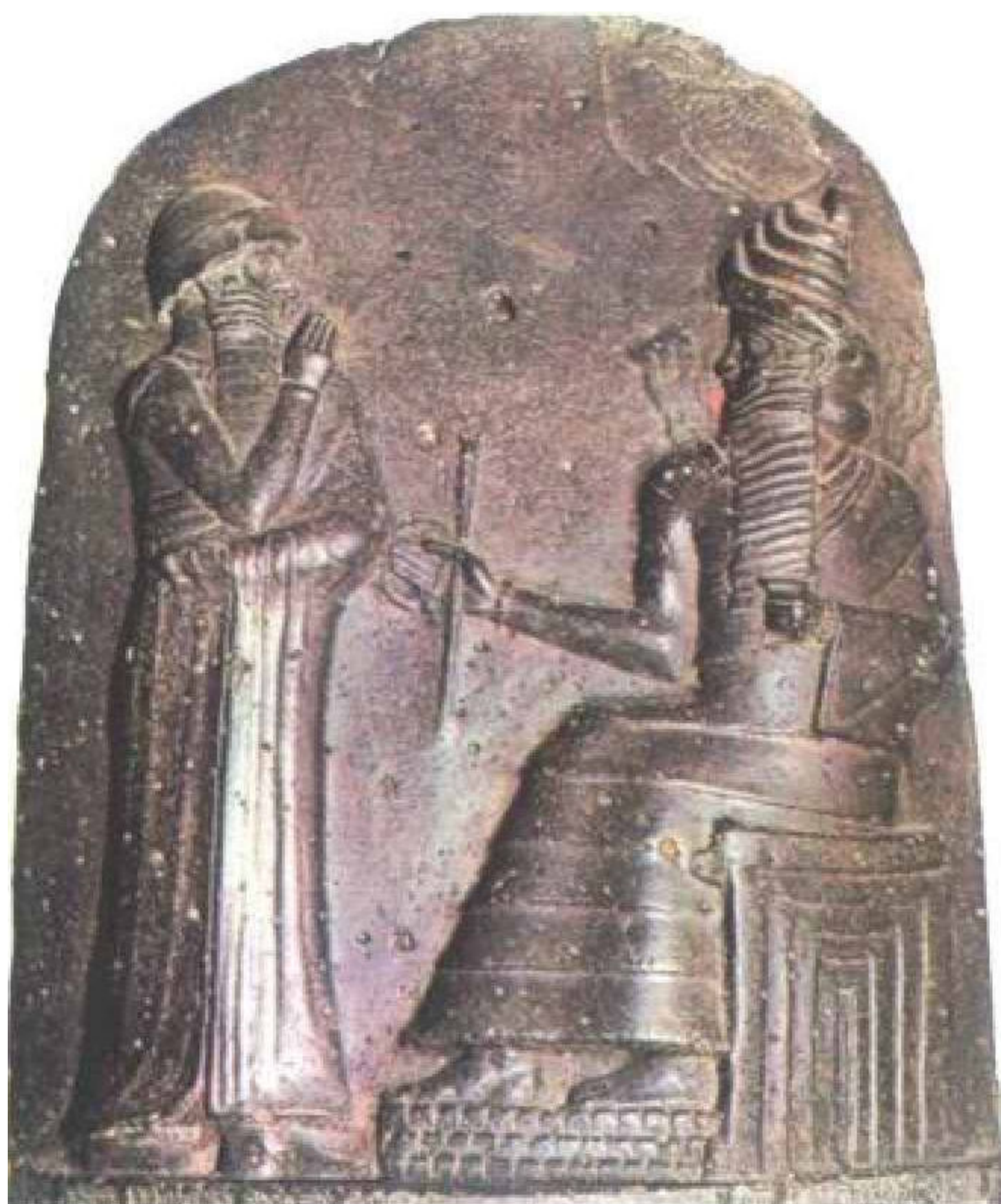
汉谟拉比法典石柱上端