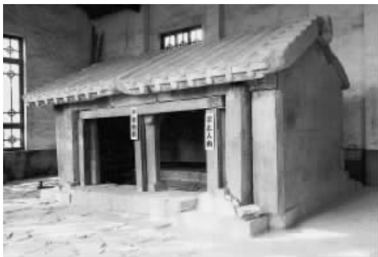
建于东汉的长清孝堂山石祠

因而易山名为孝堂，易村名为孝里。其实此祠与二十四孝中的郭巨无涉，祠主可能曾是诸侯王属下的一个二千石官吏。石祠建在墓冢之前，坐北朝南，面阔 源 米，高 圆 米，进深 圆 米，全部用青石砌成。其中已出现墙壁、柱、梁、枋、斗拱、屋顶等结构，说明山东后来的许多建筑结构与形式在汉代已经形成。屋顶是两面坡的石板，上面很真实地雕刻出了脊背、瓦陇、瓦当、沟头、椽头、连檐等，十分完整地再现了汉代单檐悬山顶式房屋样式。据考古学者们认定，这是我国现存于地面最早的一座房屋建筑，为研究我国建筑史不可多得的实物资料，也是山东古建筑的优秀实物例证。与这种石祠一脉相承的古建筑，在长清孝里镇北黄崖村北的山南坡上，还有一座人称 员