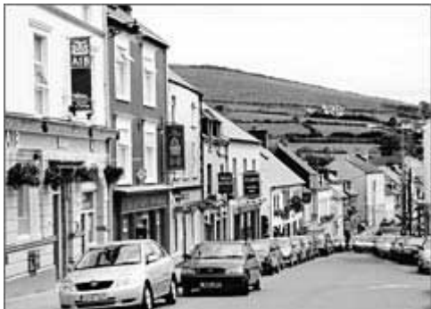
小镇上一排排五彩缤纷的店屋

丁格尔镇有一般欧洲小镇风情，髹得五彩缤纷的屋子一间挨一间，有酒廊、民宿、精品店、餐馆，一些个性小店连店面也很有个性。