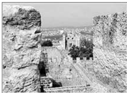
从圣乔治城堡眺望里斯本

里斯本市区是在7个小山丘上繁荣起来的，多数旅者是从城区的圣乔治城堡开始认识里斯本的。在阿尔法玛旧城区，狭窄的石板上坡路中穿街走巷，那些16世纪以来的残墙颓壁，偶尔还能看到昔日贵族的徽号。进入城门的登城，如果你到过澳门，就会明白葡萄牙人是如何在其殖民地上，复制他们的建筑。