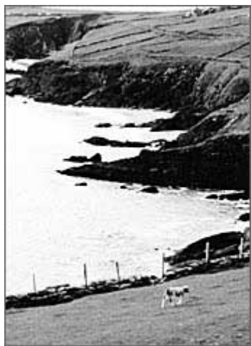
绿油油的山谷缀以点点牛羊

距离目的地还有大约 160 公里，我们的车子在第三天中午闯进了丁格尔半岛（Dingle Peninsula）。为了哥尔威，我们一路上已经和许多爱尔兰旅游景点失之交臂，有的也只有惊鸿一瞥的邂逅，比如科克（Cork）和基拉尼（Killarney）。