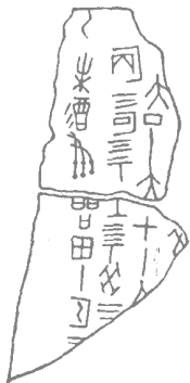
图 2 王国维摹写的有商王世系的卜骨

王国维工作的意义 如果放在当时学术界的思潮背景中 可以看得更清楚。原来自清末廖平、康有为等学者提倡今文经学，于学术界掀起一种疑古之风，对古史传说、古籍记载进行怀疑分析。这从文化思想说，本来是进步的，但疑古过甚，便导致了古史的空白，