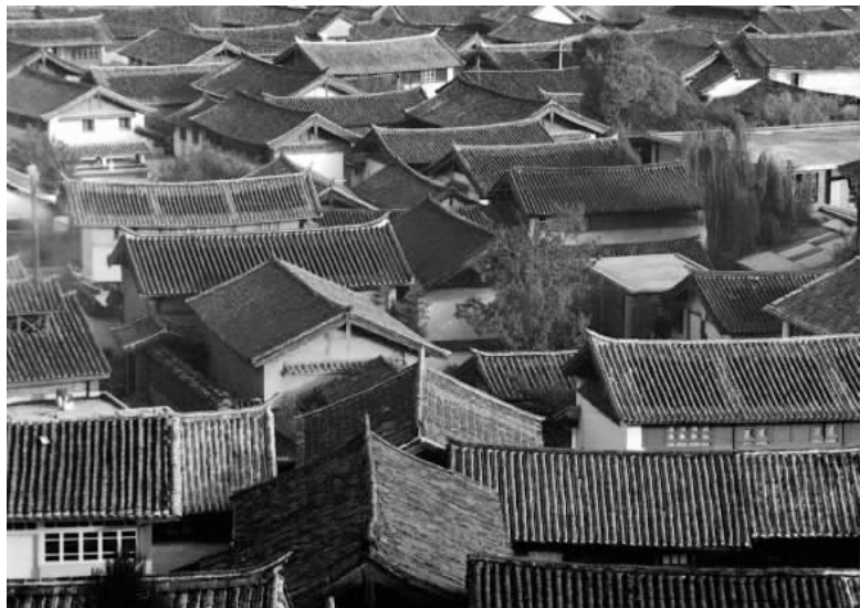
图 1 沐浴在阳光中的丽江古城

自秦汉以来，一个古老的民族——纳西族就在这里生息、繁衍、劳作，经过漫长的历史发展，逐步形成了以丽江为中心的政治经济文化区域，纳西族的