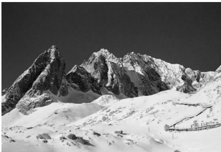
图 2 玉龙雪山 英姿

地理位置是北纬 27^{\circ}03'20''\sim 27^{\circ}40' ,东经 100^{\circ}04'10''\sim 100^{\circ}16'30'' 。南北走向的玉龙雪山延绵 35 公里,屹立在丽江古城以北,终年白雪皑皑,就像是一堵银白的照壁,又恰似一道玉洁的屏风,小巧灵秀的古城在玉龙雪山银灰的映衬之下显得格外光彩夺目。