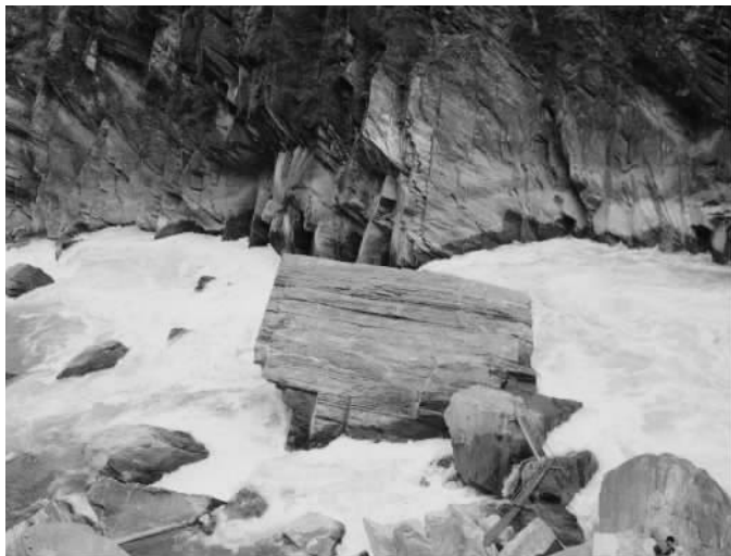
图3 金沙江— 虎跳峡

去的气势何其恢弘；然而，只有在丽江这块神奇的地方，金沙江也放慢了它的脚步，柔情万千，一步三回首，仿佛不忍离去。