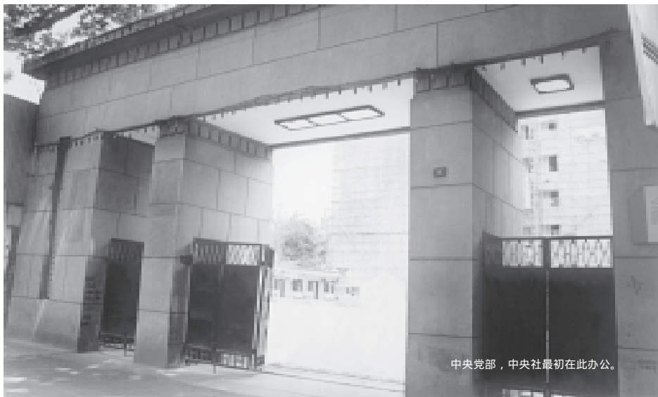
中央党部，中央社最初在此办公。