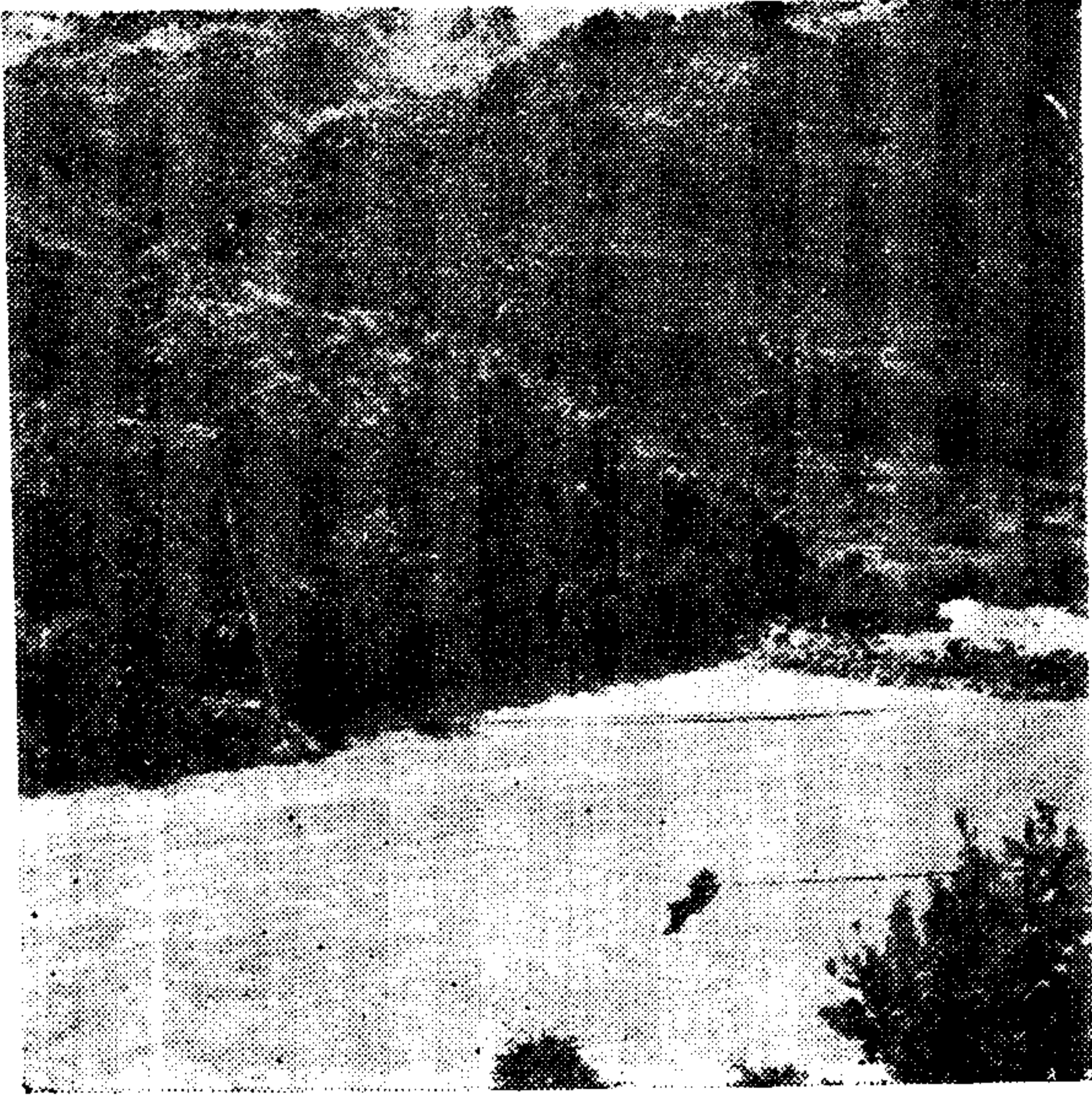
解放前怒江上的溜索