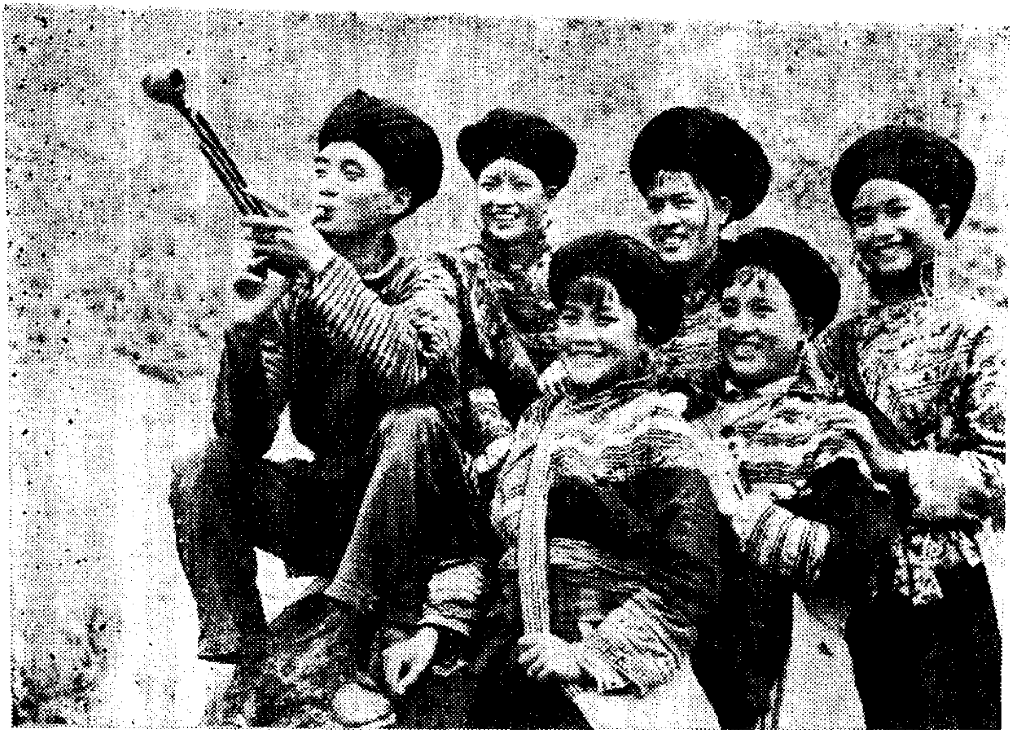
四川地区的傈僳族新一代