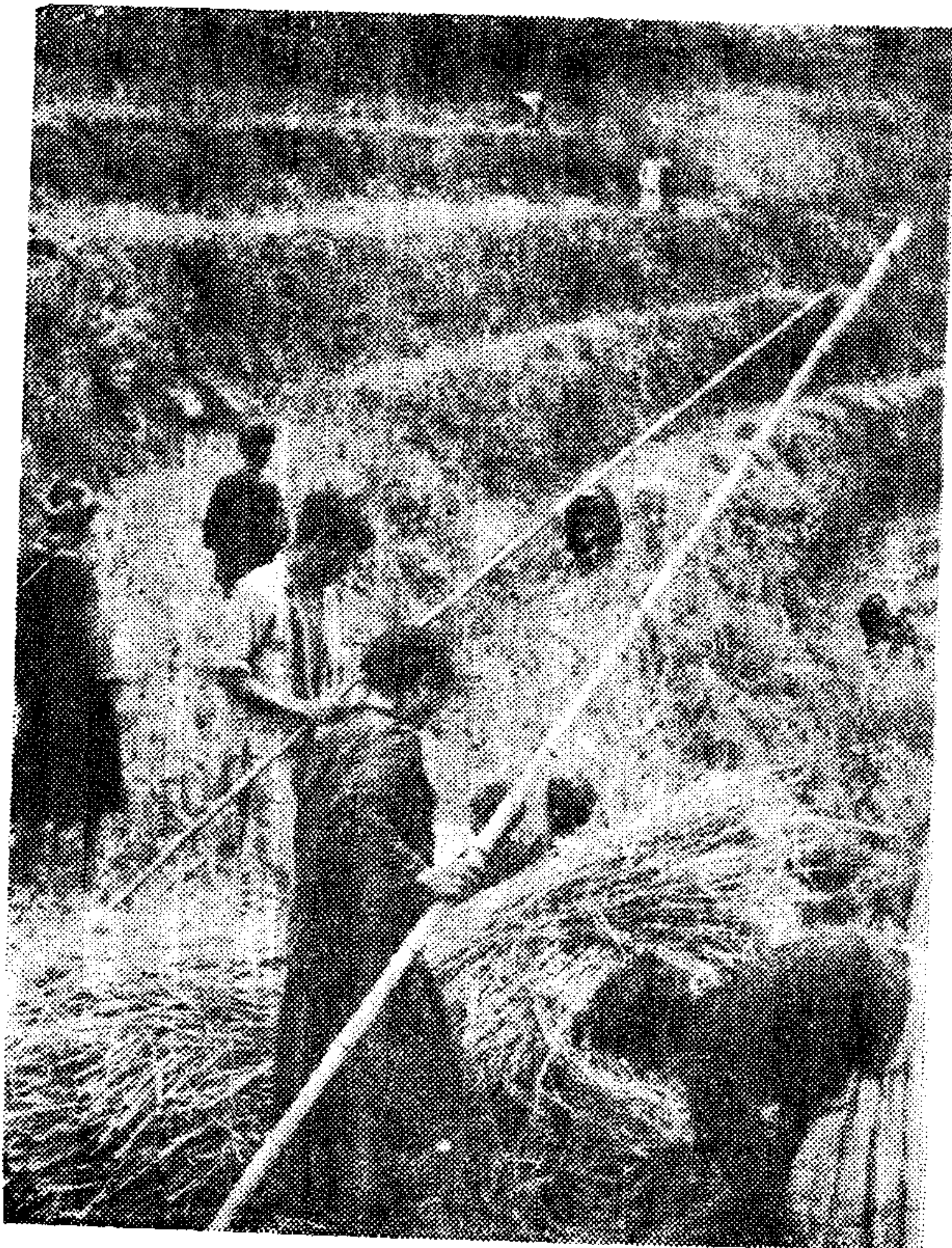
解放前傣傣族落后的收打方式 ——用脚踏谷壳粒