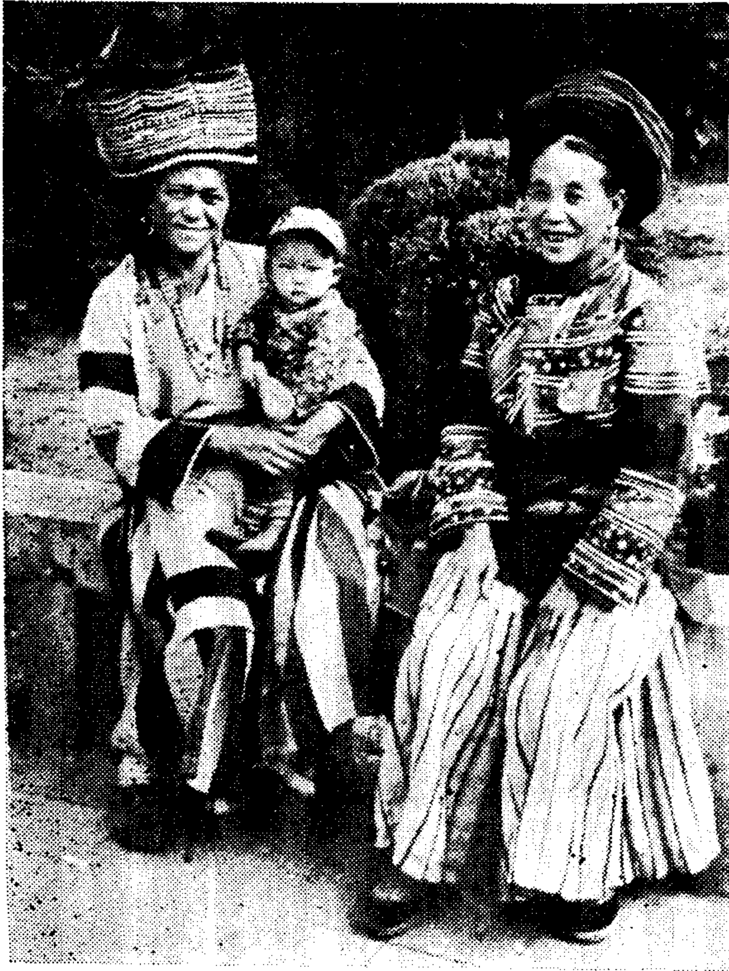
丽江地区傈僳族妇女服饰