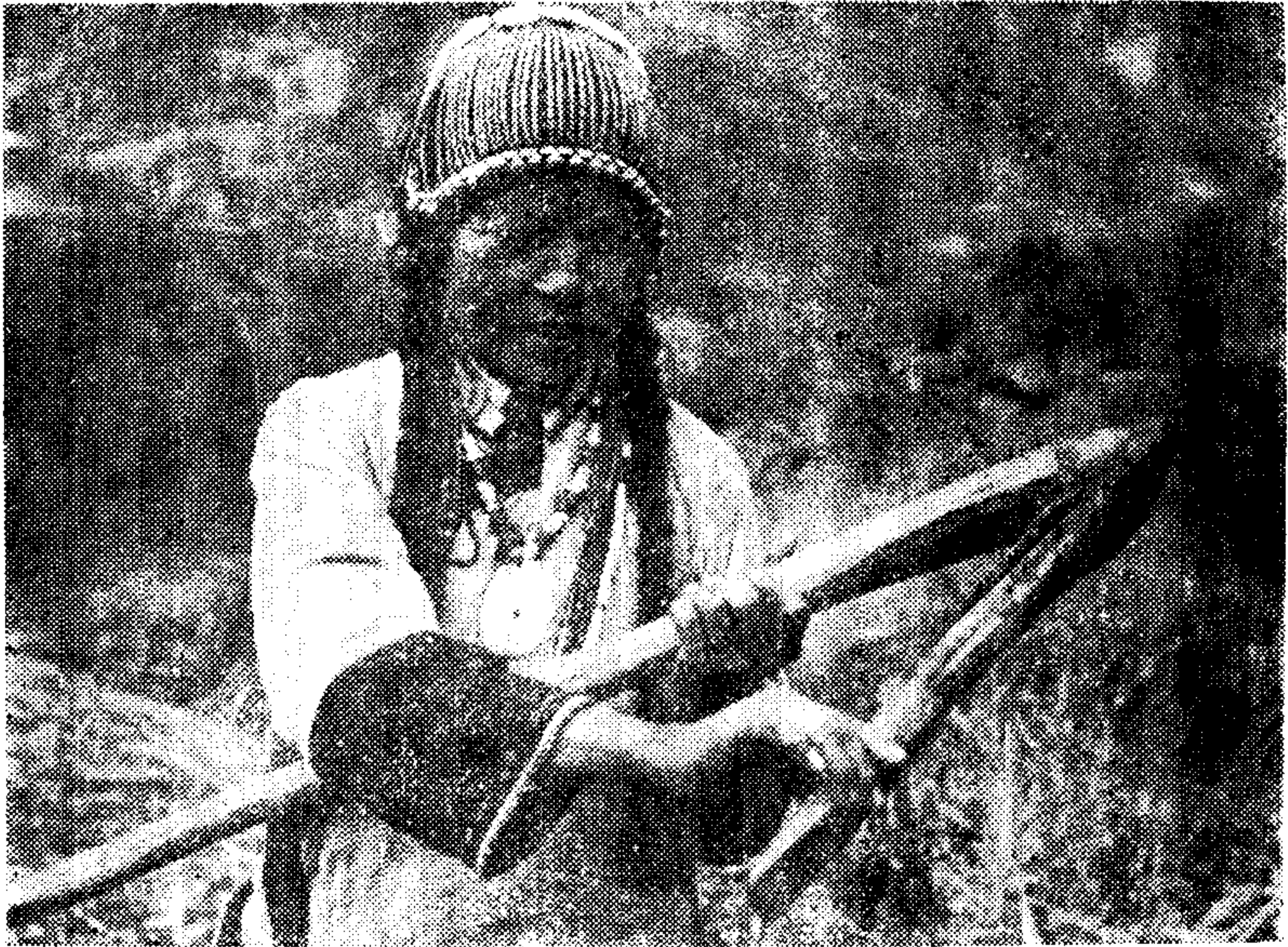
解放前怒江地区普遍使用的“鸭嘴”锄