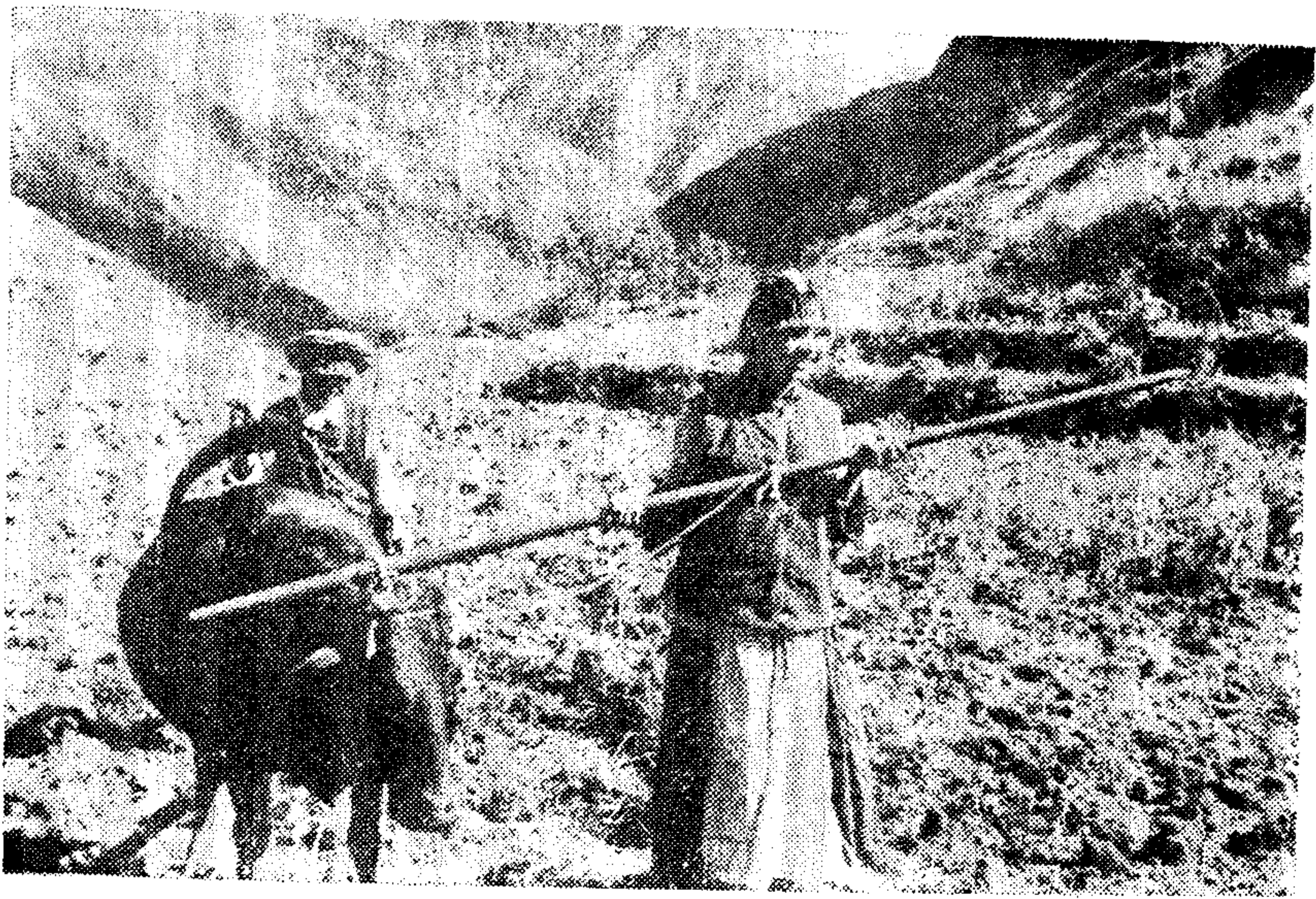
怒江地区傣傣族的牛耕