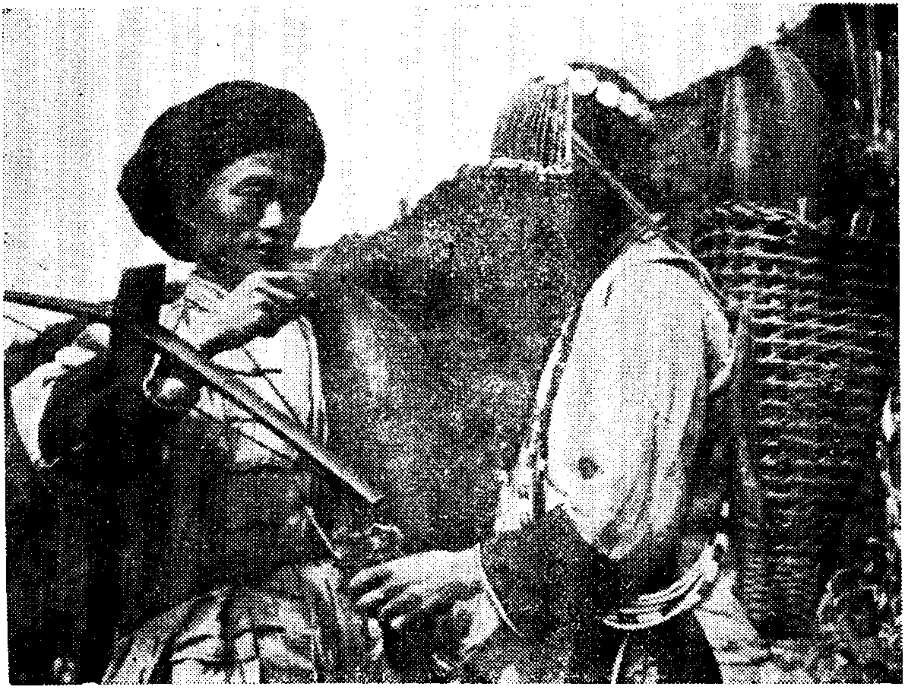
怒江地区傈僳族男女服饰