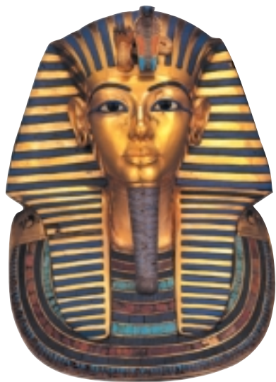
图坦卡蒙法老的黄金面具

1922年，考古工作者在“帝王之谷”内发现了距今3000多年前十八王朝的法老图坦卡蒙的陵墓。图坦卡蒙是著名的阿蒙普特四世（即埃赫那吞）王后尼费尔提提的女婿。这位君主政绩平平，没有什么大作为。他大约于公元前1361年登基，当时年仅10岁，娶了一个12岁的少女。19岁时他便死去了（也有人认为他死时18岁）。这些就是史料传说对他生平的全