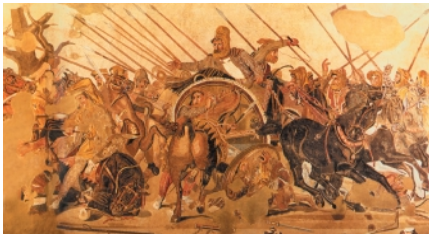
回 亚历山大追击大流士的战斗

性疾病，前苏联学者塞尔格叶夫曾在《古希腊》中提及此事。在《亚历山大新传》这本书中，美国学者高勒将军认为“亚历山大由于长期在沼泽地区作战而染上恶性疾病，在6月13日晚上发作，从此离开人世”。他来不及留下遗嘱，更没时间指定由谁来继位。持同样看法的还有我国史学家吴子谨教授。