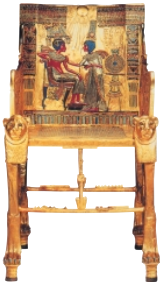
图坦卡蒙的黄金王座