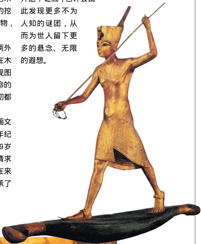
回 图坦卡蒙在小舟上的木雕像

哪里？也许仍长眠于尼罗河畔充满神奇色彩的土地下，我们只有期待更多的出土资料来揭开这个谜底，也许会由此发现更多不为人知的谜团，从而为世人留下更多的悬念、无限的遐想。