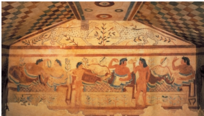
回 罗马贵族生活场面壁画

罗马帝国一度成为世界性的政治经济中心，其贵族过着享乐、宴饮、狩猎的奢华生活。此图即当时贵族生活的真实记录。