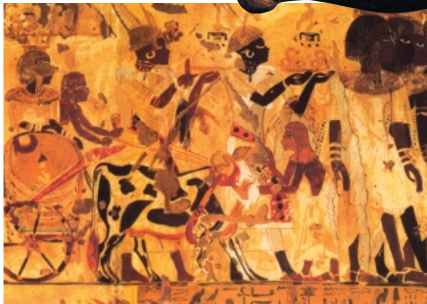
回 骑牛车的努比亚公主

一位努比亚公主乘由两头牛拉的战车，她的随从们手捧着金指环、豹皮以及其他礼物，将其敬献给古埃及第十八王朝法老图坦卡蒙。