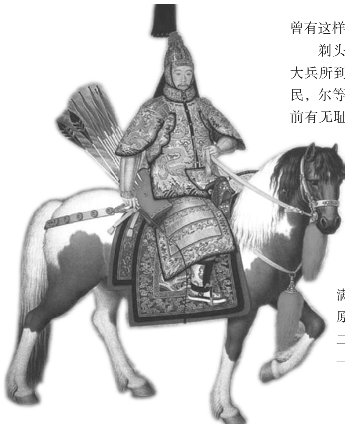
清意大利画家郎世宁绘乾隆帝南苑阅兵的《大阅铠甲骑马像》