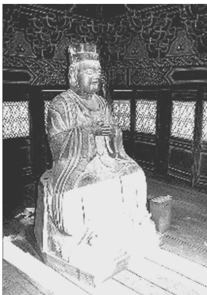
明代大太监魏忠贤的铜像

魏忠贤，明朝宦官，河间肃宁（今属河北）人，原名进忠，曾从继父姓李。他结过婚，妻子姓冯，有个女儿。魏忠贤最好赌博，但从来没有赢的时候。一次与几个无赖聚赌，输得无力偿还，被几个无赖极尽羞辱，一怒之下自割阳具，入宫当了太监。在宫中，魏忠贤结交太子宫太监王安，在其引荐下见到熹