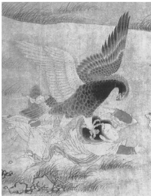
缠足妇女 宋人《搜山图》局部

小脚之所以称之为金莲，应该从佛教文化中的莲花方面加以考察。莲花出淤泥而不染，在佛门中被视为清净高洁的象征。佛教传入中国