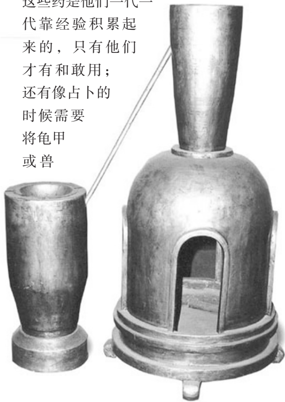
巫师的道具炼丹炉

治病也是巫师的专业，那时得病以为是中了什么邪，于是就找巫来驱邪。用唱歌跳舞，或口中念念有词及其他奇怪的形体动作来行使法术；有时也给病人吃点药物。巫在表现鬼神附体或作法前，自己也常要吃某些药以求得兴奋，因为他得表现出与平时不同的癫狂状态，这些药是他们一代一代靠经验积累起来的，只有他们才有和敢用；还有像占卜的时候需要将龟甲或兽