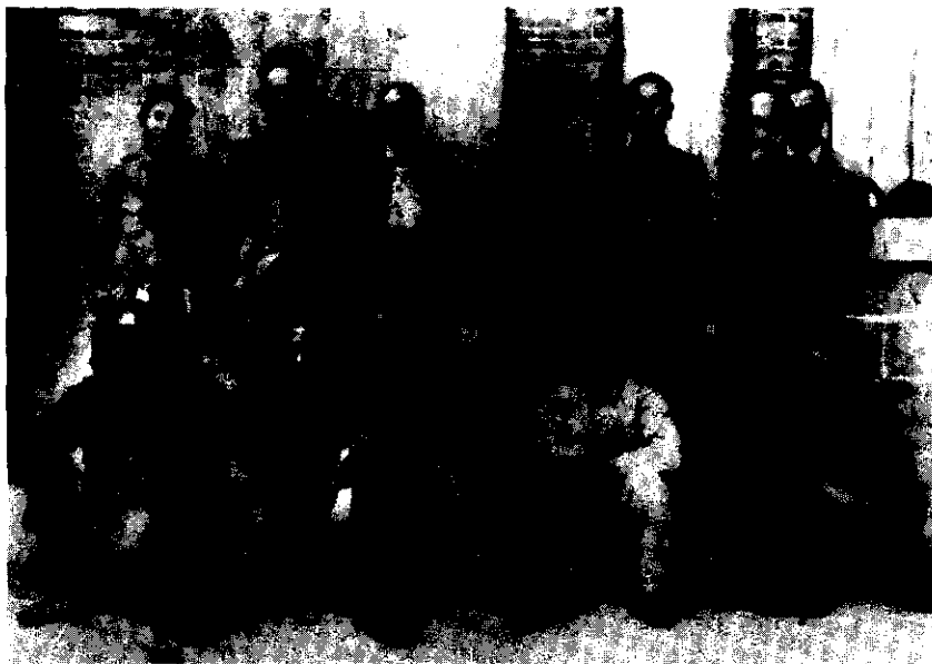
1938年9月，刘少奇在延安出席中共中央政治局会议，在会上作关于北方局工作报告。图为会议人员的合影。前排右起：王明、项英、朱德、王稼祥、毛泽东、康生。后排右起：张闻天、周恩来、刘少奇、彭德怀、秦邦宪、陈云

中共中央和红军长征胜利后，刘少奇于1936年春天作为中央代表奔赴华北，以后担任北方局书记，坚决贯彻执行中国共产党的抗日民族统一战线政策，有力地推动了华北抗日救亡运动的发展。他不畏艰险，排除万难，在国民党统治区恢复和重建在白色恐怖中遭到破坏的中共组织。在北方局的领导下，国民党统治区的中共组织认真学习刘少奇从中央带来的《八一宣言》和瓦窑堡会议决议等中央文件，推动了“一二九”运动的深入发展，迅速掀起了轰轰烈烈的抗日救亡运动浪潮。