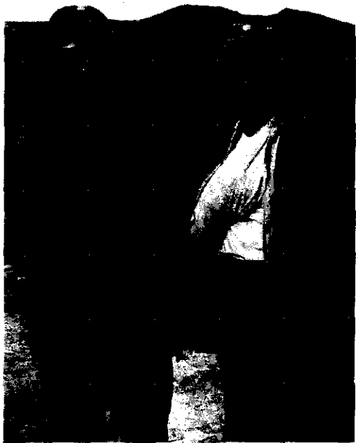
1939年8月27日，刘少奇在延安机场送周恩来去莫斯科疗伤

1939年初，刘少奇到达确山县竹沟镇。从这时起到10月，刘少奇在竹沟（中间曾回延安一段时间）主持中原局领导工作期间，以革命转变时期应有的革命胆略和魄力，彻底肃清了王明右倾错误的影响，坚定不移地把党的工作重心转移到开创敌后抗日根据地上来，具体指导了四望山、大别山、鄂豫边、豫皖苏等抗日根据地的创建和发展工作，为实现中共中央“发展华中”的战略方针进行了全面部署。为了适应当时形势发展对干部的急需，刘少奇通过中原局开办训练班的形式，集中训练各地党组织选送来的党员干部和革命积极分子，为华中各抗日根据地培养、输送了大批的政治干部、军事干部和专业技术干部，使竹沟成为中国共产党在中原地区的红色基地，成为新四军第四师、第五师等部队的“红色摇篮”。