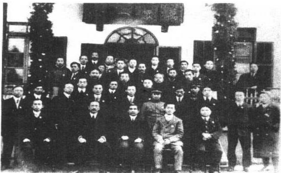
1912年1月1日，李书城（第二排右四）与孙中山（前排右三）总统府秘书处人员合影。