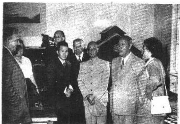
1954年9月， 李书城（右三）随 董必武（右二）在保 加利亚参观访问。