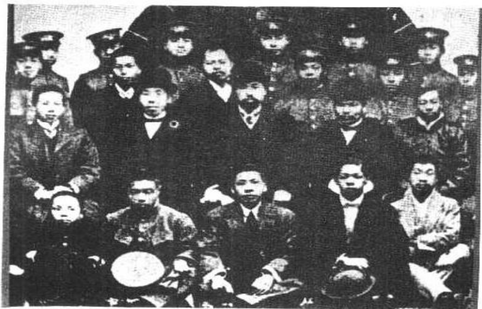
1911年11月，黄兴（二排中）、李书城（二排右一）等武昌战地司令部成员合影。