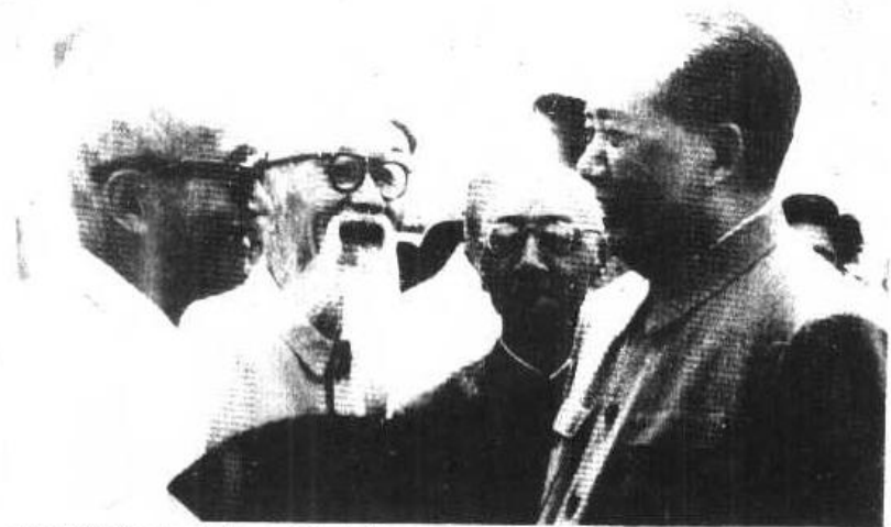
李书城（右二）、张难先、章士钊和毛泽东主席在一起。

1949年10月21日 在中央人民政府财政 经济委员会成立会上 李书城（前左三）与 陈云（前左六）薄一波 （前左五）等合影。