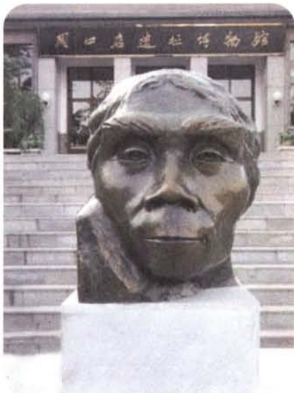
周口店遗址博物馆

北京人的外貌有点像猿：嘴巴向前突出，没有下颏，鼻子扁平，额骨高突，两个粗大的眉骨连在一起，像屋檐一样遮在双眼上。他们走起路来有点驼背，不像现代人那样昂首挺胸。他们以群体生活、共同劳动、共同分享劳动成果的方式生活在一起。