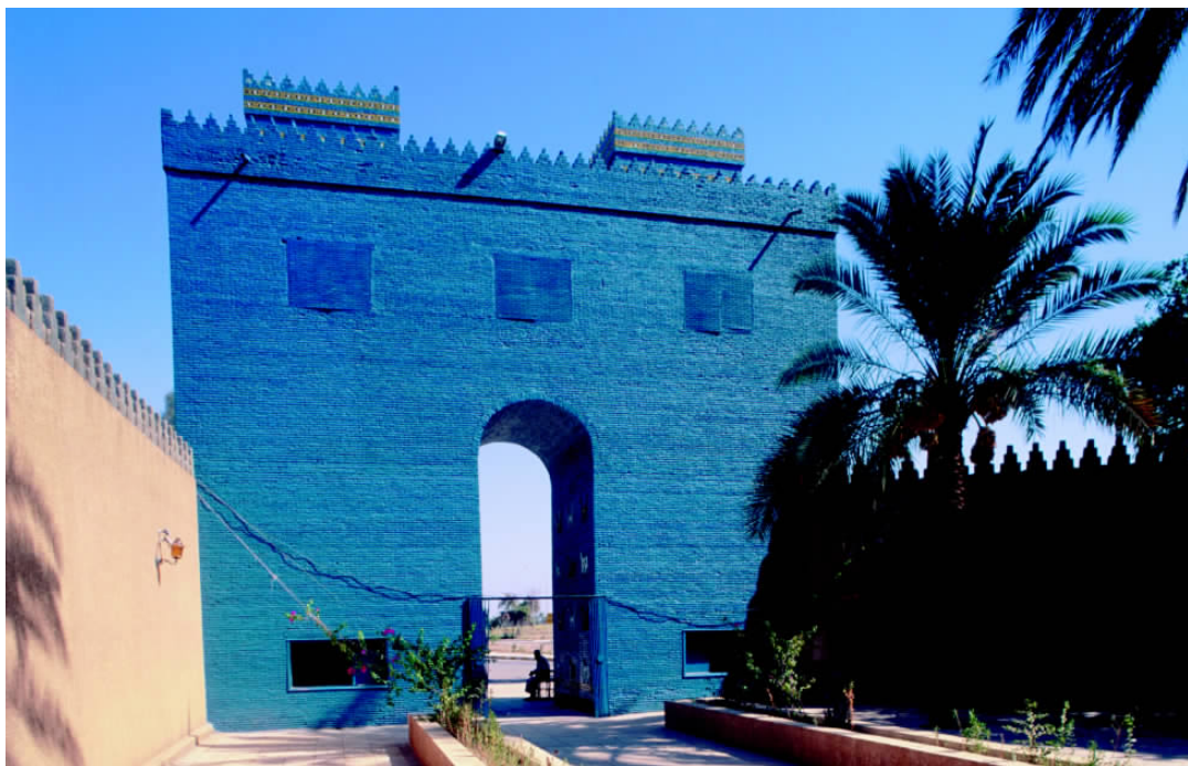
✦ “女神门”是古巴比伦城的精华之一,这座城门高12米、宽近20米,是古巴比伦城的要塞。重建后的城门已没有当年的气势,但人们依然赞叹其无与伦比的建筑艺术。

拉克人的办公室或住宅,主人都会用热茶和椰枣款待你。远道而来的客人,主人必须请他们吃伊拉克名菜烤全羊、红烧鱼等。伊拉克为伊斯兰教国家,穆斯林禁止吃猪肉和饮酒。