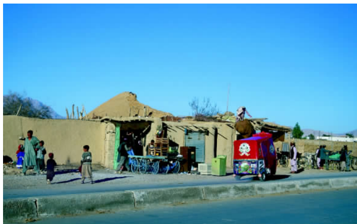
✦ 特达是距卡拉奇98千米的一座城市，它也是信德省最古老的城市，这里有许多重要古迹。

卡拉奇原是巴基斯坦首都，是全国第一大城市，也是最大的经济中心、最大的海港和人口最多的城市。它还是全国工商业和文化中心，工业产值占全国的40%，主要工业有造船、钢铁、机床、水泥、黄麻加工、纺织及玻璃等。卡拉奇是一个天然海港，港外岛屿罗列，堤内波平浪细。港区分东、西两个码头，还有一