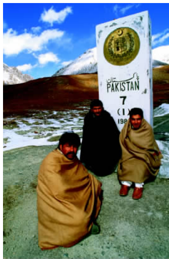
✦ 巴基斯坦的地理位置十分重要，其东北部的瓦罕走廊与中国连接，图为中国和巴基斯坦的边境地区。

个现代化的造船厂和干船坞，承担全国95%以上的外贸吞吐任务。卡拉奇国际机场是亚洲最大的机场之一，也是欧亚间许多航班的中转站。市内还有国父墓和巴图大清真寺供游人游览。