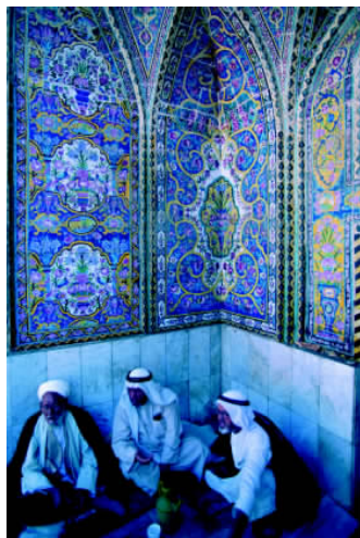
✦ 巴格达市内有近百座清真寺,卡齐迈因清真寺是其中较为著名的。

拉克人的办公室或住宅,主人都会用热茶和椰枣款待你。远道而来的客人,主人必须请他们吃伊拉克名菜烤全羊、红烧鱼等。伊拉克为伊斯兰教国家,穆斯林禁止吃猪肉和饮酒。