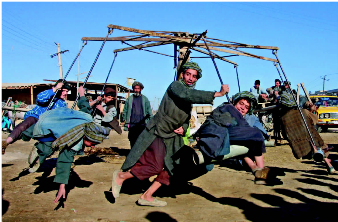
✦ 现代的旋转木马被阿富汗人用传统的方式表现出来，阿富汗人兴高采烈地坐在旋转木马上。对于他们来说，战争和死亡似乎离得很远。

年，苏联出兵阿富汗，直至1989年才全部撤离。苏联撤离阿富汗之后，阿境内各派别爆发内战。1992年4月，纳吉布拉政权垮台，阿富汗游击队接管政权，改国名为阿富汗伊斯兰国，拉巴尼任总统。1996年9月，阿富汗伊斯兰学生武装“塔利班”攻占喀布尔，控制了阿富汗90%以上的领土。总统拉巴尼流亡国外，其他各派游击队在马扎里沙里夫建立其政治中心，建立了反塔利班联盟。1997年10月27日，塔利班政权改国名为阿富汗伊斯兰酋长国。