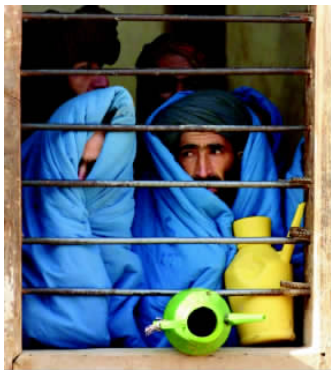
✦ 尽管只能提供基本卫生设施和医疗条件，这座距马扎里沙里夫以北约120千米的监狱还是挤进了近3500名囚犯。

内推行极端的原教旨主义政策，陷入相当孤立的境地。“9·11”事件后，本·拉登被美国认定是“首要嫌疑人”，塔利班继续为本·拉登提供庇护。联合国安理会通过决议，要求塔利班将本拉登交出，并立即停止向国际恐怖