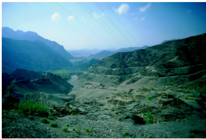
✦ 阿富汗全国多山，兴都库什山脉以及衍生出来的其他山脉占据了阿富汗大部分国土。

阿富汗是一个多山的高原国家，处在帕米尔高原和伊朗高原之间，全国地势大体上自东北向西南倾斜。境内高山纵横，沙漠广布，大部分国土是山地高原。山地和高原约占全国面积的4/5，平均海拔900米~1200米。平原占全国面积的1/5，分布在西南部和北部。西南部有大片沙漠。帕米尔高原向西南放射延伸形成世界上最大的山系之一——兴都库什山脉，它是阿富汗国土的地理分界线，绵延1200千米。兴都库什山脉自东北斜贯西南，将全国分为北部平原，中部山地和西南沙漠三大自然区域。