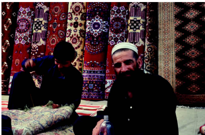
✦ 卡拉奇是全国第一大城市，位于印度河三角洲西面，其工业基础薄弱，主要以纺织业为主，地毯是卡拉奇常见的纺织品，其精美的手工艺艺术让人们赞叹不已。