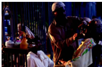
✦ 卡拉奇街头的理发师通常有很好的生意，人们总是愿意光顾这种平和的小地方。