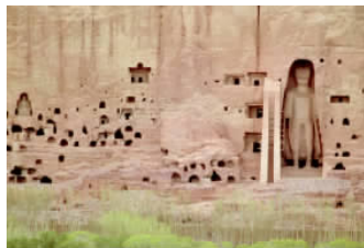
✦ 阿富汗东北部的悬崖边有无数小石窟，这是一个高达36米的佛像遗迹，它的雕刻技巧以及位置至今让人们叹为观止。