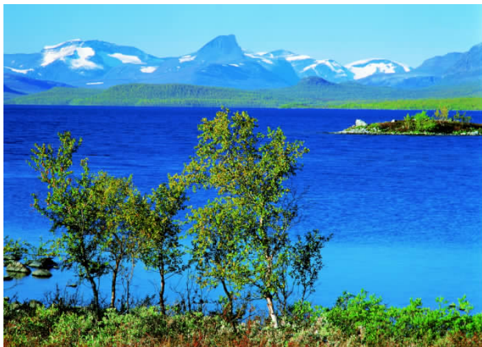
✦ 瑞典是个美丽的国家，起伏的山岭和星罗棋布的湖泊让人流连忘返。