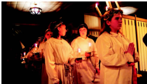
✦ 露西亚女神节上头顶蜡烛的美丽少女

瑞典的历史可以追溯到大约8000年前，欧洲大陆冰雪消融，境内开始有居民。1100年前后开始形成国家。在世界历史进程中，瑞典曾一度是一个中立的国家，致力于和平事业的发展，树立了良好的国际形象。瑞典著名科学家诺贝尔所设立的诺贝尔奖涉及经济、文学、医学、化学、物理、和平等方面，为推动人类的进步做出了贡献，在全世界影响颇大。