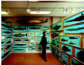
✦ 渔业一直是挪威主要的传统经济部门，挪威的捕鱼量十分巨大，捕鲸业居世界前列，卑尔根的鱼博物馆闻名遐迩。

挪威人在饮酒、敬酒时有一套复杂的注目仪式：举起杯子，凝视对方的眼睛，然后说干杯，互相碰一下玻璃杯，再一次凝视对方的眼睛，之后等对方先干杯后再饮尽。