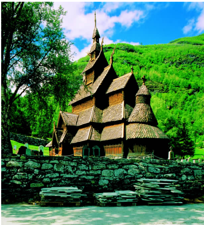
✦ 奥尔内斯木板教堂外观的装饰物既有基督教的十字架,又有根据北欧神话传说创作的兽头形屋檐顶尖。

挪威的历史可以追溯到8世纪。那时候,居住在今天挪威的日耳曼人就形成了20多个部落。和许多北欧国家一样,挪威的历史上也存在着战乱频繁的“海盗时期”。在以后漫长的中世纪时期,挪威曾经两度处于外国的统治之下,坚强勇敢的挪威人民进行了艰苦卓绝的斗争,终于取得了国家和民族的独立。在历史发展过程中,挪威人在文化方面取得了巨大的成就。