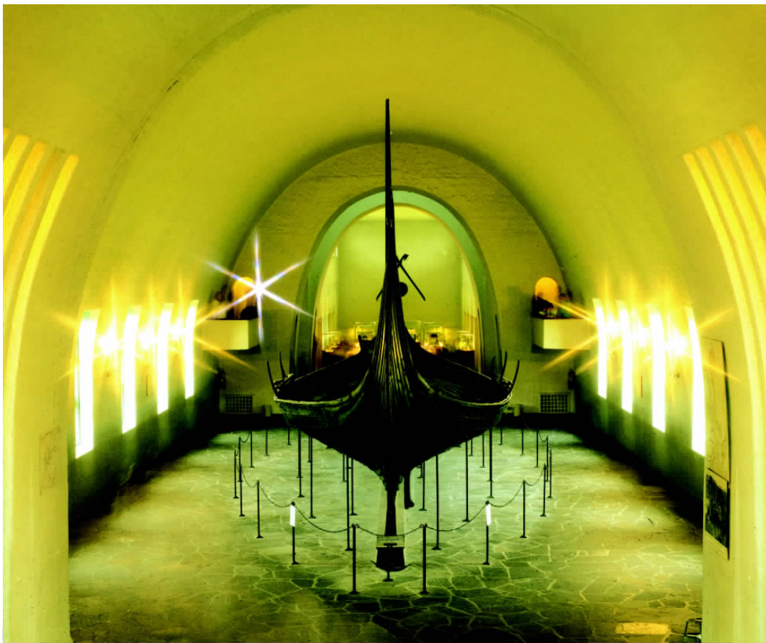
✦ 挪威造船工业历史悠久, 工艺水平较高。从图中的船舶博物馆可以看出挪威人对造船业的重视。