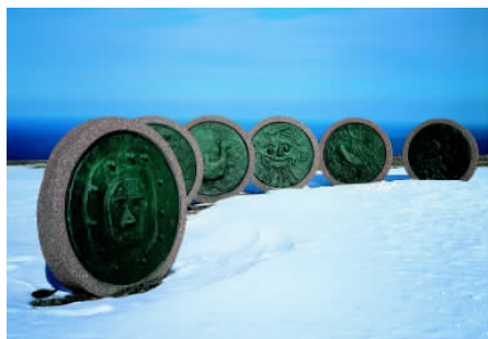
✦ 位于挪威马格尔岛的北角在地理上的意义十分重大,这里的标志既是航海的陆标,也是欧洲大陆的最北端。

当前挪威28座木板教堂中最宏伟的一座,建于12世纪。其背后是长满林木的山麓,前面有石块筑成的围墙。该教堂共3层,全部用木材建筑而成。每层都有陡峭的披檐,上面有尖顶,外形很像东方式古庙。教堂里的圣台、布道坛、边座、唱诗班的屏饰和壁画等都是1700年前的物品,至今仍保存完好,每年都吸引了大量的游客到这里参观。该教堂已被列入联合国科教文组织世界文化遗产之一。