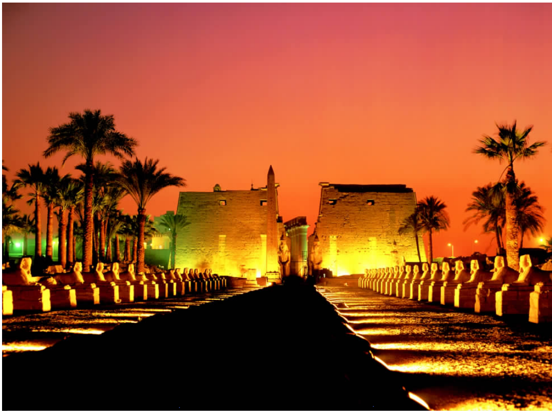
✦ 卢克索神庙的羊首司芬克斯大道宽阔壮观，连接着不远处的卡纳克神庙。