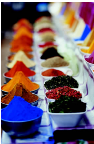
✦ 享誉世界的埃及调料

为古代世界建筑中的一个奇迹。在卢克索附近的山谷中，大约隐藏着500多座古代陵墓，著名的帝王谷就坐落于此，为这座历史文