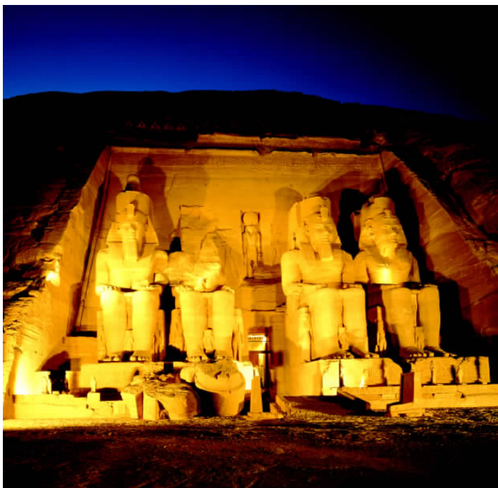
✦ 阿布·辛拜勒神庙的门首，法老庄重的目光凝视着前方，引导埃及精神永远保持坚定向前的方向。

埃及的阿布·辛拜勒神庙是一个雕凿在悬崖上的奇迹。它建造于埃及第十九王朝法老拉美西斯二世统治时期。神庙在尼罗河西岸的峭壁上凿成，高约33米，宽约37米。正面4个巨大雕像即法老拉美西斯二世本人，它们逼真地再现了法老的形象，其中的一个由于地震破坏而缺损了头部。在4尊雕像的小腿之间有一些小雕像，为拉美西斯二世的妻子和儿女。神庙内的石壁上有图画和象形文字，描述拉美西斯二世执政期间的生活情景、与赫梯人的战争等。阿布·辛拜勒神庙就是拉美西斯二世为了纪念对努比亚人的胜利而修建的，是埃及文明坚定不移的意志的象征。