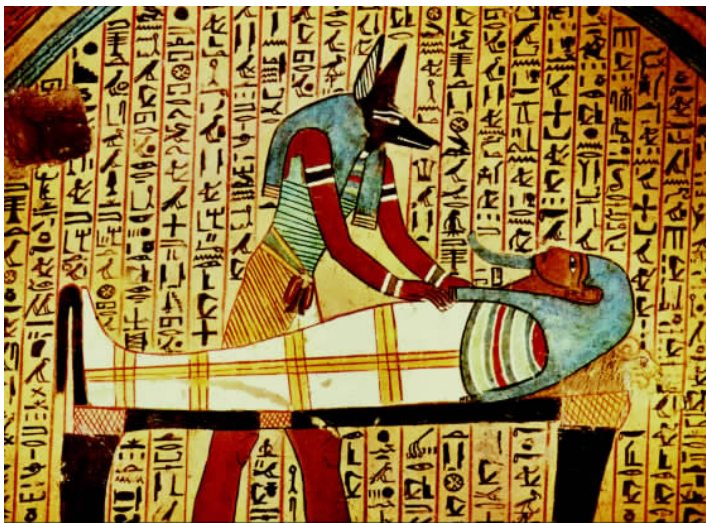
✦ 象形文字的书写方式有直式和横式两种，直式从上向下写，横式从左向右写。

的一座金字塔，被称为门卡乌拉金字塔。3座大金字塔的周围还有3座小金字塔、狮身人面像以及一些神殿，它们共同构成了埃及吉萨高地的古建筑群。