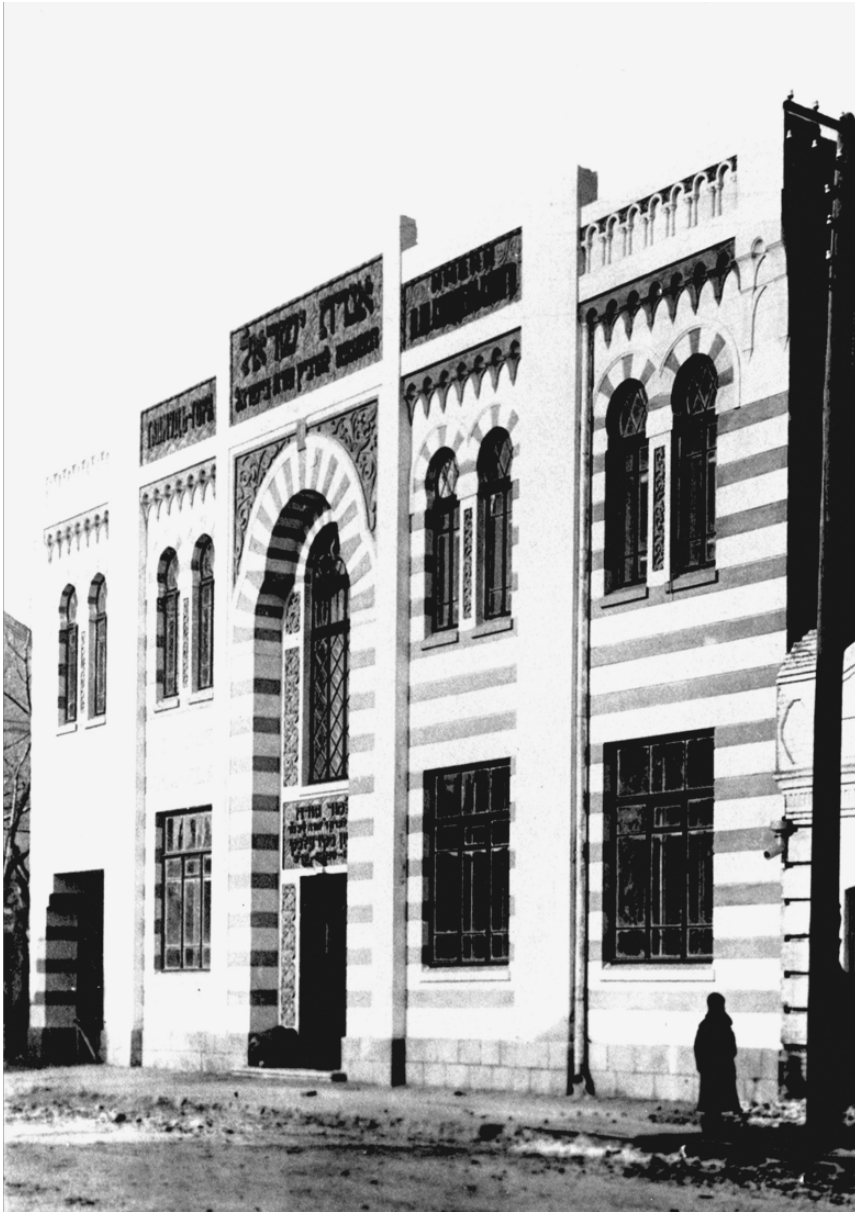
摇摇哈尔滨犹太民族宗教学校斯基德尔斯基塔木德托拉创办于1920年，位于马街（现东风街）22号