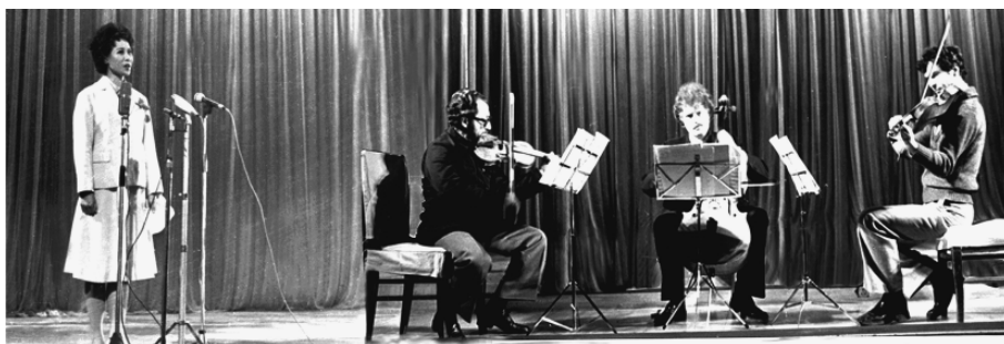
摇摇1979年10月斯特恩回到家乡哈尔滨演出室内乐三重奏