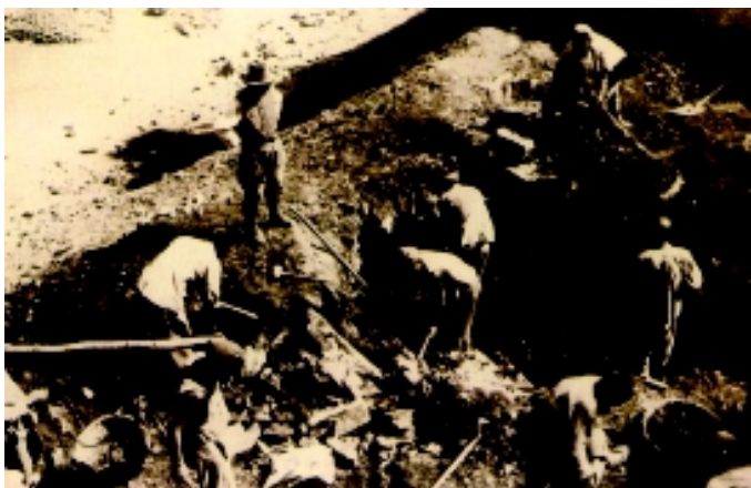
【“北京人”头盖骨发掘现场】

1927年周口店龙骨山发掘现场的珍贵留影，他们的执著发掘最终震撼了全世界的人类学家。