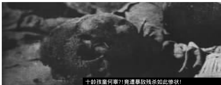
十龄孩童何辜?!竟遭暴敌残杀如此惨状!

亲爱的姊妹们！不用犹豫，不用徬徨，敌人能够给我们沦陷区域内的妇女尝受莫大的痛苦与侮辱，你能算得定将来，敌人不会同样地加之于你们吗？千万件伤心怵目、惨不忍闻的敌人残害我国女同胞的事实，我们不能“听过即忘”，我们要痛定“思痛”，把这仇恨记在心头，把责任荷上肩头，我们要伸张正义，维持人类间的道德，扫除人世间的恶魔——倭寇，只有把“劳力”与“智慧”去献给我们的民族。我们要为万千日寇铁蹄下的女同胞伸冤复仇，那么只有拿我们的“血”，我们的“热血”，去抹掉敌寇所加诸在我们身上的一切污迹！