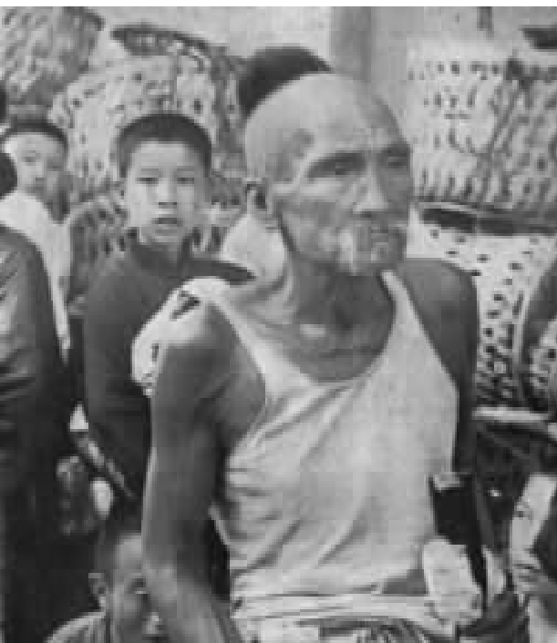
残酷敌机，轰炸上海市无辜民众 图示：被炸后遍地都是斑斑血迹

中华民族宝贵的鲜血，染红了将近半个中国！在我们和倭寇生死大决战的过去7个月内，敌人每踏上我们一块领土，每占据我们一个城市后，即施其奸掳烧杀，无所不用其极的暴行。这批如疯如狂的日本军阀的走狗，我们再不用怀疑他们还有丝毫的人性了！敌人对不及逃出战区的中国人，无分军民，敌人的屠杀，是从不加以任何分辨而执行的；在这种残酷的场合之下，更有使你触目惊心、悲愤无以自抑的事实在层出不穷地出演着，只要你翻开每天的报纸，显现在你眼前的，都是一大堆血迹斑斑的、我们“战区妇女受辱”事件的记载，这笔惨绝人寰的血账，定会深刻在你的脑膜，而使你终身不忘。