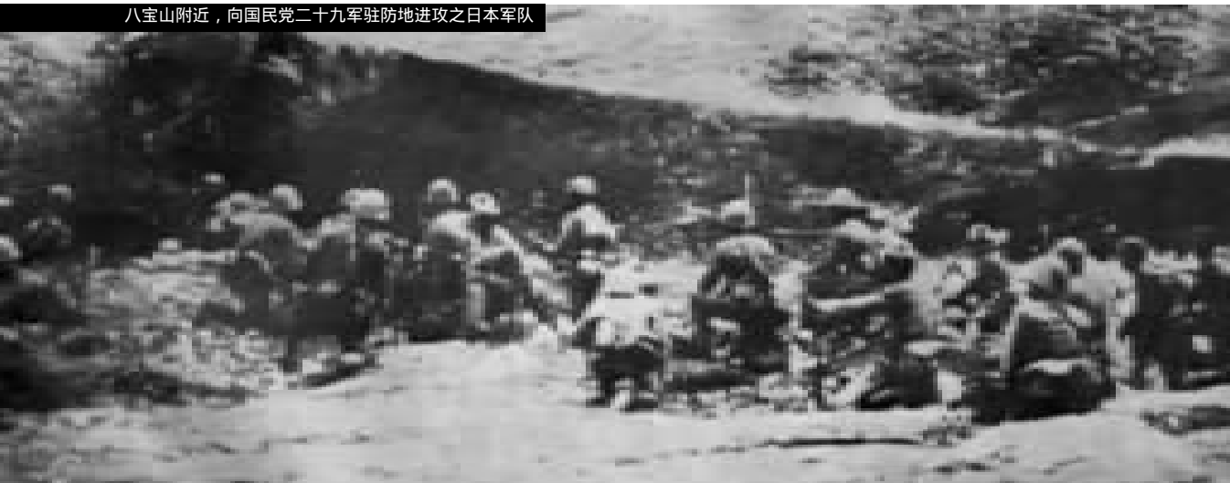
准备向卢沟桥进攻之日军