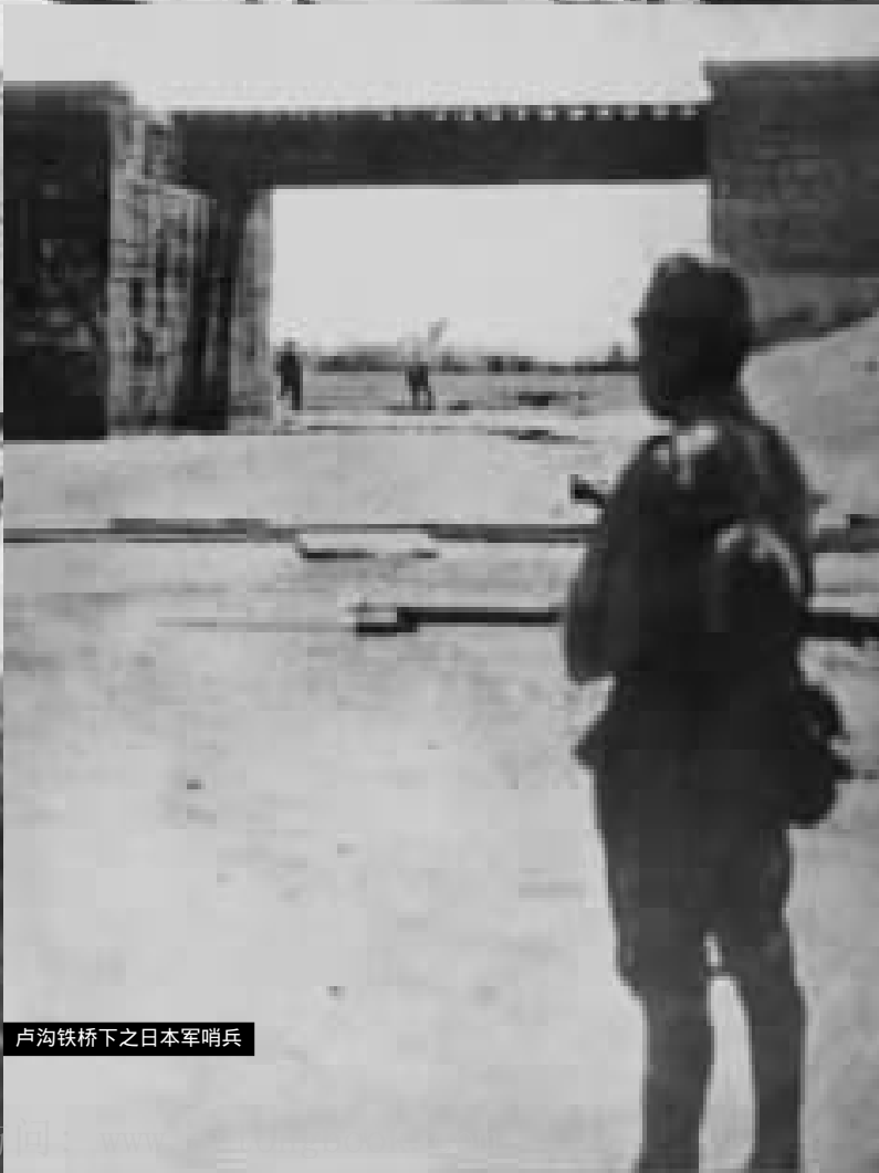
卢沟铁桥下之日本军哨兵