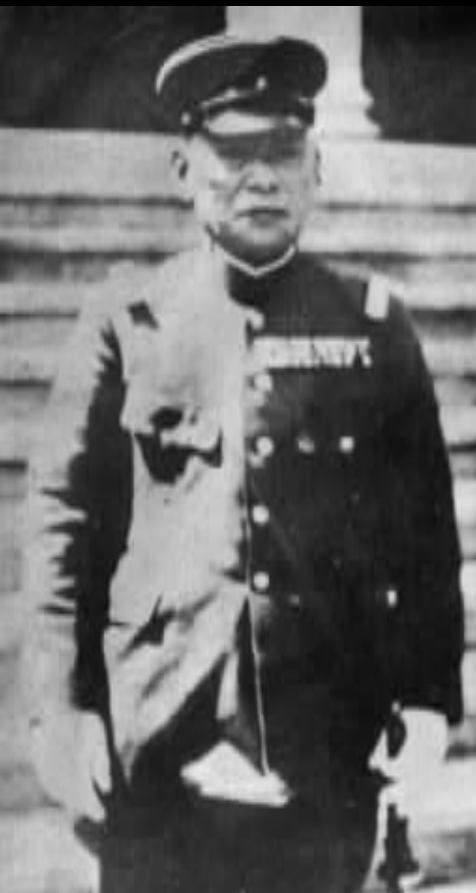
日本侵华急先锋华北驻屯军司令之香月