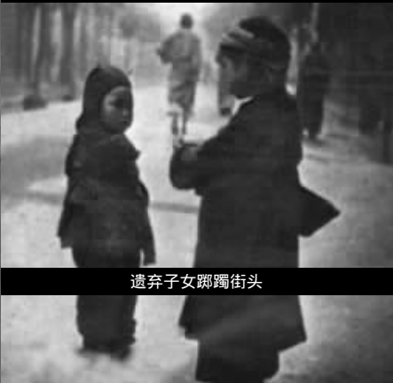
遗弃子女脚踏街头