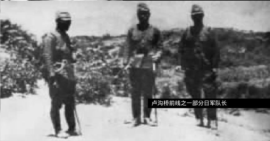
卢沟桥前线之一部分日军队长