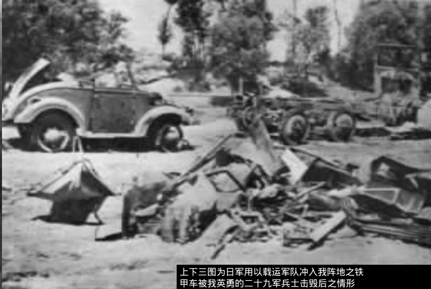
上下三图为日军用以载运军队冲入我阵地之铁甲车被我英勇的二十九军兵士击毁后之情形