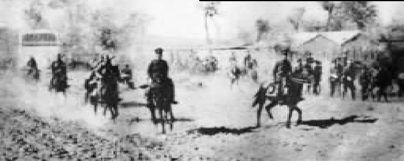
源源而来向卢沟桥进发之日本军队