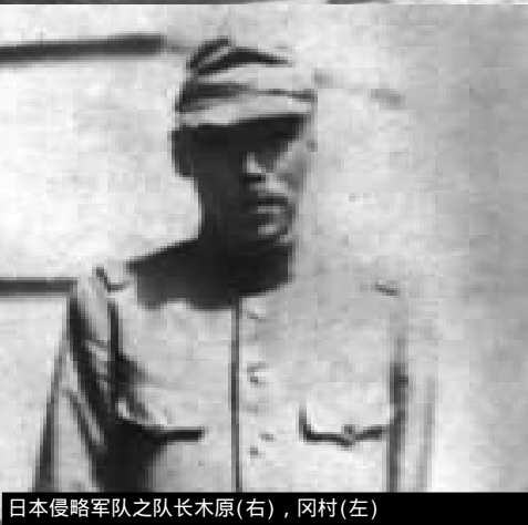
日本侵略军队之队长木原(右),冈村(左)