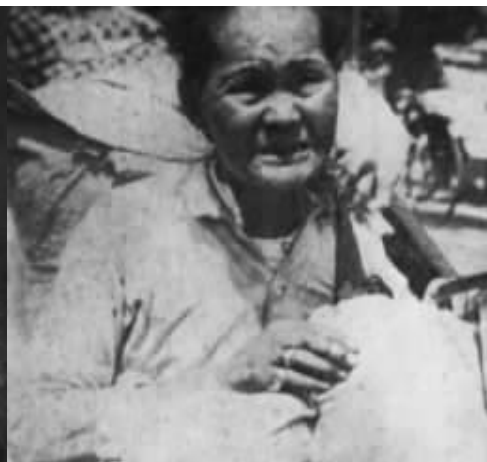
流离失所之老妇，穷途踟蹰，欲归无路