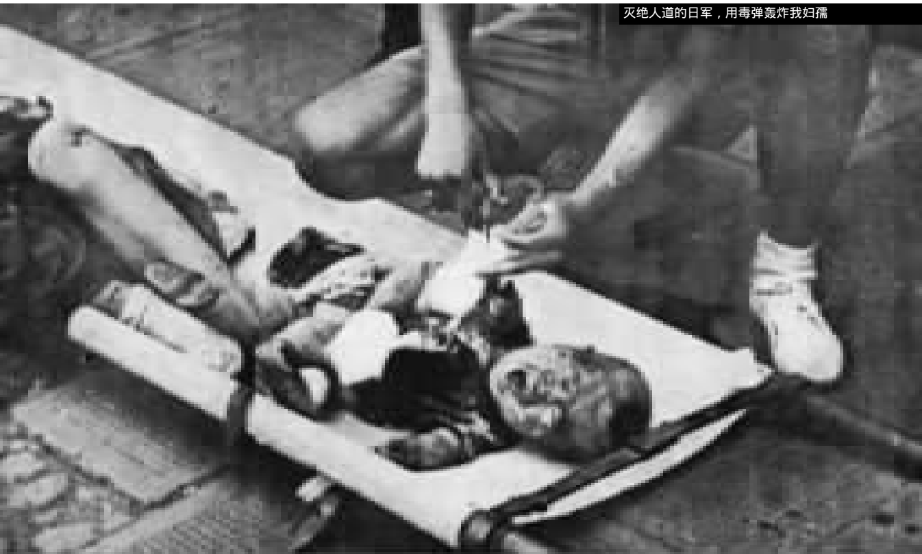
灭绝人道的日军，用毒弹轰炸我妇孺