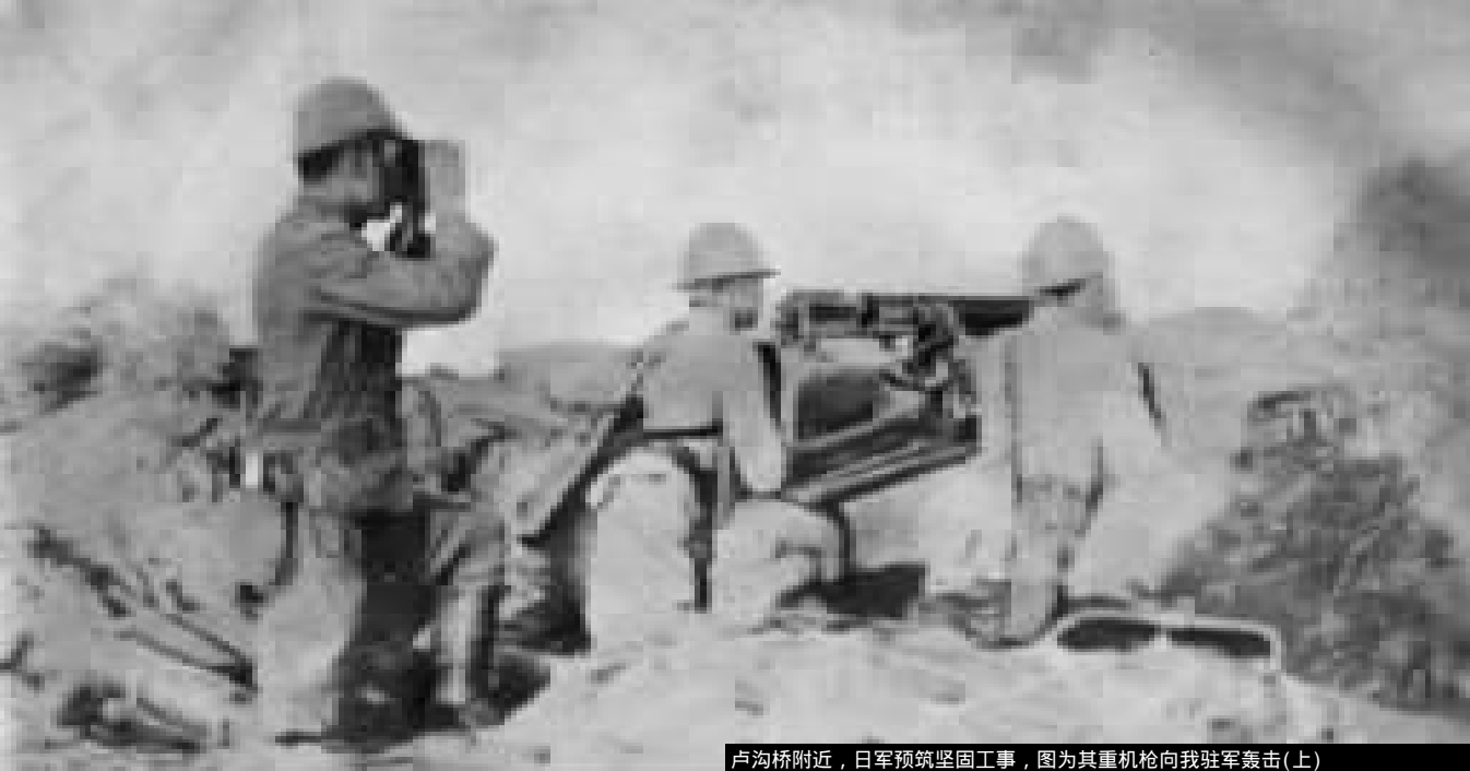
卢沟桥附近，日军预筑坚固工事，图为其重机枪向我驻军轰击(上) 日军每藉演习而肇事端，此为其演习情形，竟成向我进攻之准备(下)