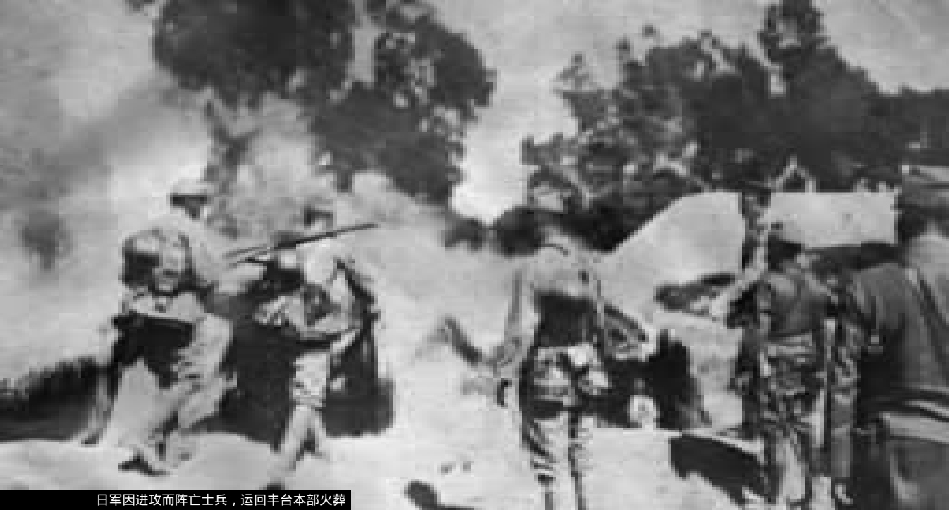
日军因进攻而阵亡士兵，运回丰台本部火葬