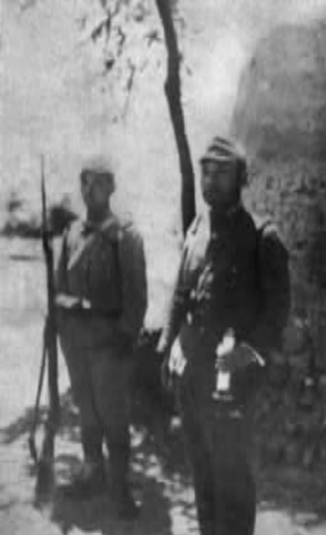
日本在卢沟前线的军官