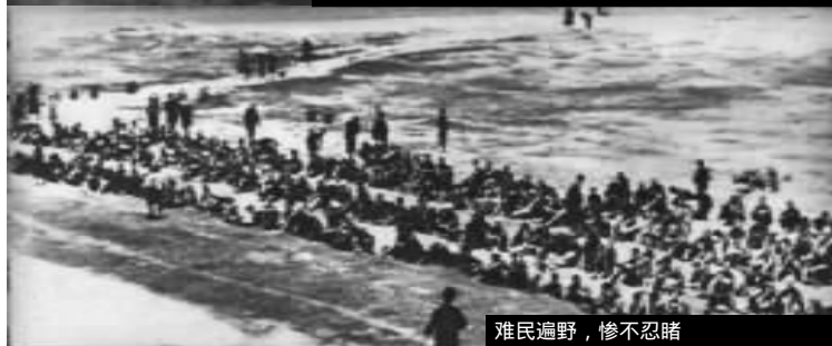
难民遍野，惨不忍睹