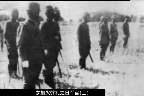
参加火葬礼之日军官(上) 卢沟桥附近之日本侵略军队(下)