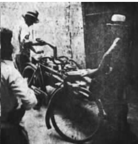
爱国同胞，沿路见有受伤人民，即帮助送往急救医院