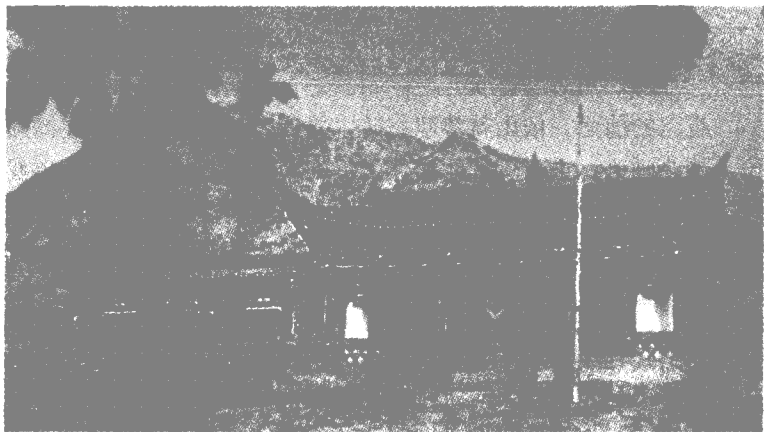
石窟外景

接引寺石窟创建于北魏。远远望去，仿佛是一座结构精巧，典雅玲珑的山中楼阁，此乃洞窟的正门。石窟宽 8.5 米，深 7 米，高 5 米。中心方石柱紧抵窟顶，方柱宽 2.5 米。柱前开龕，