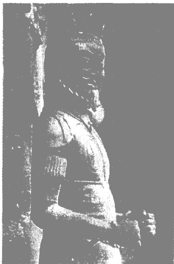
5窟踏牛天玉 唐代

圆润、端庄雄健的新风。艺术手法将现实主义和浪漫主义相结合。现存 10 多个洞窟中的 40 多尊塑作，大都面容饱满，躯体高大健美，肌肤丰腴，衣饰华丽，这是隋唐盛世的历史写照和审美思想的反映。悬立东崖壁面气势磅礴的石胎泥塑大佛像，为隋代造像之壮举。主尊释迦牟尼高 16 米，侧立二菩萨，它们傲立崖面，高瞻远瞩，气宇轩昂，具有观照“大千世界”的雄伟气概和笑迎天下的宽广情怀，是麦积山大型雕塑之冠。第 5 窟牛儿堂中窟前廊的踏牛天王，是一组精美的