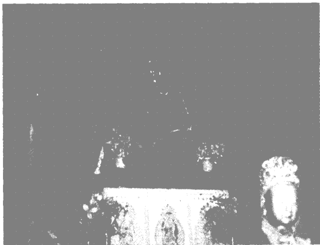
石窟造像

石窟的前面，依山就势建有砖木楼阁，为砖券拱型，飞檐翘角，雕甍画梁，虽不算瑰丽宏伟，然亦不失精巧玲珑，反映出我国民间工匠精湛高超的建筑技术。该建筑系清康熙十二年（1673）增修。寺窟门楣砖匾额大字脱落，但残存部分的小字，仍可隐约看出“清代嘉庆丙辰年间重修题记”的落款字样。