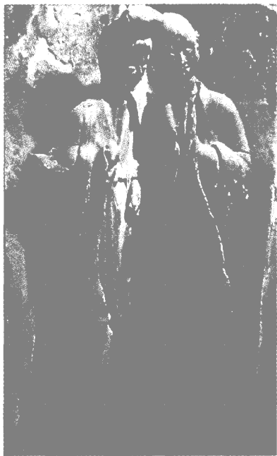
121 窟菩萨与弟子 （西魏或北周）

麦积山西魏泥塑既发挥了魏晋艺术传统优势，又吸收融化了外来艺术的影响，在造型、服饰、审美趣味上均形成了本民族独特的风格。