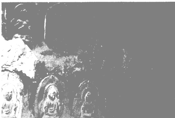
窟内千佛塑像（唐或五代）

重修，楼宽 3 间，高 3 层，一楼出廊，四明柱。廊深 3 米，进深 3.3 米，具有石窟前殿的作用。南侧有木梯可登二楼。二楼东南北三面出廊，边置围栏，中间为佛阁，阁内塑像已毁，现补塑普贤菩萨。上为八角攒夹亭，纯为木结构。