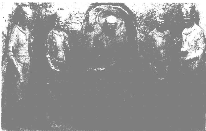
62窟佛与菩萨（北周）

第 62 窟为北周重要洞窟，窟内的 12 身塑像十分精美。佛慈祥大度；菩萨纤细窈窕，神情高雅，身前帔巾和缨珞交织穿插，层次分明，衣纹疏密适度，妥贴舒服，宝冠、项饰、手镯、臂钏等饰物考究精美，配置得当，显得极其华贵富丽。令人叹为观止。第 4 窟上七佛阁的 42 尊菩萨像，饱满丰润，相貌端庄可亲，