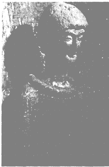
123 窟男侍童 西魏。

麦积山泥塑艺术到北周开辟出新天地。它承续北魏“秀骨清像”余风，发展了“形神兼备”的民族艺术传统，创造出敦厚壮实、珠圆玉润的风格。艺术手法趋向圆熟洗练，作品更为真实和谐。现存的数白身造像，大都脸形丰圆，柔和亲切，体形匀称，结构准确，衣带活风，绮丽纤浓。出