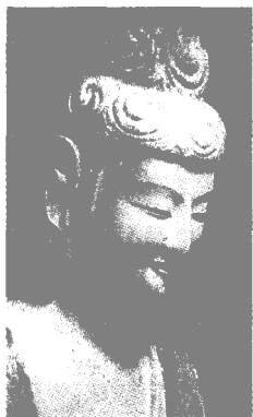
44 窟佛（西魏）

身躯侧扭，低首含嫣，左手抚腰弄带，流露出含蓄沉静的内心世界。而第 142 窟众多精美影塑供养人，更叫人赞不绝口。一身仅 10 厘米的丰腴女供养人，头戴龙冠，长袍曳地，一手掌灯，一手牵孩，徐步缓行，表现出一雍容华贵妇女带领孩子祈福的生动场面，是极为精美的稀世珍宝。 麦积山西魏泥塑既发挥了魏晋艺术传统优势，又吸收融化了外来艺术的影响，在造型、服饰、审美趣味上均形成了本民族独特的风格。这时的作品以中小型为主，题材更为广泛，技法多为薄影泥塑，造型优美潇洒，表现出以形写神、形神兼备、气韵生动的美学特征，以第 121、123、127、44、135、101 诸窟为其代表。造像的共同点是，面容清癯秀美，峨冠高履，宽衣博带，长裙拖地，衣纹流畅丰圆。它们已冲破宗教的樊篱束缚，“神”人交融，风采各异。第 121 窟两对菩萨和弟子紧紧地靠拢在一起，嘴角挂笑，含情脉脉，那交头接耳、亲切甜蜜的神态，似乎在窃窃