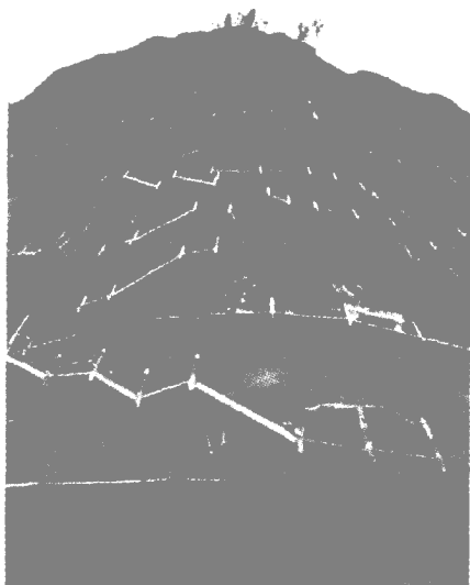
石窟外凌空栈道

有：1窟（涅槃洞）、3窟（千佛廊）、4窟（七佛阁）、5窟（牛儿堂）、133窟（万佛洞）、135窟（天堂洞）、以及第23、43、44、74、78、121、123、127、165等窟。共保存了1500多年以来的雕塑7200余身，壁画1000多平方米，大型崖阁8座，是研究中国古代雕塑、绘画、工艺、建筑、宗教及社会风俗等方面形象而系统的珍贵资料，被誉为“东方雕塑馆”。