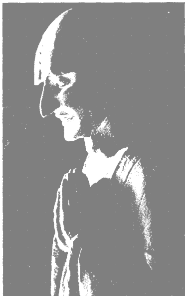
87 窟弟子迦叶(北魏)

麦积石窟泥塑以北朝作品最多，其中北魏中期作品更趋成熟精美。80 多个洞窟中的数千身塑作，已逐步摆脱了早期造像的特征而呈现出清秀俊美的风韵。这时期造像，大都体型修长，清癯俊俏、宽衣博带、飘逸洒脱，颇具南朝士大夫风骨，为中国“秀骨清像”型的典型代表，这是当时社会风尚和审美理想的反映。艺术风格，突出以形写神的民族传统表现手法。技艺上，柔和流畅自如，富于质感的阴刻压线取代了犍陀罗式衣纹。佛不再神秘、冷漠、森严，而是慈祥 and 善，向世俗化迈进。第 23、87、127、142、133、115 诸窟为这一时期代表。第 23 窟内的佛，细颈削肩，眉清目秀，褒衣博带，风骨潇洒。右侧的菩萨，小巧隽丽，柔姿绰约，