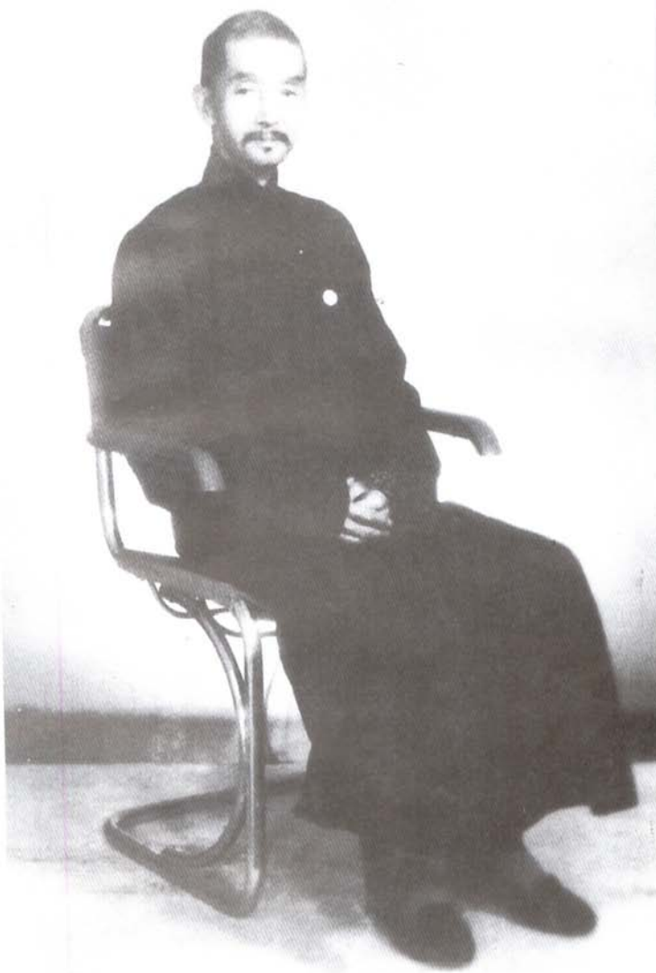
慎之先生在西北军政委员会工作期间