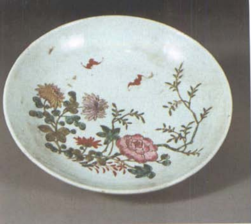
慎之先生为甘肃省博物馆捐赠的部分文物