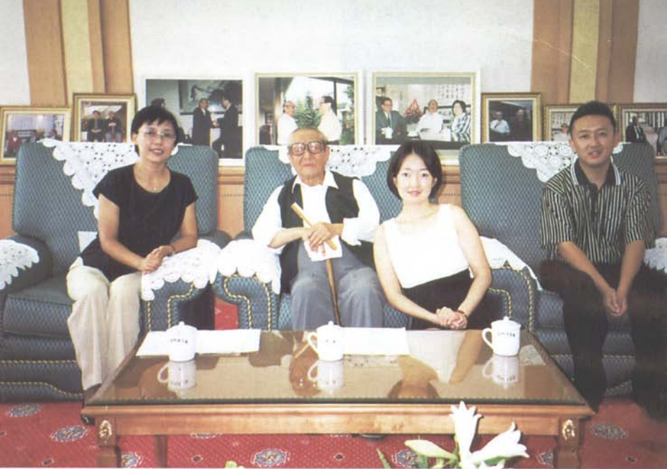
习仲勋同志在深圳接见杨思先生孙女等的合影