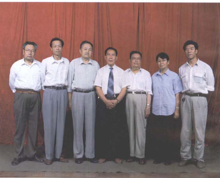
主编流萤同志和《慎之先生》编撰人员合影