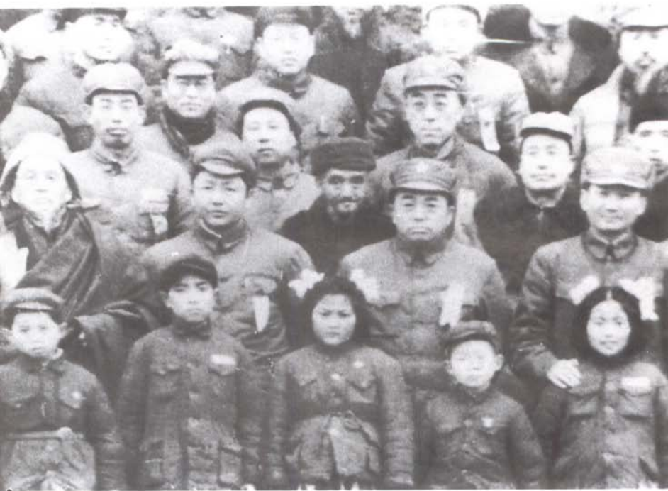
慎之先生在西北军政委员会时与彭德怀等领导同志合影(局部) 二排右起张治中、彭德怀、习仲勋,三排右起第二人为慎之先生