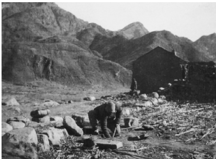
敌后根据地的民兵正在埋地雷。

抽兵南下的意图，防止占领区治安形势的恶化，保障后方的安定和交通线的安全，对华北各抗日根据地再次进行大规模的扫荡。