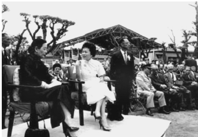
宋美龄(左)与陈香梅。

的权力开始遭遇到抗战以来前所未有的挑战，而且他在领导抗战中积累的威望已经被政治上的无所作为所抵消。