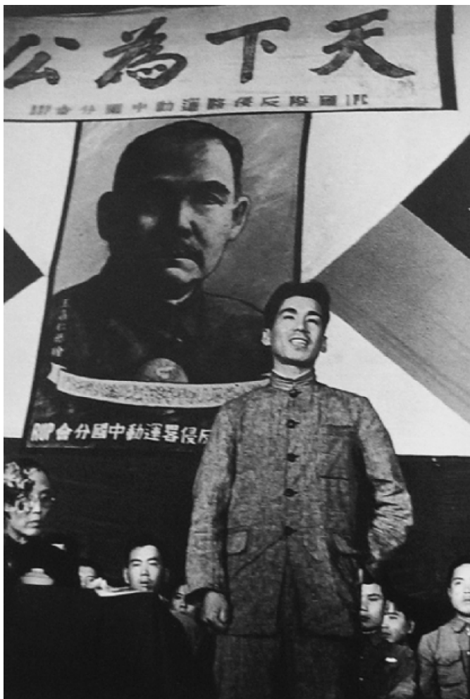
1943年，日人反戰同盟西南支部一成員在重慶發表演說。