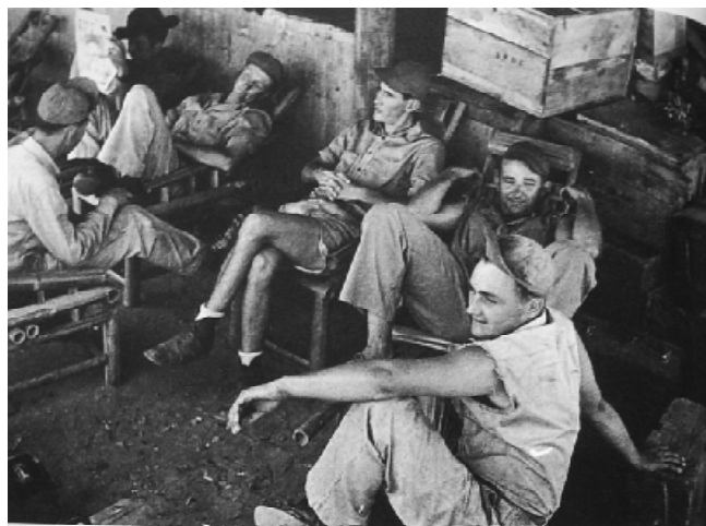
1943年衡阳基地的飞虎队员。

国民政府及蒋介石在美国树立的美好印象也开始崩塌，就像一个充气过了分的氢气球一样，处于快要爆炸的危险状态，幻想的破灭也是在1943年夏。在中国生活长大的赛珍珠曾以《大地》一书荣获1934年诺贝尔文学奖，《大地》一书就是以中国农村为题材的。蒋介石夫妇喜欢庐山，而庐山也是赛珍珠居住过的地方。但赛珍珠不喜欢宋美龄曾在美国风靡一时的谈吐，她评价宋美龄作为罗斯福的宾