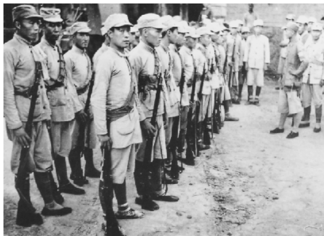
准备出发的八路军小分队。

日军还以第三十二、三十五、三十七、五十九、六十二、六十九师各一部与伪军共30000多人以铁壁合围铁滚式等方式对冀鲁豫区和太行区进行大规模扫荡，但在死伤7500多人后扫兴而归。最有讽刺意味的是，日军试图用轮番清剿的所谓铁滚式战法彻底摧毁太岳抗日根据地，建立“山岳剿共实验区”。为此，日方专门组织了将、校、尉三级军官120多人组成“观战