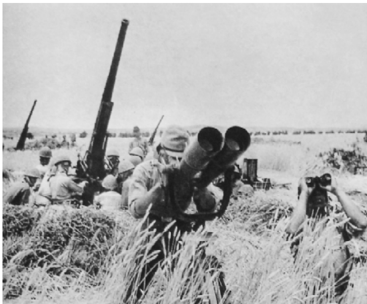
日军作战行动受到中美空军的打击，防空部队变得非常狼狈。