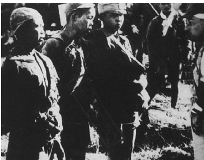
在岳阳被俘的中国少年兵。 这是日本军方当时认定为不 许可发表的照片。