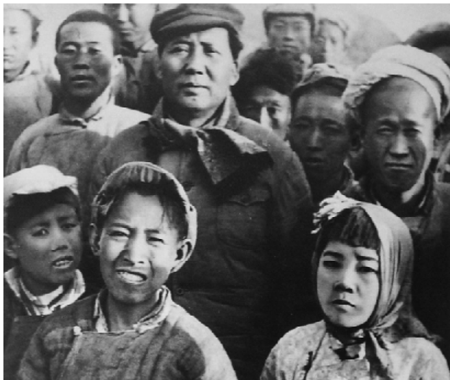
1943年春节，毛泽东与秧歌队员在一起合影。

知识分子逐渐失去对政府的忠诚，考古学家李济对蒋介石出面支持限价的行为感觉近乎可笑，仿佛经个人要求就会改变经济规律。在昆明，学者们对蒋介石既做英雄，又充做圣贤进行了尖刻的嘲弄。金岳霖拒绝阅读蒋介石的新作《中国之命运》。知识分子们认为，如果他们是真正受到重视的，或者在国难当头之时上上下下的阶层是同甘共苦的，那么即使清贫挨饿也没有失落和怨恨，但在亲眼目睹如此触目惊心的不平等现象和社会上层的奢侈浪费之后，天真但敏感的知识分子终于开始心灰意冷了。偏偏自大而麻木的政府对教师们挨饿显得很冷漠，但对加强政治和精神控制却兴趣盎然，党化教育毫不放松。