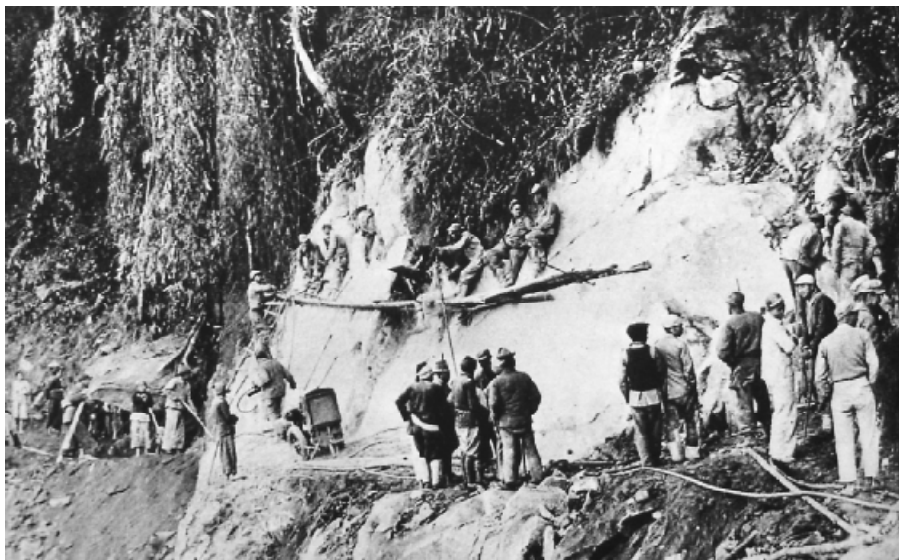
施工中的列多公路。