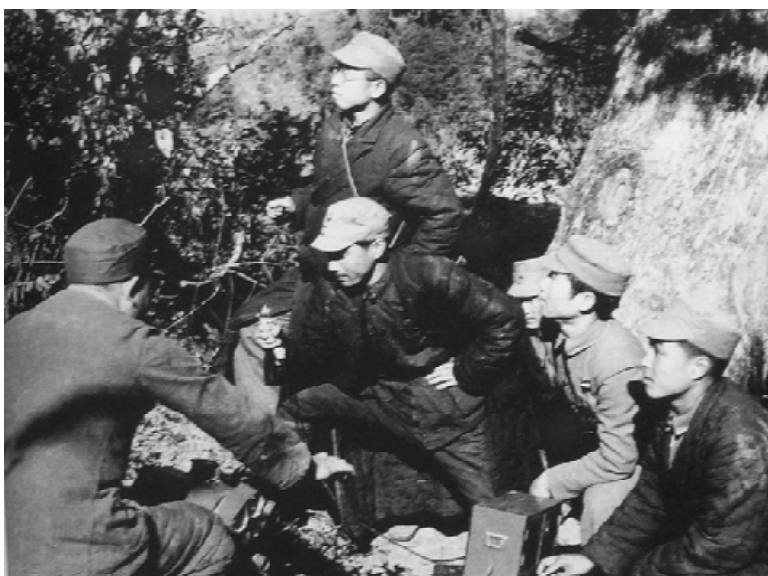
在华日人反战同盟人员 在对日军喊话。