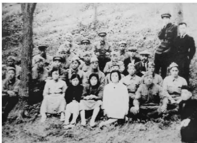
抗联教导旅部分军官和战士。