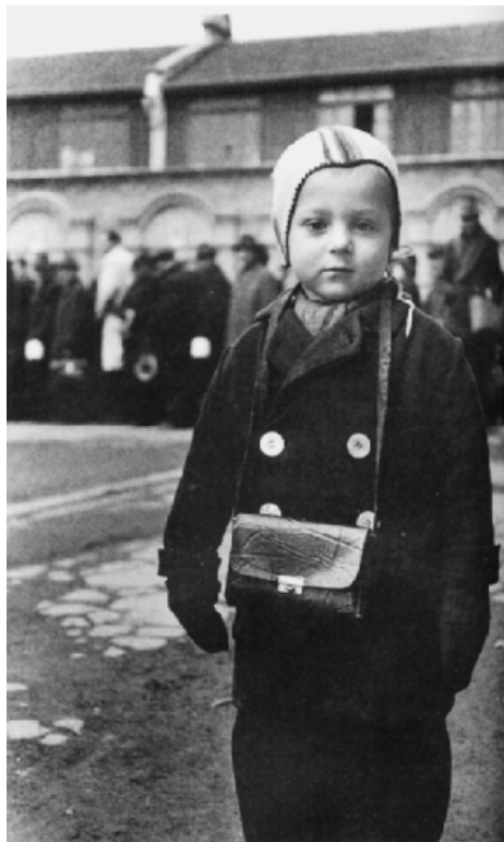
納粹德國在歐洲迫害猶太人，致使很多歐洲猶太人到上海來避難。圖為上海的猶太孩子。