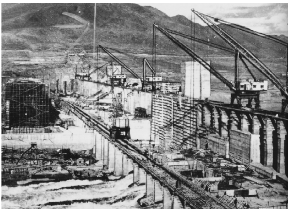
日本在吉林松花江流域修建的丰满水电站，1943年开始发电。