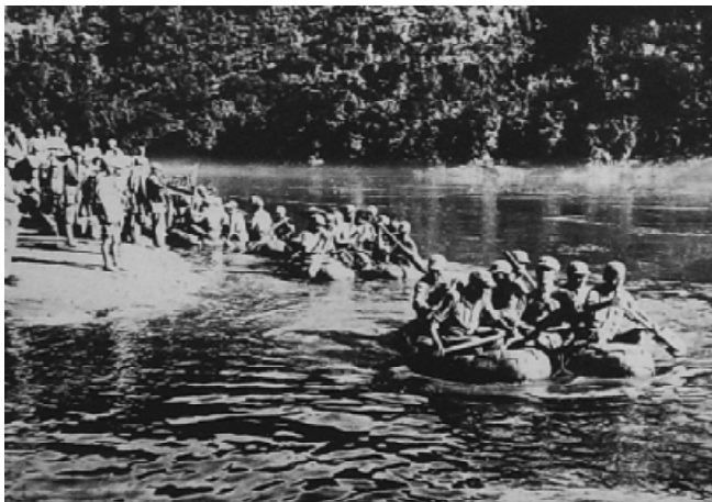
1943年，中国驻印军开始准备反攻缅北。图为渡过萨尔温江的情形。

不断发出。中国政府实行统治时一向特别依赖道德的声望，因为中国的中央政府历来不过是稀疏而分散地凌驾于广大民众之上的行政和司法官员构成的薄薄的一个阶层。作为统治者，与其说依靠实力，不如说依靠威信和它的公众形象，当人们从怀疑发展到确信它是不道德的政府时，这个政权的命运就岌岌可危了。