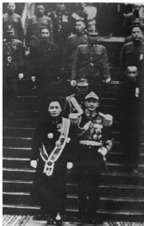
1943年国民政府主席林森逝世，蒋介石继任主席。