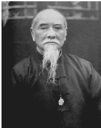
国民政府主席林森。他从1931年起出任国家元首长达12年，直至去世。他与喜欢大权独揽的蒋介石共事多年却相安无事，完美完成了法律让他扮演的“虚君”角色。

这一年，由于国民政府主席林森遭遇车祸去世，蒋介石继任了国民政府主席。到此为止，他已经获得了所有的最高名位，还在拼命地强化他个人的权力，但政府的无能并不因此而改变。他面临众多问题：他的政治对