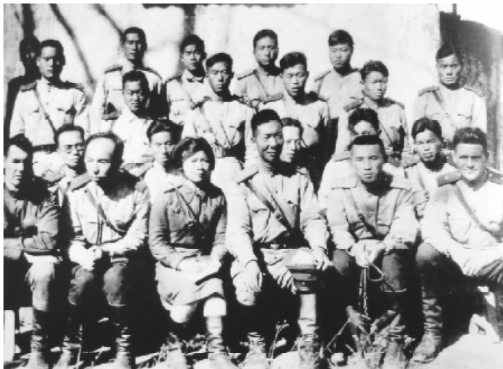
1943年10月5日，由退往苏联的抗联战士组成的教导旅的指战员在野战演习以后留影。