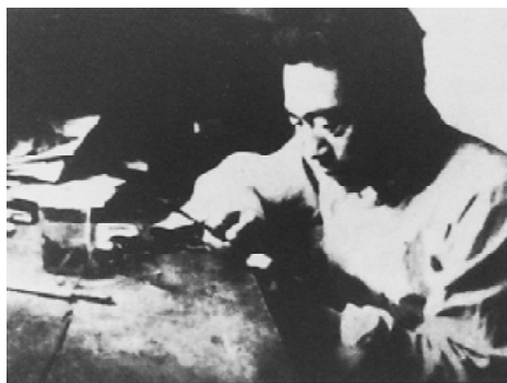
因生活所迫，西南联大教授闻一多挂牌刻制图章。

在1943年发生了奇怪的事，这年已经是抗战的第七个年头，战争是头等大事，可是重庆政府下达了紧缩兵工生产的命令，经费减少，人员也要裁去五分之一。金陵兵工厂的厂长李承干拿出花名册，告诉上面来的人说：“我这里没有闲人，每个人都有工作，一个不多，一个不少，花名册上个个有保人和相片的。”这一年，美国顾问来华调查，结果纳尔逊发现中国兵工生产的水准低下。竟然有的士兵在一年内分配不到一颗子弹的怪事情。