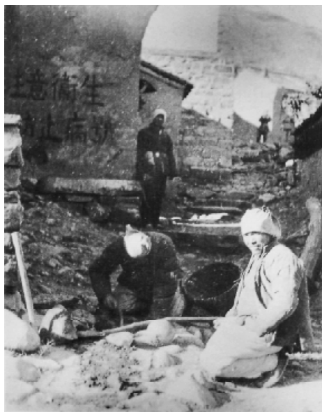
敵後根據地的民兵在埋地雷。