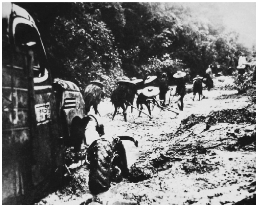
1943年中方正在修建公路，有时一天24小时施工。