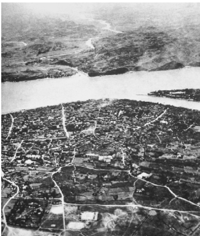
宜昌是陪都重庆的大门，武汉失守时中国的大量物资、人员从这里运往内地。

这年5月，纳粹德国打破了西欧宣战以后却并无战事的奇怪局面，大举进攻法国。在坦克与飞机等武器使用上，军事观念已经远远落伍于德国的英、法联军在欧洲大陆的抵抗迅速瓦解，在抵抗不到40天后，法国政府决定向德国投降。英国军队经过敦刻尔克大撤退后，丢弃了大部分装备，