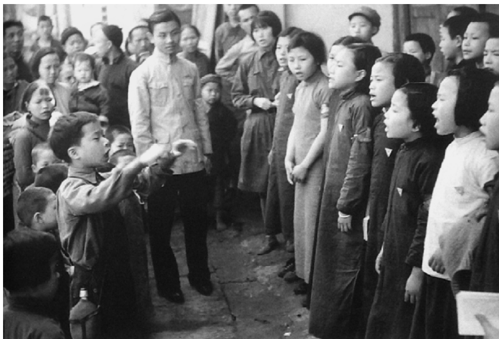
1940年学生宣传队到重庆乡间演出的情形。