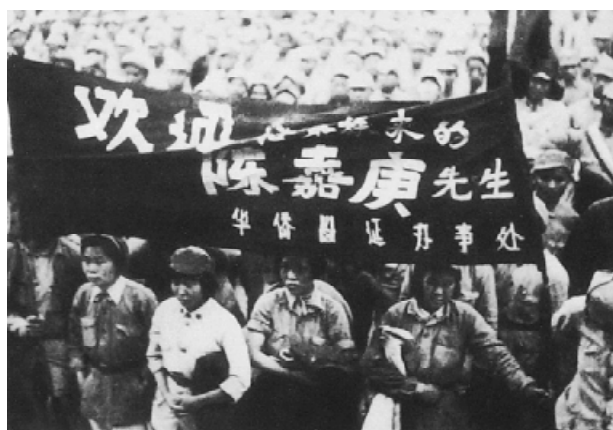
1940年6月，陈嘉庚一行到达延安，受到欢迎。