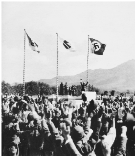
1940年9月27日，日本与德国、意大利的三国同盟签字。图为在南京的日军中国派遣军总司令官西尾寿造带领部下三呼万岁。

1940年10月底，鉴于战事已经进入越南，困守广西南宁一带的日军无心驻留，逐渐从桂南撤退，广西境内已无敌踪。图为中国军官重回南宁以后的留影。