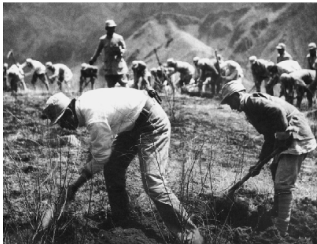
太行军区部队官兵在开荒种地。