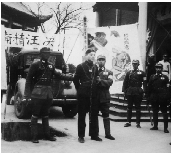
抗日宣传队在湖南演出处决汉奸汪精卫的戏剧。