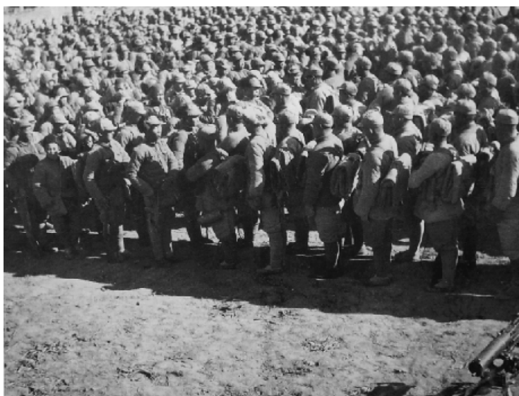
1940年1月，新军决死一纵队与决死三纵队在沁源县马西村会合。图为两支部队相向而立，表示团结。

事实是四川目前普遍现象，则为大小地主之普遍囤积，其对米价上涨之影响，较之都市米商囤积更大”。他便写了“四川食粮之供给与米价”一文，登载到11月17日重庆《大公报》星期论文，建议政府于战时得多掌握粮食，可改革佃农稻谷缴租方式而为法币缴租，