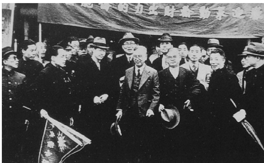
1940年3月，南洋华侨领袖陈嘉庚到达重庆，受到欢迎。