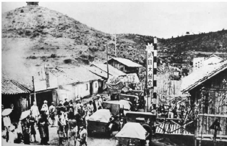
滇缅公路，1940年一度宣布关闭。中国对外交通线被日本全面封锁。图为滇缅公路途中离昆明不远的休息场所。

在停止大规模的战略进攻以后，日本政府想用“以华制华”的策略瓦解抗战的中国。在日本人眼里，汪精卫便是这方面的最好人选。这年3月，汪