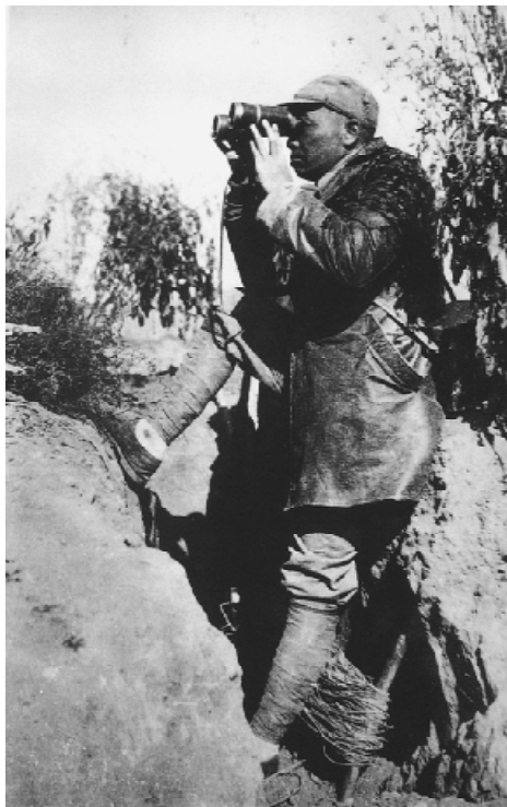
1940年8月20日到12月5日，八路军在华北发动百团大战。图为彭德怀在前线指挥。

景。但对战时经济异常重要的粮食生产却遭遇了歉收的局面。因为春旱，水稻种植面积减少，产量下降，但幸亏小麦等丰收，弥补了水稻的减产。粮食总产量只减少了10%。当时，重庆米价指数在所有物价指数中最为重要。而从1940年5月到12月，米价指数增加了4倍。米价暴涨的原因，不止是粮食歉收，滇缅路的中断与宜昌的失守导致了人心惶恐，一般主妇有点余钱，就多买些日用品，如肥皂、布料和罐头食品等，而地主与商人都开始囤积粮食。农业专家沈宗瀚曾经回忆当时的情景：1940年10月初，“内子骊英告我，日间房东太太与房东争吵，向骊英诉称：‘我家有田40余亩，收得