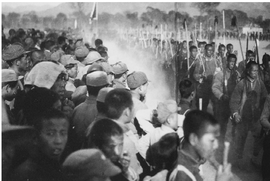
河北阜平县成立的人民自卫武装。

1939年是在乐观中告别的，动员了百万军队的冬季攻势便是这种乐观情绪的证明。但这个攻势延续到1940