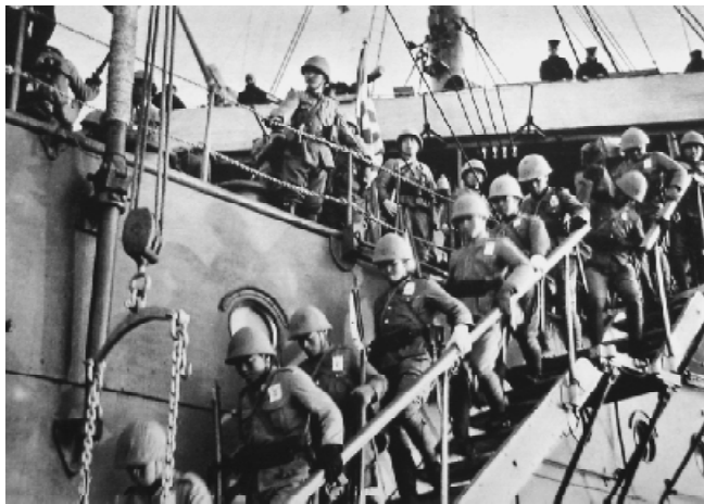
1940年1月，日军从山东省石岛登陆，进攻胶东地区。

1940年，日军的军事行动主要是围绕切断中国与国际的补给线而展开的。当时，东部铁路线已经大多陷于敌手，沿海口岸也相继陷落。在堵上中国的正门以后，日军还要把所有的后门、边门堵上，如果可能，连小小的出气孔也不放过。这年1月，滇越铁路中国段受到日本千余架次飞机的轰炸，理由是日军占领南宁，切断桂越铁路以后，通过滇越铁路的运输量增加了一倍。这只是日军对中国采取的窒息战略的一部分。日军占领广西南部以后，广西与法属越南的联络被切断。连接云南与缅甸的滇缅公路也因为英国屈服于日本的压力而被封闭，这条路线是当时中国最重要的国际交通线，它的关闭使得大后方工业所需