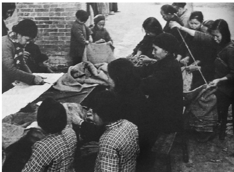
广东省的妇女在为游击战士缝制衣服。