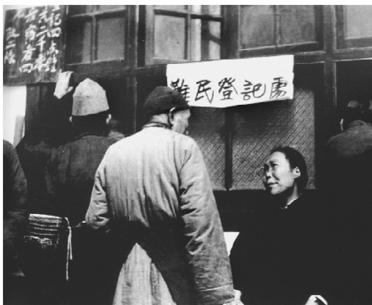
1940年后方的难民接待处。