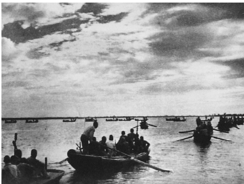
河北省白洋淀上的抗日武装“雁翎队”。