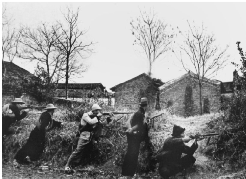
活跃在南方的游击战士。