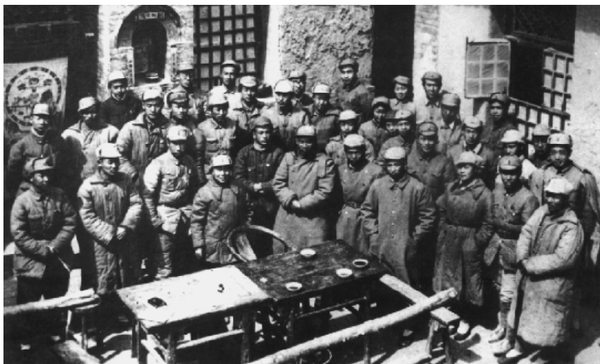
1940年春节，朱德(前排正中)和文化界著名人士参加了在八路军总部召开的文化教育座谈会。