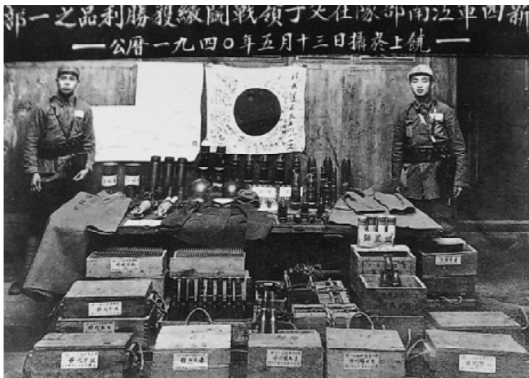
1940年4月下旬，新四军在皖南父子岭击败日军，缴获许多战利品。