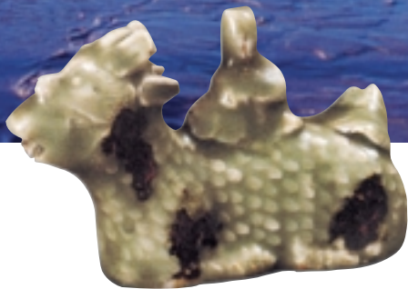
龙泉窑青釉褐彩骑兽水注 元 🐉

披于前后， 他将如何痛苦啊！” 哭声震动了河水，摇撼了树林。答里台 斡赤斤在旁劝说她： “你的亲爱的丈夫， 已经越过了千山； 你的心爱的丈夫， 已经渡过了万水。 你纵然痛哭， 他也无法回顾你一下， 你即使想去寻觅， 但是找不着道路了。”