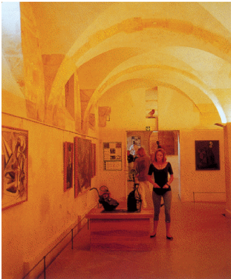
毕加索美术馆内景。

3岁的毕加索已经开始对怀孕的母亲有了好奇，这一年的12月，圣诞节刚过，就在母亲即将分娩的时候，一场剧烈的地震发生了，整个马拉加陷入了恐怖与混乱之中。强烈的地震将何塞家的房屋震荡得摇摇欲坠，何塞不得已求助于远在罗马访问的德格兰，请求德格兰将他在马拉加的公寓借给自己。在由石头搭砌的结实安全的公寓里，一个女孩儿不合时宜地来到了世界。婴儿的呱呱坠地让小毕加索感到震撼：她是伴随