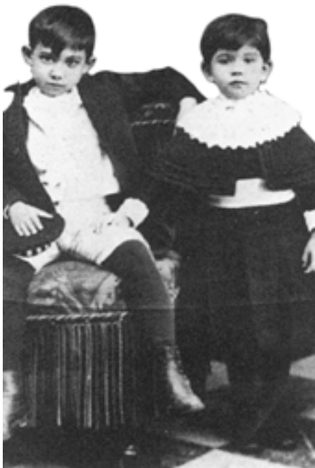
▲ 7岁的毕加索与妹妹罗拉在一起。

毕加索的父亲何塞的梦想是成为一名伟大的画家，然而天赋的有限让他无法在绘画领域赢得更多的赞赏与认可，这一点，何塞是有自知之明的。但这并不影响何塞对绘画的热爱和与绘画界名人的交往。马拉加一直以来被认为是西班牙除首都马德里和巴塞罗那以外最重要的美术中心，何塞凭借自身的努力经营在几年中成为马拉加市市立博物馆的馆长。这是一个不小的成功，使得何塞有了更多与优秀画家结识的机会，安东尼奥·蒙诺斯·德格兰就是其中的一位。德格兰是当时西班牙最著名的画家，他对描绘宏大的历史场景有特殊的把握能力，也因此开创了属于自己的全新流派，在西班牙现代绘画史上占有重要地位。德格兰与何塞有着深厚的友谊，同时他又是何塞绘画上的导师。在他们的密切往来中，或许会给毕加索小小的心灵带来某种潜移默化的影响。