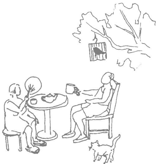
消暑品茶（李海川绘）