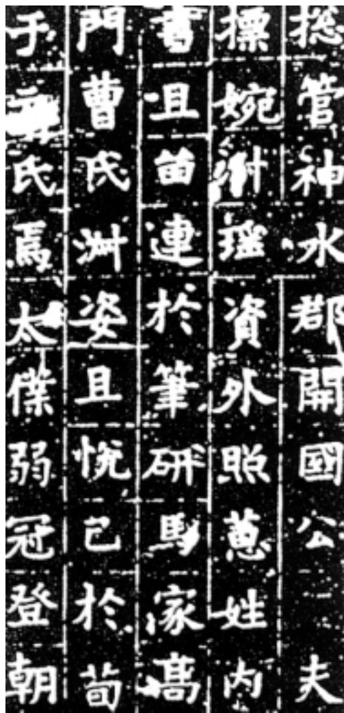
元公夫人姬氏墓志 隋

此志刻于隋大业十一年（公元615年），清嘉庆二十年出土于陕西咸宁，楷书二十七行，行二十七字。书法道丽，上聚北朝之劲拔，下开李唐之秀整，有人以为是欧阳询年青时所作，布白精密、秀雅似高士头着纶巾，飘然端坐。