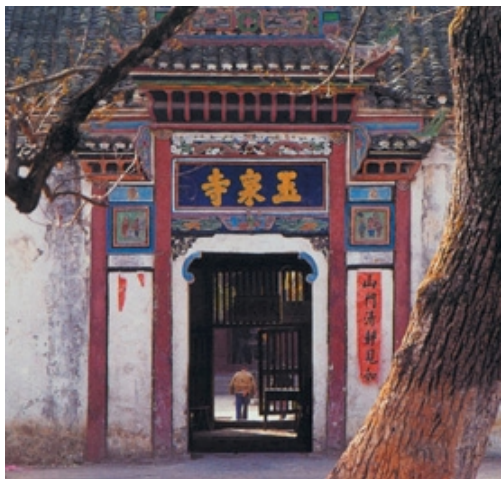
湖北当阳玉泉寺 隋

当阳玉泉山峰峦叠嶂，名花异草，古木葱葱郁郁，清泉深谷，超尘脱俗。正所谓深山藏古寺，玉泉寺即在此山中。图中为玉泉寺的山门。山门，即三门，一般皆三门并立。正中为空解脱门，东侧为无相解脱门，西侧为无作解脱门，象征“三解脱门”。有些寺院虽然只有一门，也仍然称为“三门”或“山门”。