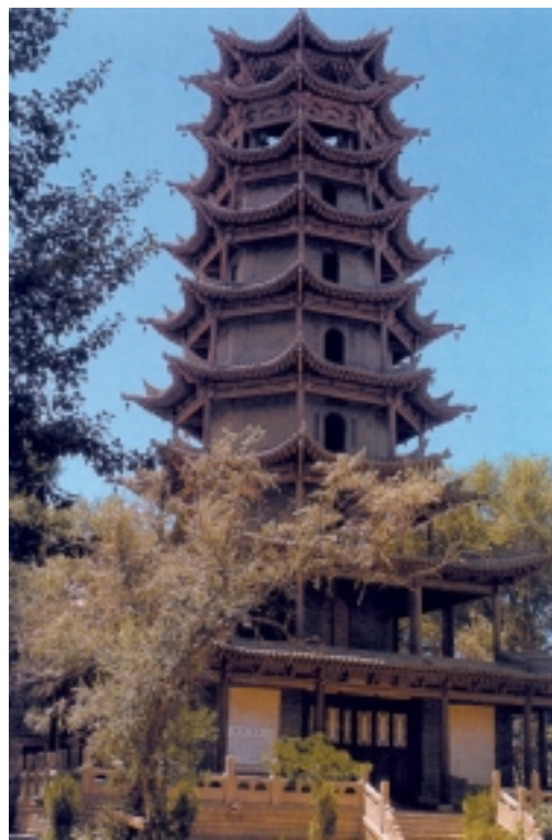
张掖木塔寺木塔 隋

名声了。他向南平定了吴郡和会稽郡(指消灭陈国)，向北击退了匈奴(此指突厥人)，在众兄弟中，他的名声和业绩特别突出。从这时起，他就将真实情况掩饰起来，伪装面貌，努力实行其邪恶计划，所以得到了独孤皇后的宠爱，文帝想法也发生了改变。祸乱开始从天而降，他成了皇太子，接着坐上了皇帝的宝座，继承了宏大、显赫又美好的天命。当时，隋朝的领土比三代时还要宽广，国威传播到了极其遥远的地方，突厥的可汗入朝要行跪拜礼，越裳几次前来通好。赤仄一类的钱币在京都内流通，腐烂变红的粟米堆积在塞下的仓库里。隋炀帝