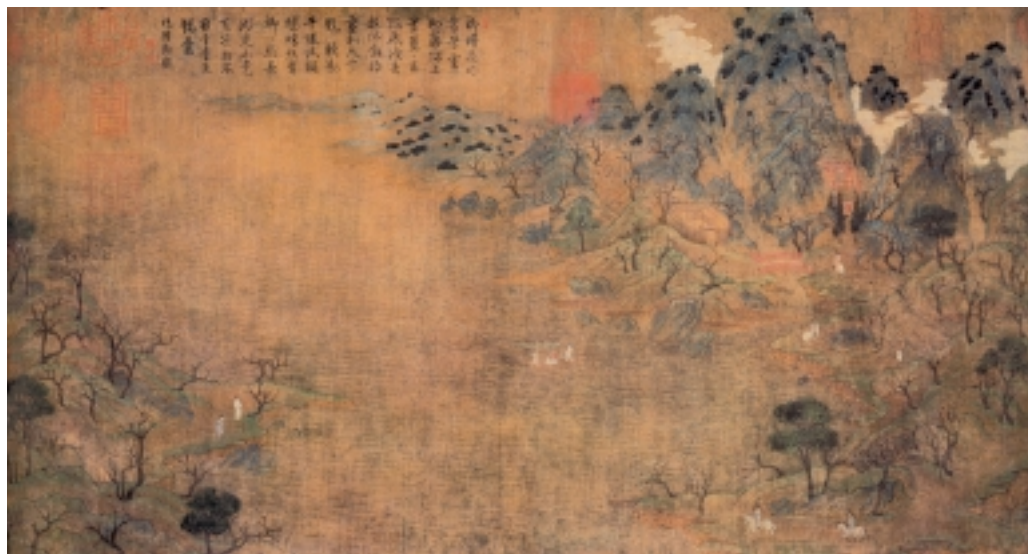
游春图卷 隋 展子虔

初四,赤土国派遣使臣前来朝贡土产。十一日,炀帝抵达京师。十九日,在武德殿宴请四百位老人,并分别赐给他们多少不等的财物。二十二日,炀帝亲临崇德殿的西院,满脸的忧伤,不怎么喜悦,回头告诉侍从:“这本