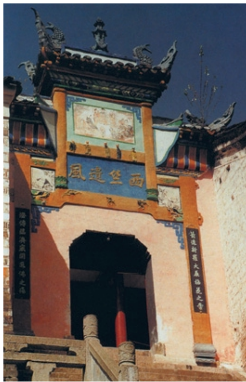
湖北当阳玉泉寺毗卢殿

当阳玉泉寺毗卢殿门楹上书“箭透新罗大展拈花之案；灯传临济宏开选佛之场”对联，由此可知玉泉寺不仅是天台宗和禅宗北宗道场，也是南禅临济宗的道场。