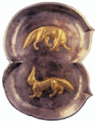
鎏金双狐双桃银盘 唐 这件出土于扬州的银盘，造型为双桃型，以写实手法表现一对相望的狐，这在中国传统图案中从未见过，属于东罗马的风格，是珍贵的舶来品。