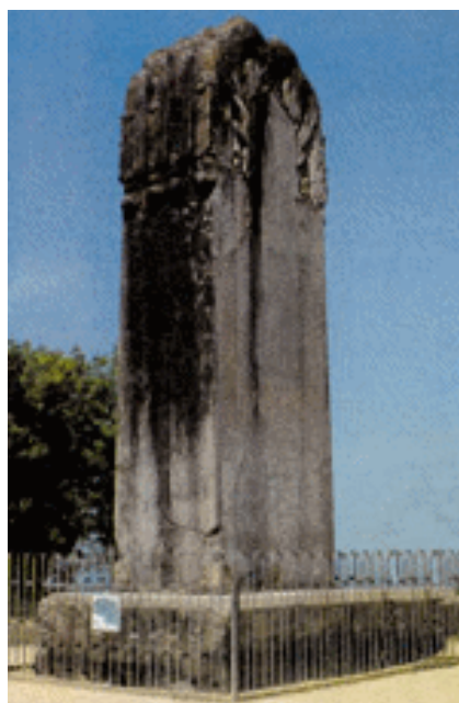
乾陵武则天无字碑 唐