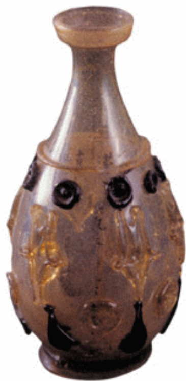
贴花盘口琉璃瓶 唐