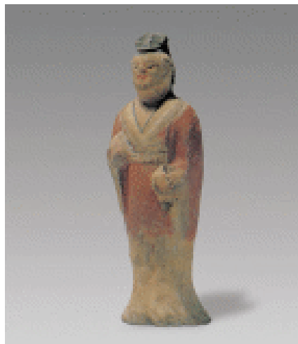
陶塑彩绘听乐俑 南北朝 这组俑表面施以红、淡青、粉红、黑等色彩。人物着博衣宽袖，面含微笑，拱手而立，正在全神贯注聆听乐队演奏，神情极为专注。