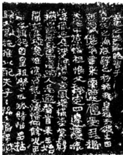
嘎仙洞刻石拓片 南北朝 这是鲜卑贵族立国后在嘎仙洞祭祀祖先的碑文,对研究鲜卑文化有重大的意义。

登国元年(公元386年)春,正月初六,道武帝即代王位,郊祀上天,定年号为“登国”,在牛川大会各部落的首领。道武帝命长孙嵩再次担任南部大人,叔孙普洛为北部大人。同月,慕容垂在中山称帝,国号为“燕”。二月,道武帝的车驾