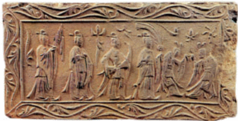
邓县乐舞画像砖 南北朝

虎子为古代溺器，一般都作伏虎状，常见于江南地区墓葬中，北方较少见，且多是瓷器。此器则为铜铸，造型虽四足伏地，而形态威猛，周身除铸出的花纹外，在颈、背、胸、尾又用细线刻画毛、鬃，于雄浑中表现细微，为难得的佳作。