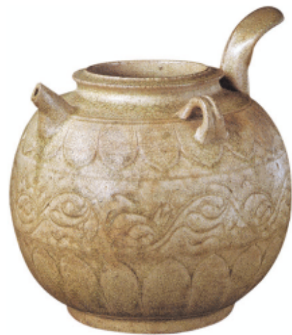
青瓷刻花草柄壶 南北朝

秋，七月初二，道武帝在中川讲习武艺。慕容垂扣留了秦王拓跋觚，要求道武帝以名马相送，为道武帝所拒绝。魏国于是派出使者去见慕容永，而慕容永则派来大鸿胪慕容钧，并送表劝道武帝即皇帝位。九月，道武帝进攻五原，实行屠城