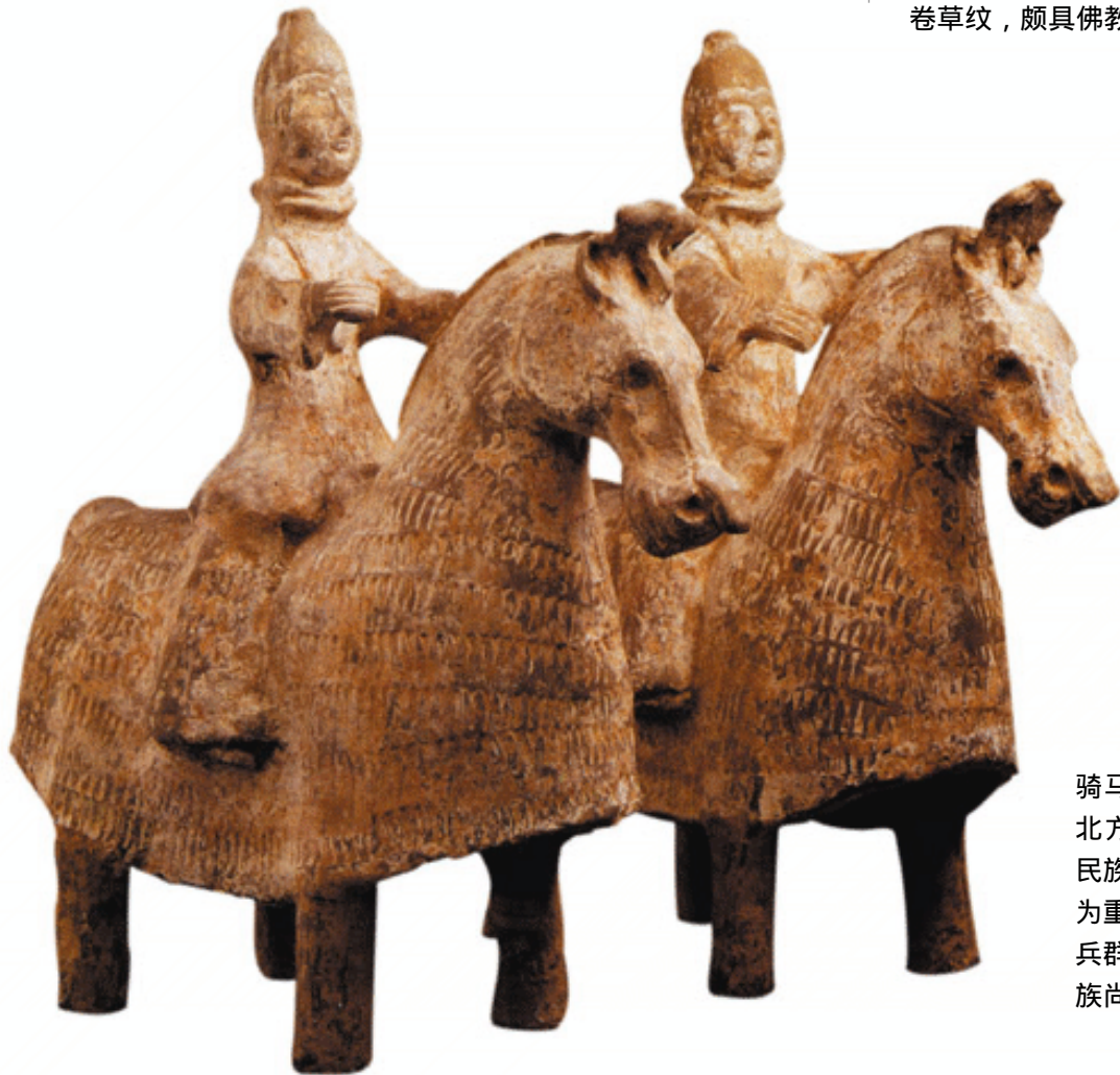
骑马武士俑 南北朝

北方鲜卑人原为游牧民族，对骑兵的建制极为重视。这些陪葬的骑兵群俑，反映了北魏贵族尚武的风气。