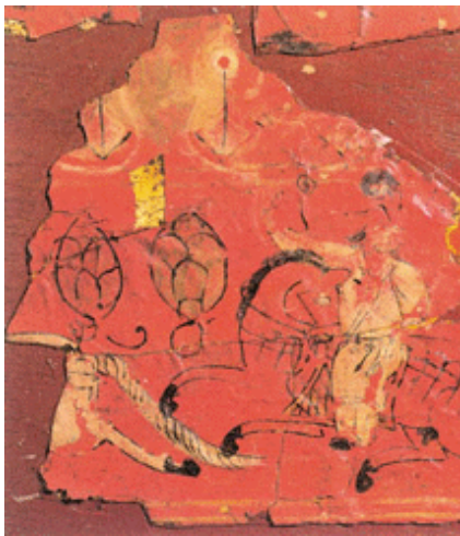
鲜卑族漆绘木棺 南北朝

南北朝时期，民间美术活动十分兴盛，技巧日益提高。绘画艺术依靠民间活动和专业创作相互促进而不断发展。这些漆绘屏风就是当时民间美术的代表作。描绘精致灵活，人物栩栩如生。