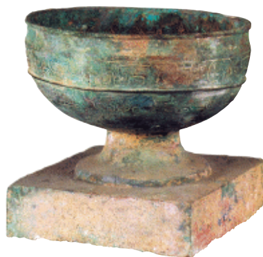
夔凤纹方座豆 战国