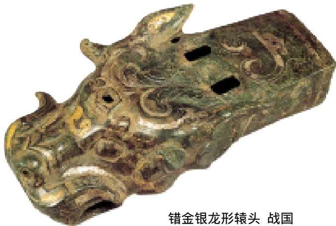
错金银龙形辕头 战国