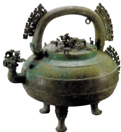
几何纹龙兽尊 战国

秦王坐在章台上接见蔺相如，蔺相如捧着璧献给秦王。秦王十分高兴，把璧递给身边的美人和侍从观赏，左右侍从都高呼万岁。蔺相如看出秦王没有诚意把城池给赵国，就走上前说：“璧上有瑕疵，请让我指给大王看。”秦王把璧交给他，蔺相如便拿着璧，后退几步站定，靠着殿柱，怒发冲冠地对秦王说：“大王想得到这块璧，派人送信给赵王。赵王召集全体大臣商议，都说秦国贪婪，依仗自己强大，想用空话骗取璧，答应给我们的城池恐怕不能得到。大家商议不打算把璧给秦国。我认为，平民百姓之间交往，还不肯相互欺骗，何况大国呢！况且，如果因为一块璧的缘故，惹得强大的秦国不高兴，这不合适。于是赵王就斋戒了五天，派我捧着璧，他在朝堂上拜呈国书。为什么这样做呢？是为了尊重大国的威望，表示敬意。今天我来到贵国，大王只在一般的宫殿里接见我，而且态度非常倨傲；拿到了璧，又传递给美人，来戏弄我。我看大王没有诚意把城池给赵王，所以我又收回了璧。大王一定要逼迫我，我的头今天就跟璧一起撞碎在柱上！”蔺相如握着璧，斜视殿柱，想用它撞击殿柱。秦王怕他撞破璧，就连忙道歉，再三请求不要撞碎璧，并召来管图籍的官员察看地图，指着从这里起到那里止的十五座城池划给赵国。蔺相如估计秦王只不过是假装要给赵国城池，实际上不可能得到，就对秦王说：“和氏璧，是天下共传的宝玉。赵王害怕，不敢不奉献。赵王送璧的时候，曾经斋戒五天，现在大王也应该斋戒五天，在朝堂上设九宾大典，我才会献上璧。”秦王估量这件事，终究不能强夺，就答应斋戒五天，并安置蔺相如住在广成宾馆。蔺相如估计秦王虽然答应斋戒，但一定会违背诺言，不肯给城池，便让他的随从穿着粗布衣，怀揣着