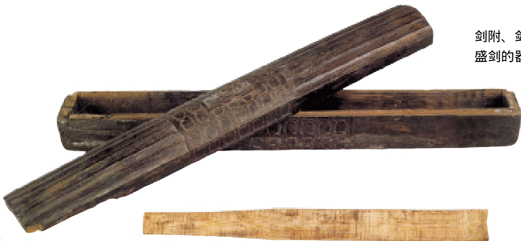
剑附、剑鞘、剑盒 战国 盛剑的器物