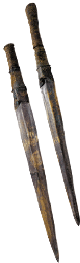
虎斑纹木柄剑 战国

太史公说：“我曾经路过薛邑，那里的乡间有很多桀骜不驯的少年，与邹国、鲁国不同。我问是什么缘故，回答说，孟尝君招致天下以行侠为己任的人以及奸诈的人六万多家居住在薛邑。世上传说孟尝君好客并以此为乐，确实不是虚名呀！”