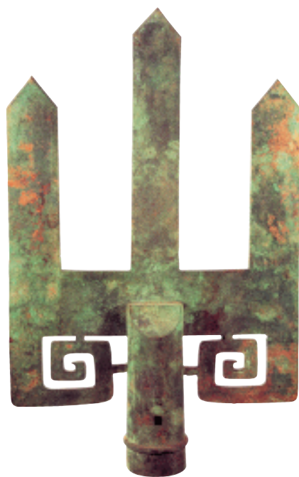
山字形器 战国 中山国特有的仪仗礼器，象征 国王的权威。

家就能得到天下。”秦王长跪着问他：“怎样才能使秦国不做雌的那个国家呢？”冯驩说：“大王您也知道齐国已经罢免孟尝君了吗？”秦王说：“听说了。”冯驩说：“使齐国威重天下的，是孟尝君。现在齐王罢免了他，他心里一定怨恨，因此一定会背叛齐国；一旦孟尝君背叛齐国，进入秦国，那么齐国的国情，人事关系的内幕，都带到了秦国，这样，秦国就可以占有齐国的土地，岂止是称雄呢？您赶快派使者装着钱币偷偷地去迎接孟尝君，不可失掉时机。假如齐国觉悟了，再次起用孟尝君，则齐、秦两国谁雌谁雄还不能预知。”秦王十分高兴，就派出十辆车带着百镒黄金去迎接孟尝君。冯驩辞出，先秦国使者而行，到了齐国，劝齐王说：“天下的游说之士驾车向东进入齐国，没有不想让齐国强大而让秦国削弱的；他们驾车向西去秦国，没有不想让秦国强大而让齐国削弱的。秦国和齐国，好比是雌雄两个国家，秦国强大则齐国削弱，两者势必不可能同时称雄。现在我私下里听说秦国派遣使者乘着十辆车、装着百镒黄金来迎接孟尝君。孟尝君不西入秦国则已，一旦他西入秦国担任秦相那么天下就归属秦国，秦国称雄而齐国为雌，齐国为雌那么齐国临淄、即墨就很危险了。大王为什么不在秦国使者未到之前，就恢复孟尝君的相位，增加他的封邑并向他致歉？孟尝君一定会高兴地接受。秦国虽然是强国，难道可以请走别国的宰相并派人前来