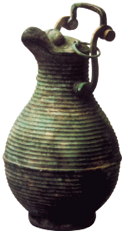
鹰首提梁壶 战国 此器为齐国铜器精品