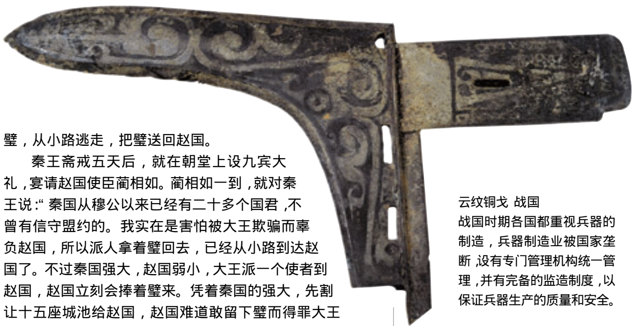
云纹铜戈 战国 战国时期各国都重视兵器的制造，兵器制造业被国家垄断，设有专门管理机构统一管理，并有完备的监造制度，以保证兵器生产的质量和安