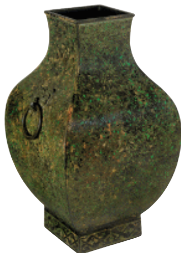
陈璋方壶 战国 该器是齐国伐燕的掠获品