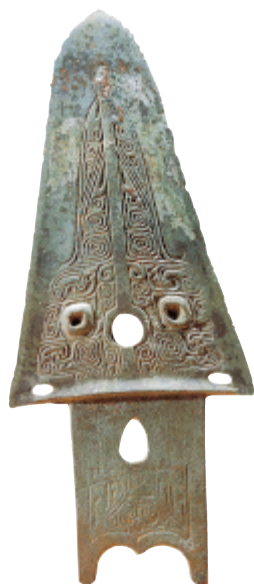
兽面纹三角形戈 战国

齐王由于受秦国、楚国散布的谣言的迷惑，认为孟尝君名声超过自己而且在齐国专权，于是就罢了孟尝君。宾客们看到孟尝君被罢免，就都离开了他。冯驩说：“借给我一辆车，让我可以进入秦国，一定会使您在国内受重视并且封邑更广，可以吗？”孟尝君于是准备了车子和钱币让冯驩去秦国。冯驩于是向西去对秦王说：“天下的游说之士驾车向西来到秦国，没有不想让秦国强大而让齐国削弱的；他们驾着车向东进入齐国，没有不想让齐国强大而削弱秦国的。所以齐秦好比是雌雄两个国家，其势不可能两个都是雄的，雄的国