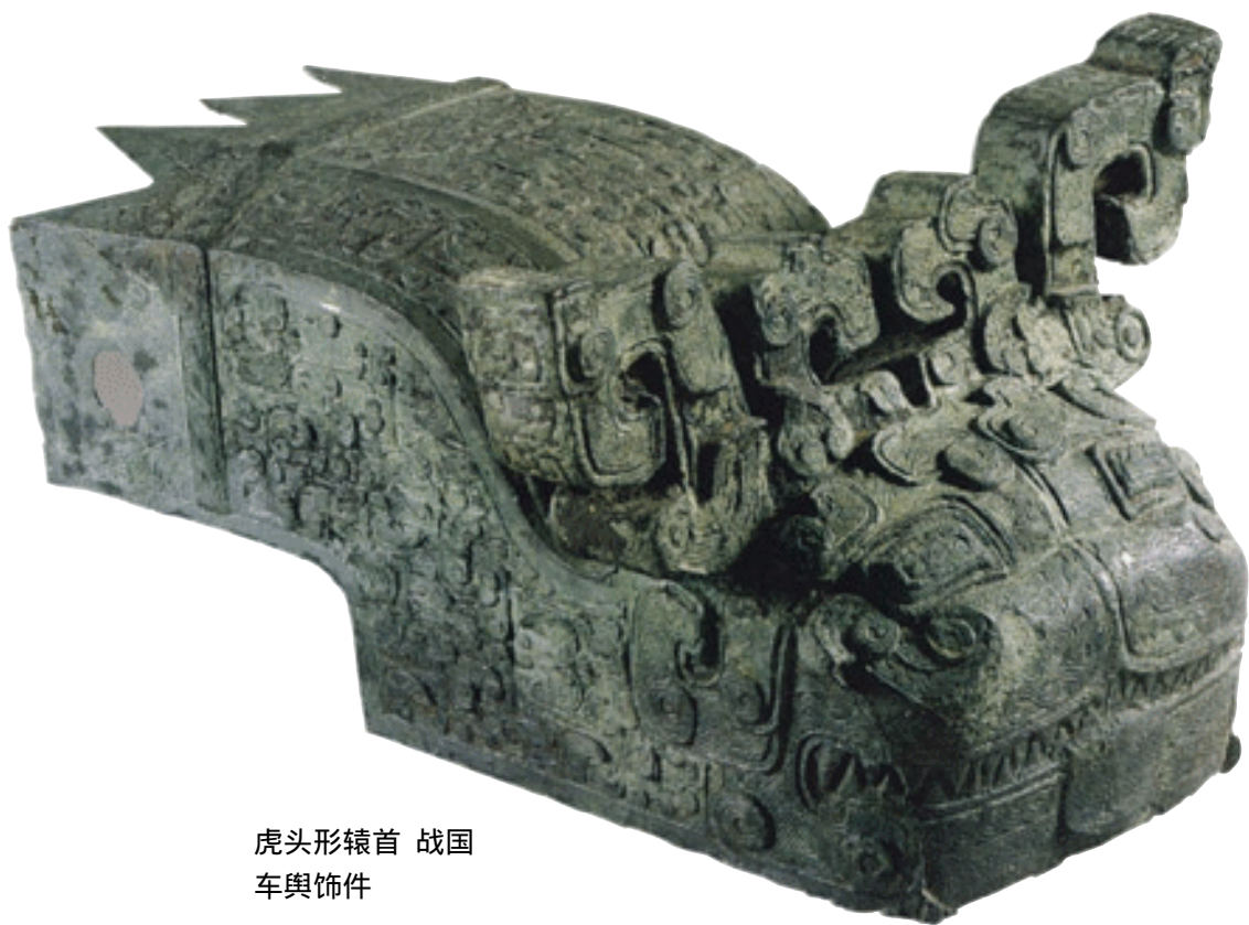
虎头形辕首 战国 车舆饰件

家就能得到天下。”秦王长跪着问他：“怎样才能使秦国不做雌的那个国家呢？”冯驩说：“大王您也知道齐国已经罢免孟尝君了吗？”秦王说：“听说了。”冯驩说：“使齐国威重天下的，是孟尝君。现在齐王罢免了他，他心里一定怨恨，因此一定会背叛齐国；一旦孟尝君背叛齐国，进入秦国，那么齐国的国情，人事关系的内幕，都带到了秦国，这样，秦国就可以占有齐国的土地，岂止是称雄呢？您赶快派使者装着钱币偷偷地去迎接孟尝君，不可失掉时机。假如齐国觉悟了，再次起用孟尝君，则齐、秦两国谁雌谁雄还不能预知。”秦王十分高兴，就派出十辆车带着百镒黄金去迎接孟尝君。冯驩辞出，先秦国使者而行，到了齐国，劝齐王说：“天下的游说之士驾车向东进入齐国，没有不想让齐国强大而让秦国削弱的；他们驾车向西去秦国，没有不想让秦国强大而让齐国削弱的。秦国和齐国，好比是雌雄两个国家，秦国强大则齐国削弱，两者势必不可能同时称雄。现在我私下里听说秦国派遣使者乘着十辆车、装着百镒黄金来迎接孟尝君。孟尝君不西入秦国则已，一旦他西入秦国担任秦相那么天下就归属秦国，秦国称雄而齐国为雌，齐国为雌那么齐国临淄、即墨就很危险了。大王为什么不在秦国使者未到之前，就恢复孟尝君的相位，增加他的封邑并向他致歉？孟尝君一定会高兴地接受。秦国虽然是强国，难道可以请走别国的宰相并派人前来