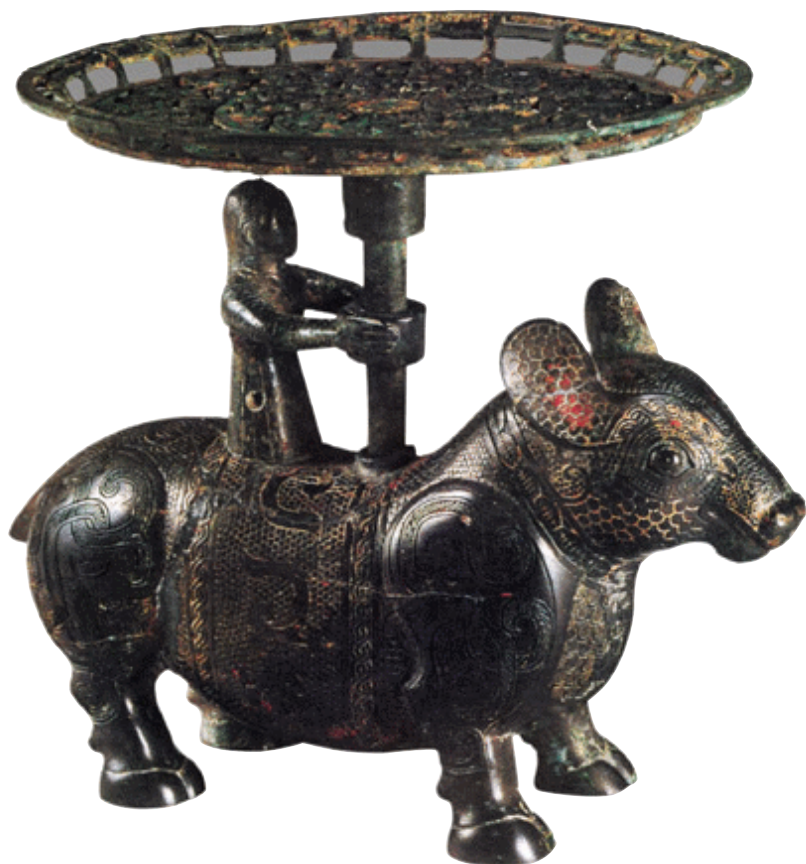
牺背立人擎盘 战国

战国时期，青铜器生活化的特征更加明显，其铸造和使用进一步普及，逐步走进人们的日常生活之中。