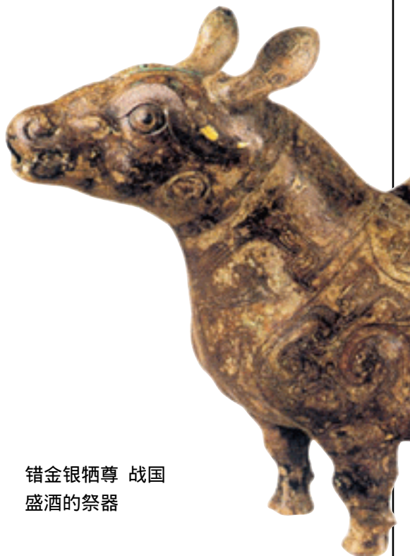
错金银牺尊 战国 盛酒的祭器