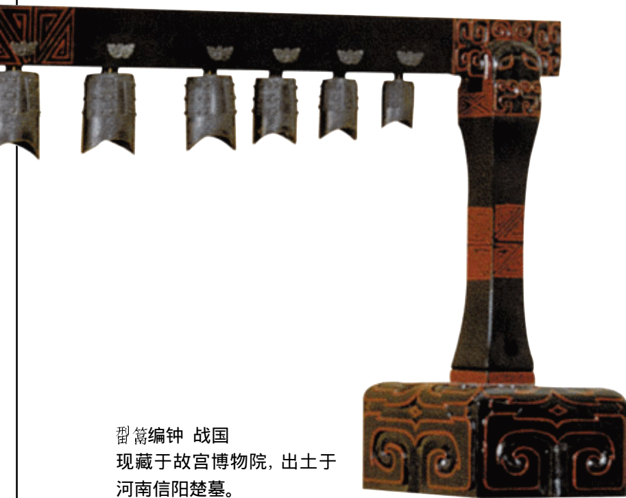
鬲簋编钟 战国 现藏于故宫博物院，出土于河南信阳楚墓。