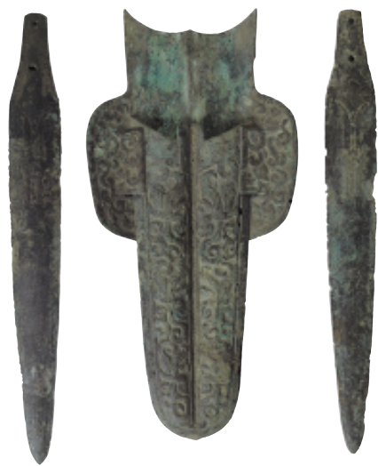
双鞘铜剑 战国 现藏于四川省博物馆

孟尝君经过赵国，赵国的平原君以礼待他。赵国人听说孟尝君贤能，出来看他，但都笑着说：“原来以为薛公一定长得高大，现在一看，却是一个矮小的男子。”孟尝君听到后，很愤怒。他的门客与他一起下车，斩杀了数百人，最终灭掉了一个县，这才离开。