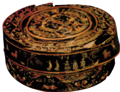
人物车马漆盒 战国

十万钱。于是他酿了许多米酒，买来肥牛，召集那些借钱的人，能偿付利息的都来，不能偿付利息的人也要来，都拿当初借钱的文书一一核对。大家一起