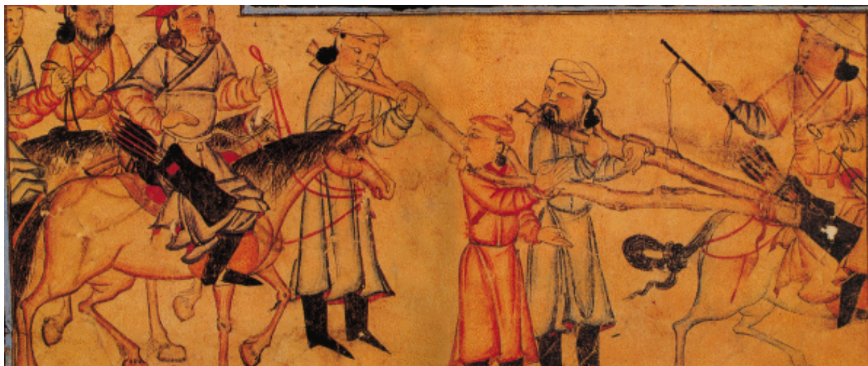
蒙古骑兵押送战俘图