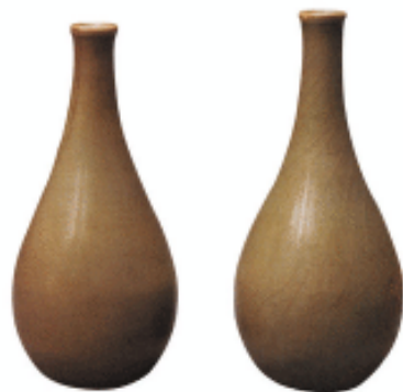
龙泉窑青釉小口瓶 元代