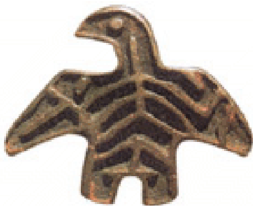
也里可温徽章 元代