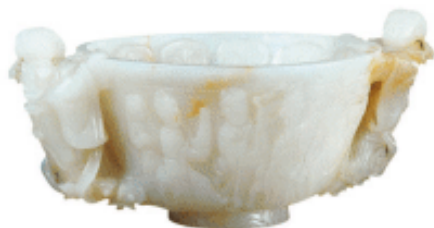
白玉双人耳礼乐杯 元代

此杯玉质细润，里外雕纹饰，里壁至底琢朵云，共四周三十二个。外壁两面饰阴纹锦地，各凸雕持乐器的女伎乐人五个。杯两侧各一脚踏朵云仙女耳，为元代器皿中之珍品。