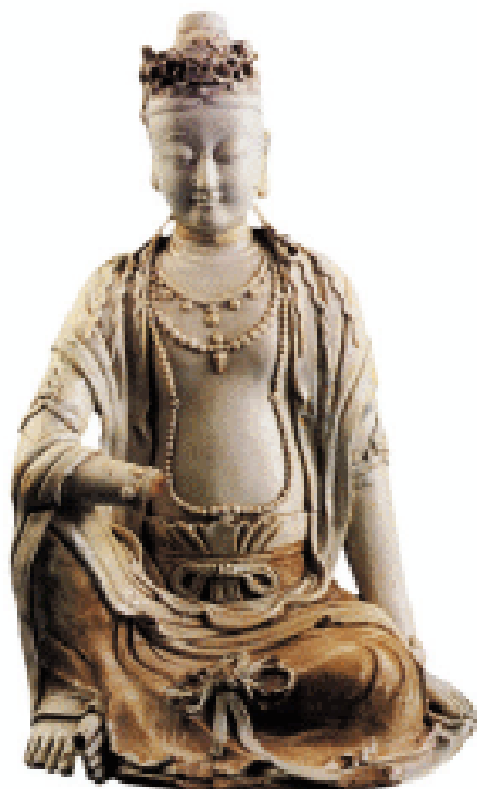
青白釉水月观音像 元代

十八年(公元1223年)，太祖在东山狩猎，马倒下，处机劝太祖说：“天之道，在于好生，陛下年数已高，还多次打猎，不是很适宜。”太祖为此很长时间没有打猎。当时蒙古军践踏蹂躏中原，河南、河北尤其严重，百姓遭受杀戮，没有地方