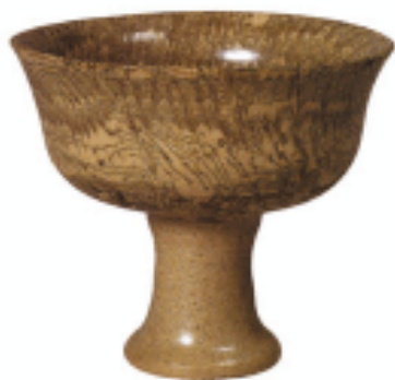
绞胎釉高足杯 元代

癸卯年（公元1243年）五月，有一颗荧惑星侵入房宿星座，耶律楚材上奏说：“应该会有一次惊忧的事情发生，但终究