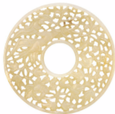
圆形镂空玉佩 元代