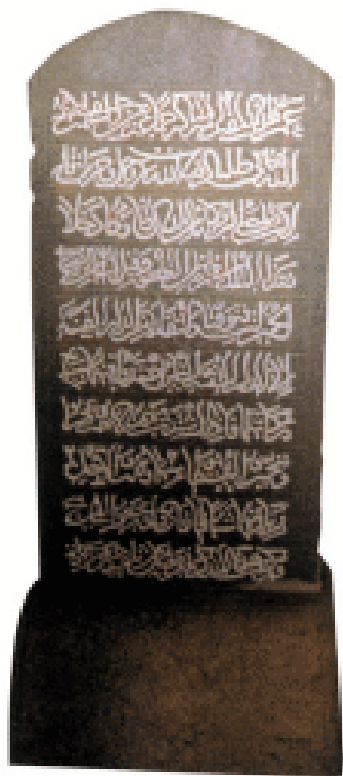
伊斯兰教墓碑 元代

中原刚刚安定，百姓多有触犯，可是国法中没有宽赦的法令。楚材奏请大赦，众人表示反对，楚材从容不迫地向皇帝进言。太宗诏令在二年(公元1230年)正月初一以前的犯罪者不要治罪。楚材还拟定十八条军政法规颁布天下，内容大概是：“各郡应该设置官吏来管理百姓，设立万户统率大军，使他们势均力敌，以防止万户骄蛮横行。中原这个地方是国家财政源泉，应该安抚、体恤百姓，州、县官吏不奉皇上的命令，擅自征发粮差的，要治罪。州、县官吏买卖或借贷宫物的，要将他治罪。蒙古、回鹘、河西各族人，凡是种地不纳税的，处死。监察官自己盗取宫物的，处死。应该判死罪的，必须申报朝廷，等到批准后再行刑。赠送礼物的，其祸