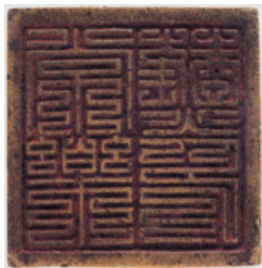
常乐驿站铜印 元代