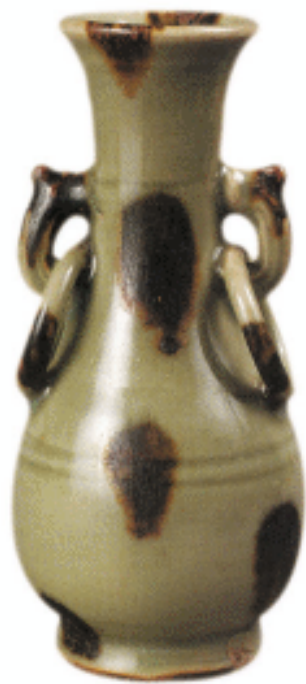
龙泉窑青釉褐斑环耳瓶 元代

太祖二十一年（公元1226年）冬天，蒙古军攻下灵武。各大将争着抢夺女子、金银、布帛，惟独楚材只收遗留下的书籍和大黄药材。不久士兵得了传染病，用大黄后就痊愈了。太祖从西征以来，没有时间制定军事制度，导致州郡官吏任意杀戮，以致到了抢人妻女、夺取财产、兼并土地的地步。燕蓟留守石抹咸得卜尤为贪心残暴，杀人无数。楚材听说后流下泪，立即入宫奏报太祖，请求禁止州郡官吏的行为，如果不奉太祖命令，不能随意征发百姓服役，囚犯应当处死的，必须上报批准。因为这些措施，贪暴的风气渐渐收敛。燕京一带盗贼很多，天还没有黑，就拉着牛车赶往富户人家，夺取他们的钱财，不给就将他们杀死。当时睿宗派皇子监察国务，