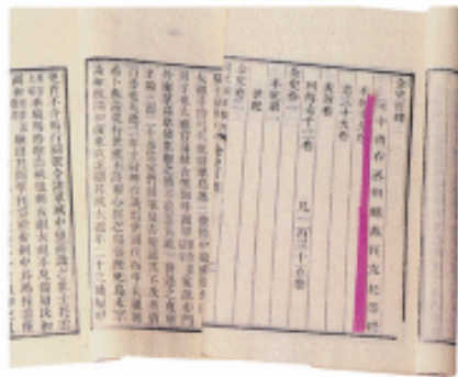
耶律楚材撰修的《金史》

富人刘忽笃马、涉猎发丁、刘廷重等人要求用白银一百四十万两来买断国家赋税的征收权。耶律楚材说：“这些贪图利益的人，瞒上欺下，危害很大。”于是，耶律楚材奏请取消这件事。他经常说：“办一件好事不如除掉一个祸害，多一事不如少一事。任尚认为班超的话稀松平常，千古以后，自然