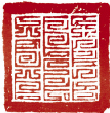
蒙古“左阿速亲军百户印印文”元代