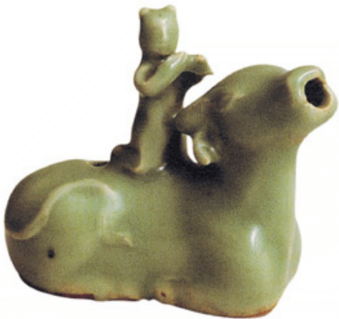
牧童牛形水滴 元代