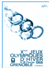
1968 年格勒诺布尔冬奥会宣传海报。

第 10 届冬奥会由法国格勒诺布尔市承办,这是一个历史可以追溯到古罗马时期的城市,市里充满了艺术人才。本届冬奥会的宣传海报,由法国著名艺术家让·布莱恩(Jean Brain)设计。它颠覆了顾拜旦创意的平稳状的奥运五环结构。整个画面看上去极具动感,设计思想为奥运五环就像是 5 名手拉着手的运动员,冒着冰雪在向前急速滑行。它不仅给予奥运五环以拟人化的生命,而且也突出了奥林匹克“更快、更高、更强”的精神。