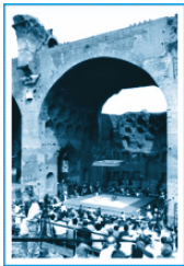
1960年罗马奥运会摔跤比赛场。

当然,很多古代体育场已经荒弃了很久,不能适应比赛要求。所以,罗马在新建体育设施的同时,对它们进行了修复和改建工作。这种大量融入历史元素的比赛场馆,受到了观众们的欢迎,人们仿佛又回到了古代罗马的历史盛世。为了保障奥运会的顺利进行,罗马还在比赛期间每天出动30万辆马车在街上运行,以提供人们参观比赛、旅游出行的需要。