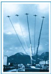
1968年格勒诺布尔冬奥会开幕式上的飞机表演。

看来,浪漫的法国人感觉通过其冬奥会宣传海报“浴雪同行”,还没有完全表现出其对奥林匹克运动的深厚感情。这种5架喷气式飞机的并肩快速飞行,更容易让人直接联想起奥林匹克运动“更快、更高、更强”的内涵了。