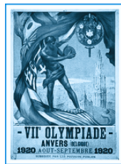
1920 年安特卫普奥运会宣传海报。

此宣传画的掷铁饼者 ,还被比利时政府制作成了邮票发行。邮票采用附捐式发行 ,分有齿、无齿两种 ;邮资中的附捐金额用于慰问第一次世界大战中的受难者家属。