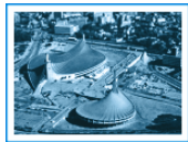
1964年东京奥运会代代木体育馆俯瞰。

个巨大的海螺。它是举行篮球和拳击比赛用的。大小体育馆还有设施连接起来,里面设有餐厅和休息观光平台。代代木体育馆由日本建筑大师丹下健三设计,它被当时的国际奥委会主席称为1964年东京奥运会建筑的“画龙点睛”之作。