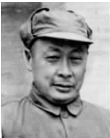
华东野战军司令员陈毅