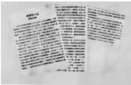
新华社祝贺蒙阴大捷的时评

缘月 员日夜，我第一、第八纵队，如同两把双刃尖刀，分别从敌整编第七十四师的两翼插入纵深，割裂了该师与其左右邻之整编第二十五、第