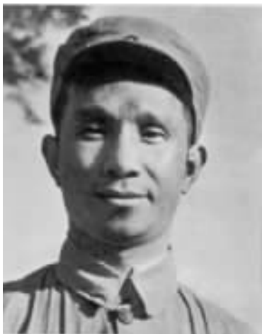
华东野战军副司令员粟裕

巍巍沂蒙山，连绵千余里。她是革命的山，是英雄的山。半个世纪前，发生在那里的孟良崮战役，在我军革命战争史上写下了光辉的一页。华东野战军在此全歼蒋家“王牌军”——整编第七十四师，孟良崮也因此而闻名于天下。