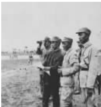
粟裕副司令亲临战场， 进行实地勘察

当时，敌十个整编师的增援兵力近者五六公里，远者亦仅员~ 圆日行程，情况十分紧急。这种情况下，能否消灭敌整编第七十四师，关键环节有两个，一是围歼部队能否迅速解决战斗，二是阻援力量能否挡住敌之援军。根据战场形势发展，陈毅同志提出了“歼灭七十四师，活捉张灵甫”的响亮口号。指战员们群情振奋，积极响应陈毅司令员的号召，并提出了“攻上孟良崮，活捉张灵甫”“消灭七十四师立大功，红旗插上最高峰”等口号；共产党员们还提出了“立大功，上高峰，共产党员带头冲”的口号，围住了蒋介石的“王牌军”。