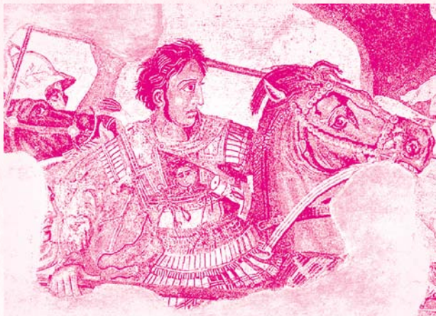
亚历山大骑马出战（油画）