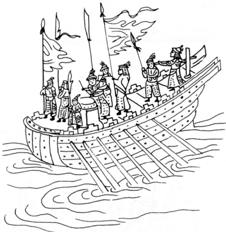
《武经总要》中的走舸

吴国舰队启航后,从东海向北航行,很快进入黄海,不几日就越过了临洪口,临近齐国近岸海域。