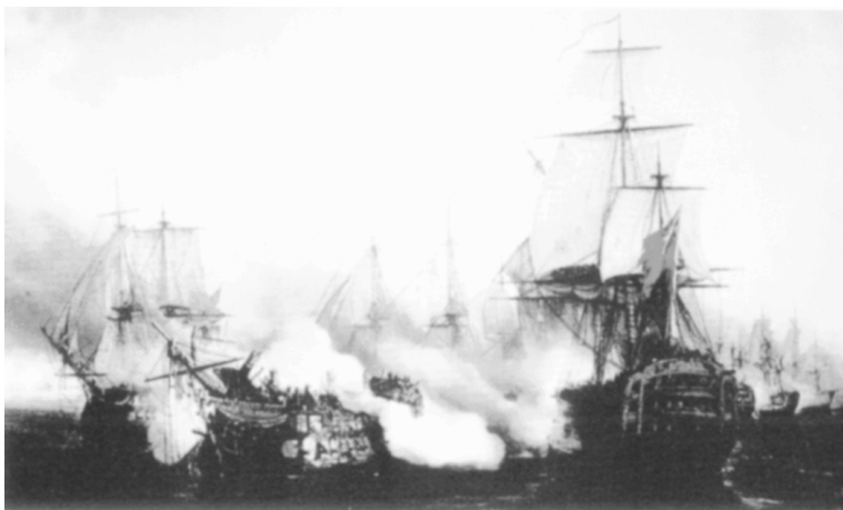
英国舰队与法国和西班牙联合舰队展开的特拉法加大海战

军接应。转眼到了3月底,30日这天大雾笼罩住整个锡诺普港。为了防止敌舰艇偷袭,奥斯曼命令各舰尽可能靠近海岸锚泊,以便能够得到海岸炮火的掩护;奥斯曼还把10艘巡航舰、4艘运输船和2艘武装蒸汽轮船进行了部署配置:将火力较强的巡航舰部署在外侧警戒,而将装载弹药、粮食的运输船只配置在内侧。中午时分,只见悬挂英国旗帜的6艘战列舰和2艘巡航舰张着满帆驶近港口,呈“八”字形抛锚于土舰外侧。突然间,这8艘舰上的巨大的炮口齐刷刷地转向土舰船;舰桅上的蓝色“米”字英国旗也换成了白“十”字俄国旗。土舰队官