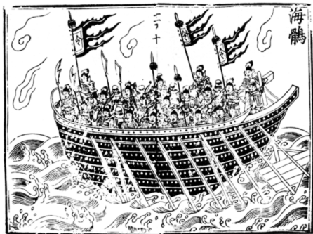
《武经总要》中的海鹞

移到了长江下游和钱塘江流域。上述地域江河交错，十分宜于水战。于是，各种专门用于水战的船舶——战船便相继出现。当时的吴国战船就分为余皇（指挥船）、三翼（战船）、突冒（冲撞船）、楼船（运兵船）和桥船（交通船）等型号。三翼又能细分为大翼、中翼和小翼三种。“大翼”战船长23米、宽3.5米，船上配有26名水手、50名桨手等共91人，这在当时世界上可以说是非常了不起的。大翼分设上下两层：上层是士兵作战的场所，下层为桨手和操船水手工作的场所。中翼长22米，宽3.1米；