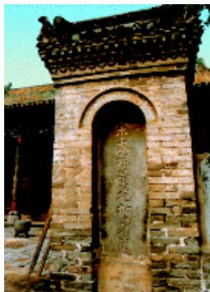
宋太祖皇袍加身处