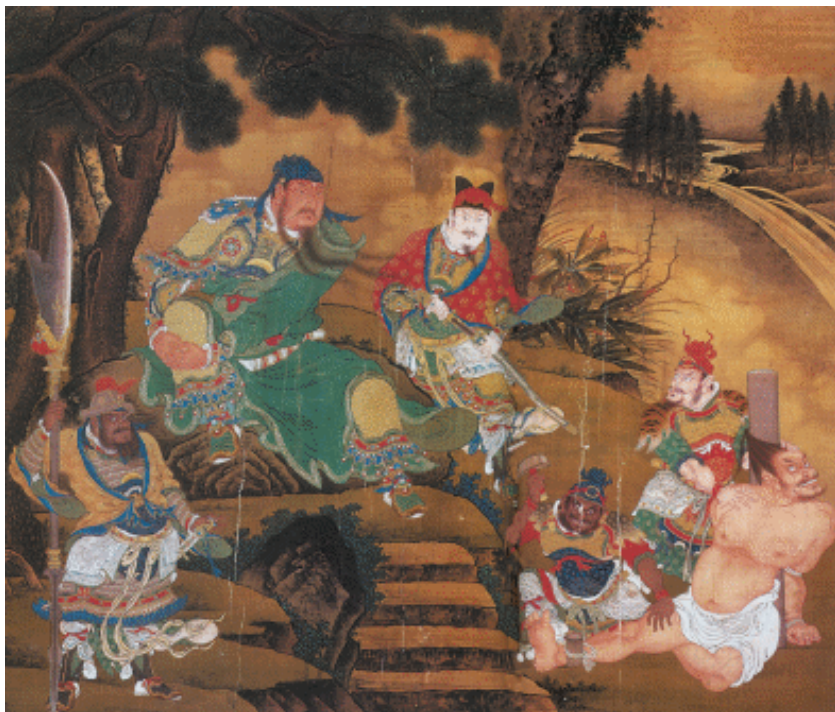
关羽擒将图 明 商喜

三国时期，荆州由于地理位置十分重要，成为兵家必争之地。公元217年，鲁肃病死，孙、刘联合抗曹的蜜月已经结束。当时关羽镇守荆州，孙权久存夺取荆州之心，只是时机尚未成熟。不久以后，关羽发兵进攻曹操控制的樊城，怕有后患，留下重兵驻守公安、南郡，保卫荆州。孙权手下大将吕蒙认为夺取荆州的时机已到，但因有病在身，就建议孙权派当时毫无名气的青年将领陆逊接替他的职位，驻守陆口。陆逊上任，并不显山露水，他定下了与关羽假和好、真备战的策略。他给关羽写去一信，信中极力夸耀关羽，称关羽功高威重，可与晋文公、韩信齐名。自称一介书生，年纪太轻，难担大任，要关羽多加指教。关羽为人，骄傲自负，目中无人，读罢陆逊的信，仰天大笑，说道：“无虑江东矣！”马上