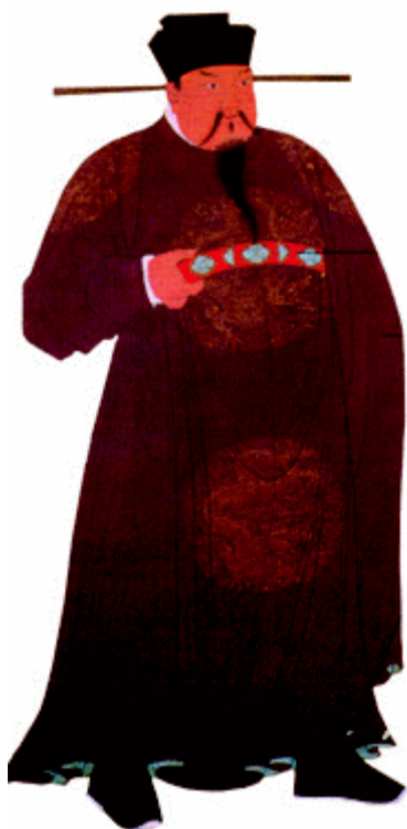
宋太祖赵匡胤立像

赵匡胤建立大宋后，唯恐江山被自己的功臣夺走，于是请故将石守信等人饮酒，酒过三巡，宋太祖说：“没有你们的力量，我不可能有今天，我将永远铭记你们的恩德。但是做天子也不容易，别人也想得到这个位置，我现在是夜不安枕啊。”群臣大惊，说：“如今天命已定，谁还会有异心？”宋