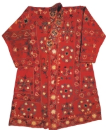
绣花红地草文罗衣 清