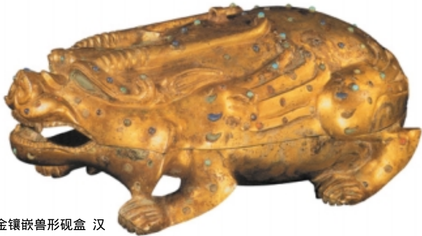
鎏金镶嵌兽形砚盒 汉