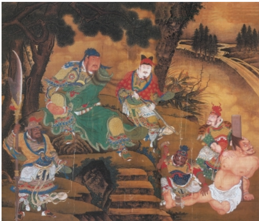
关羽擒将图 明 商喜

三国时期，荆州由于地理位置十分重要，成为兵家必争之地。公元217年，鲁肃病死，孙、刘联合抗曹的蜜月已经结束。当时关羽镇守荆州，孙权久存夺取荆州之心，只是时机尚未成熟。不久以后，关羽发兵进攻曹操控制的樊城，怕有后患，留下重兵驻守公安、南郡，保卫荆州。孙权手下大将吕蒙认为夺取荆州的时机已到，但因有病在身，就建议孙权派当时毫无名气的青年将领陆逊接替他的职位，驻守陆口。陆逊上任，并不显山露水，他定下了与关羽假和好、真备战的策略。他给关羽写去一信，信中极力夸耀关羽，称关羽功高威重，可与晋文公、韩信齐名。自称一介书生，年纪太轻，难担大任，要关羽多加指教。关羽为人，骄傲自负，目中无人，读罢陆逊的信，仰天大笑，说道：“无虑江东矣！”马上