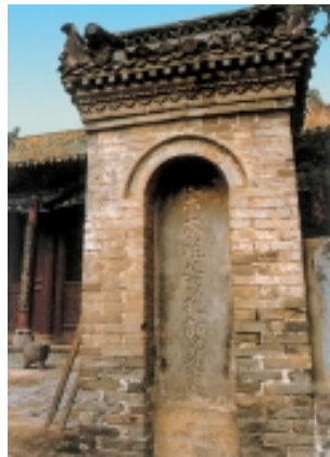
宋太祖皇袍加身处