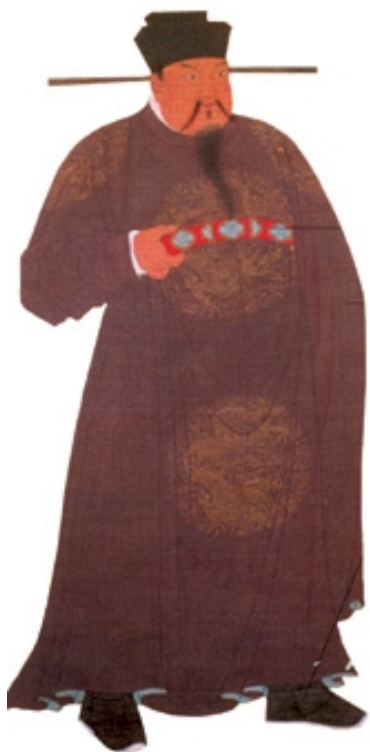
宋太祖赵匡胤立像

赵匡胤建立大宋后，唯恐江山被自己的功臣夺走，于是请故将石守信等人饮酒，酒过三巡，宋太祖说：“没有你们的力量，我不可能有今天，我将永远铭记你们的恩德。但是做天子也不容易，别人也想得到这个位置，我现在是夜不安枕啊。”群臣大惊，说：“如今天命已定，谁还会有异心？”宋