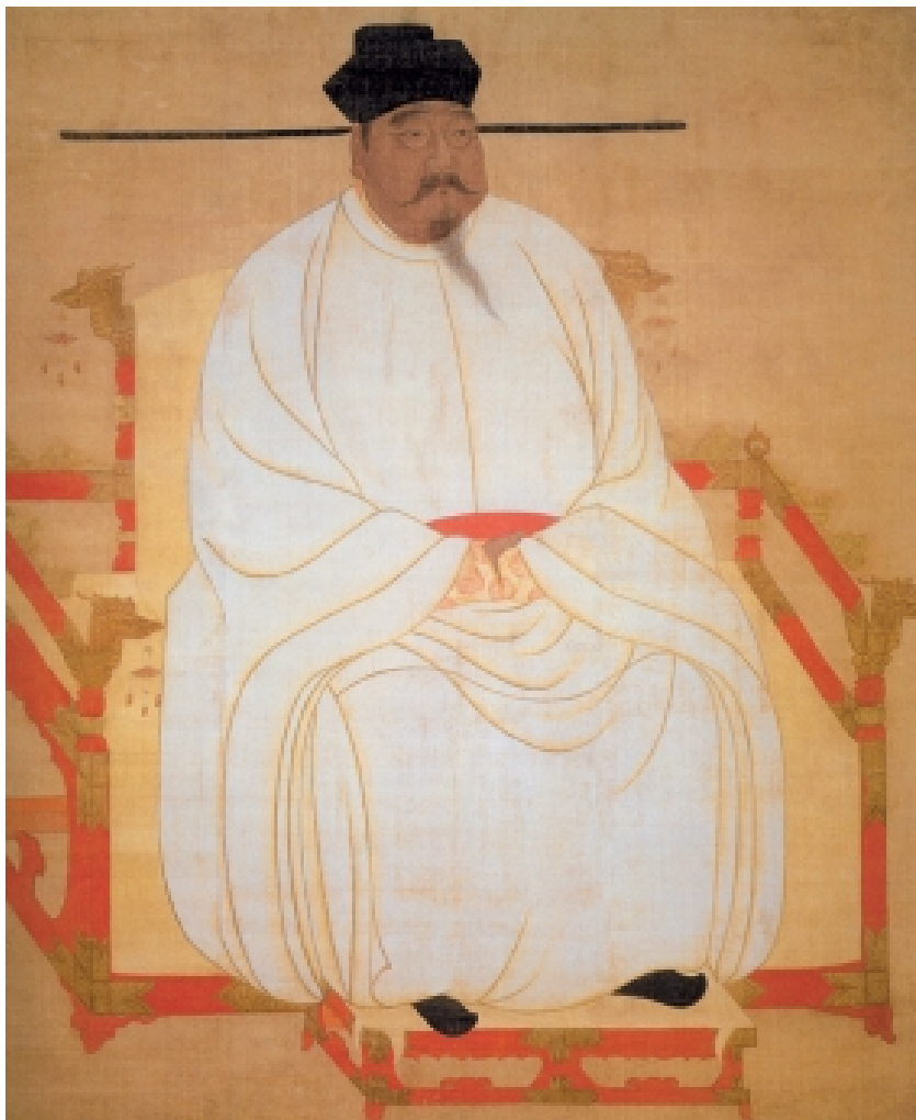
宋太祖赵匡胤坐像