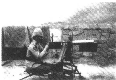
机枪是堑壕战的支撑性武器

攻势中突破了德军最后一道防线，德军完全败回了国内。联军随即向德国本土发动进攻，德国本土的预备军虽挡住了联军的攻势，但已无力再战。1918年10月，德国请求停战，11月德国本土爆发革命，皇帝威廉二世逃往荷兰，11月11日德国投降，第一次世界大战结束。