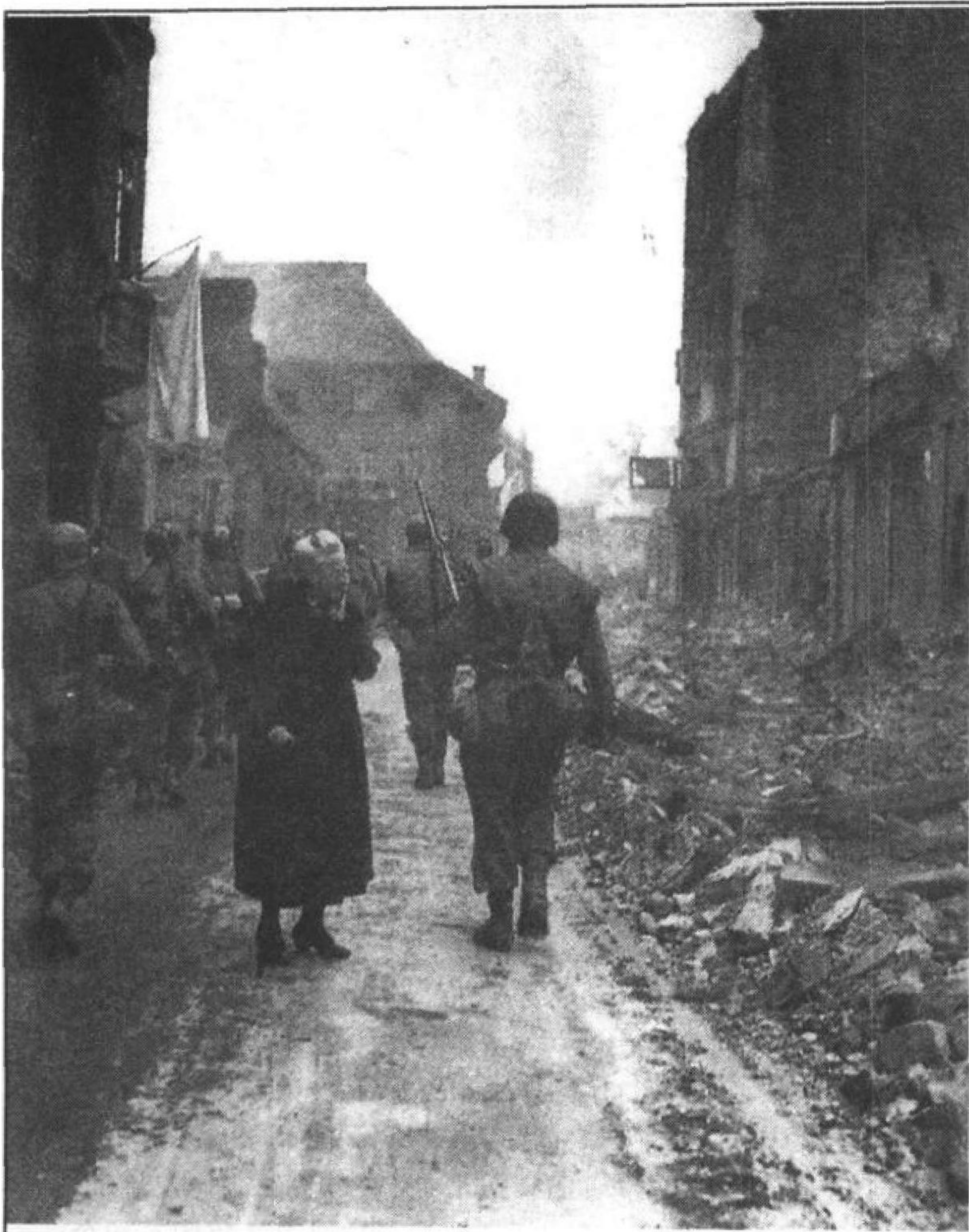
美180步兵团攻入德国本斯海姆

一位德国老妇人站在第7军的行进行列中间，绝望地端详着自己家园的废墟。她身后的另一幢楼上，挑出一幅表示投降的白布。静静前行的军队、降旗、被毁的家园、悲伤的老妇，形成了一幅“被占领”的典型画面，这一切似乎表明，希特勒强加给别国人民的一切，很快被无情地还给了德国。