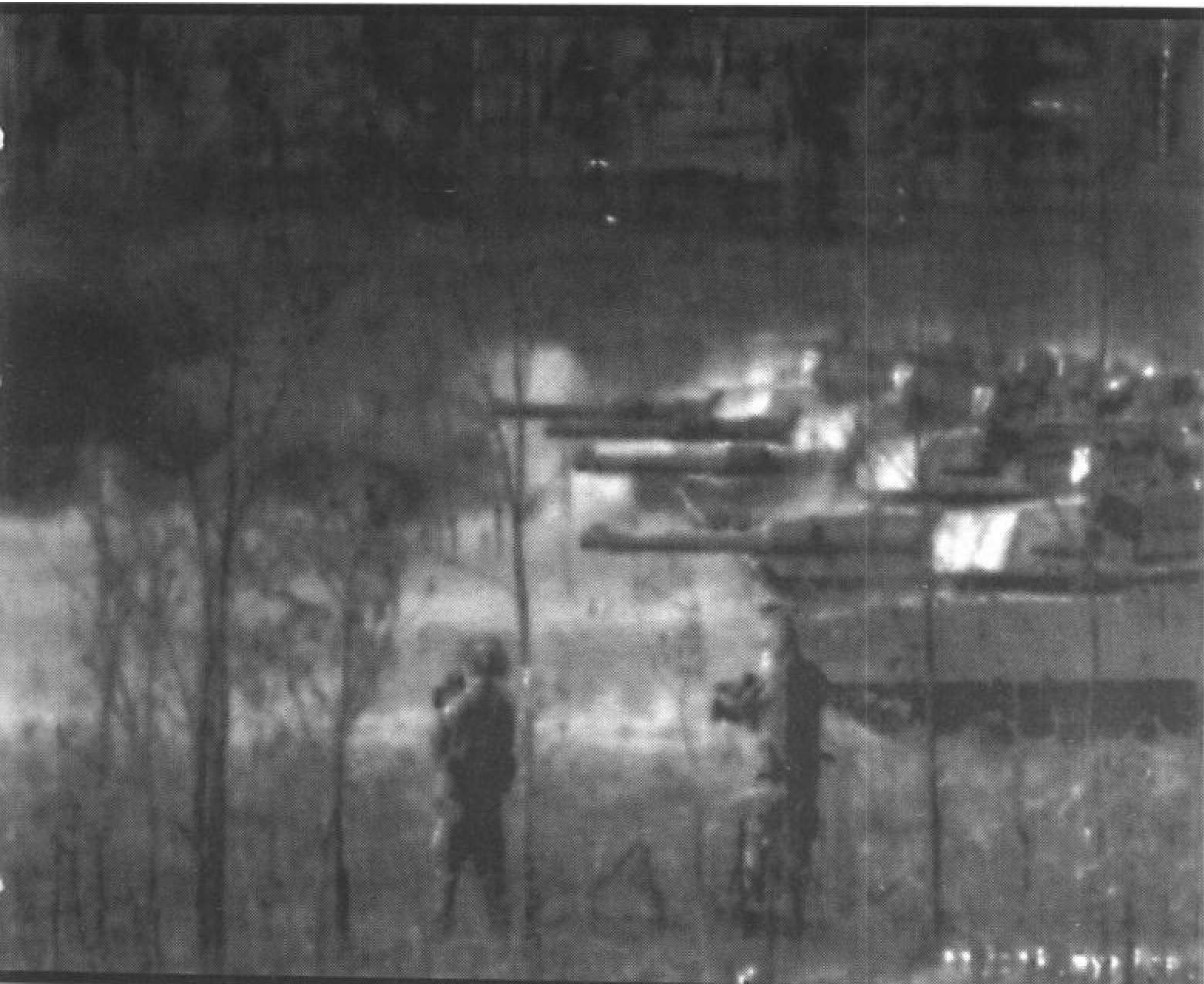
美军第7军在阿登山区陷入艰苦的丛林战