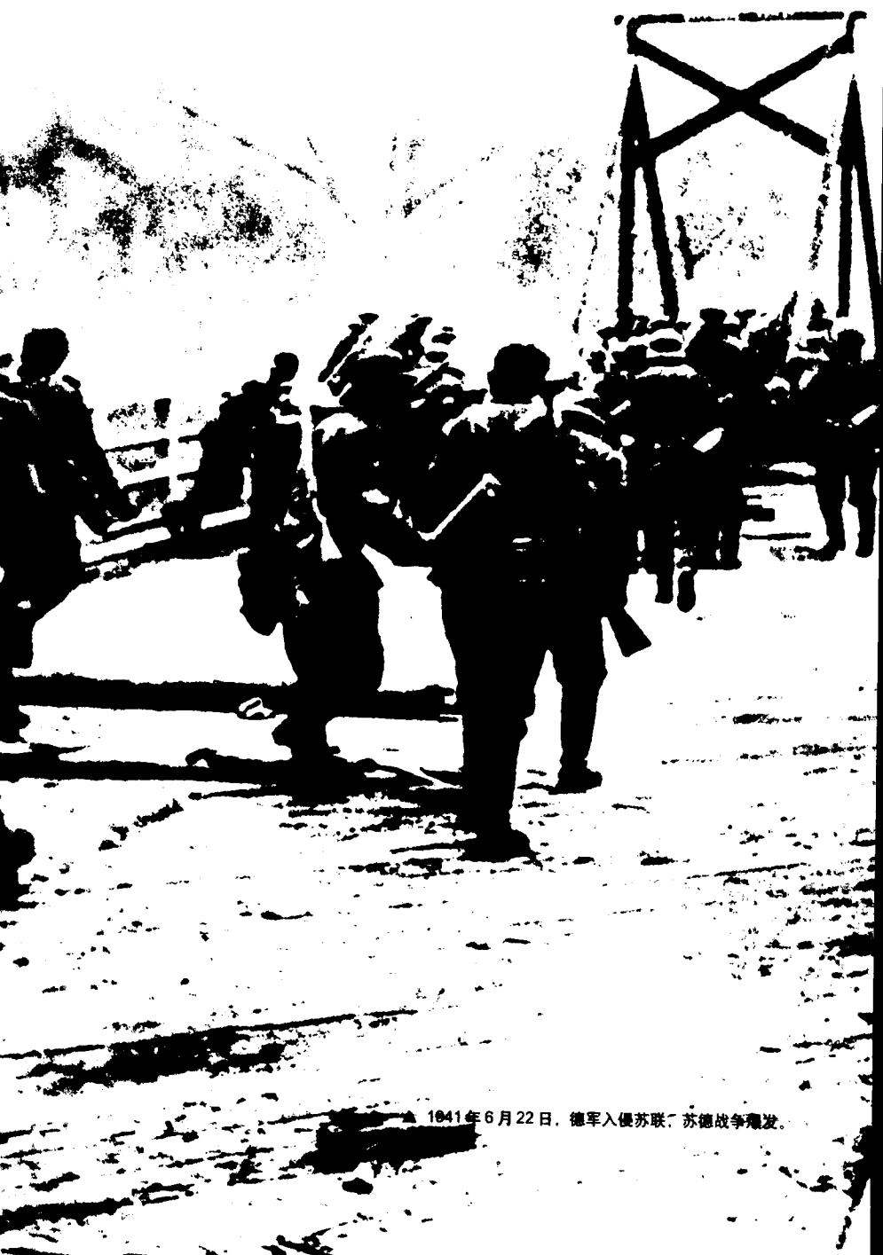
▲ 1941年6月22日，德军入侵苏联，苏德战争爆发。