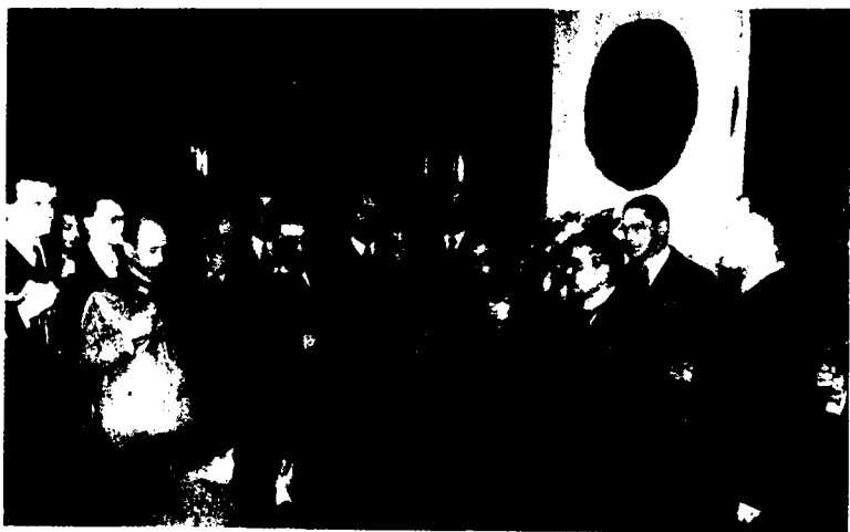
▲ 日本首相东条英机同出席签署轴心国协议的德国和意大利代表在一起。

来之前夺取西伯利亚。以近卫首相和包括陆海相在内的军部实力派，则主张利用苏德战争解除了日本北方受牵制之机，大举南进。在争论不休之下，从6月25日至7月1日，政府和大本营召开了6次联合会议，讨论海军和陆军制定的“南进”计划，松冈不顾众人的反对，大唱“北进”的调子，引起了激烈的争吵。经过激烈论争之后，7月2日，天皇主持召开御前会议，作最后的裁定。