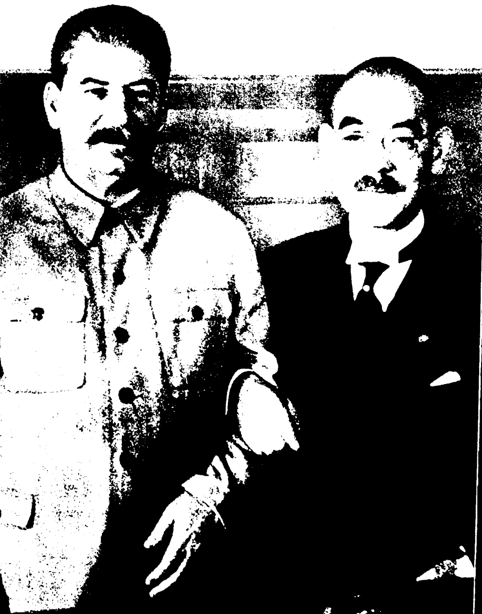
▲ 斯大林在克里姆林宫会见日本外相松冈洋右。