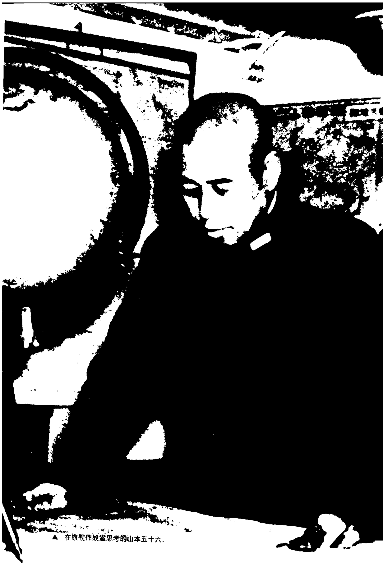
▲ 在旗舰作战室思考的山本五十六。