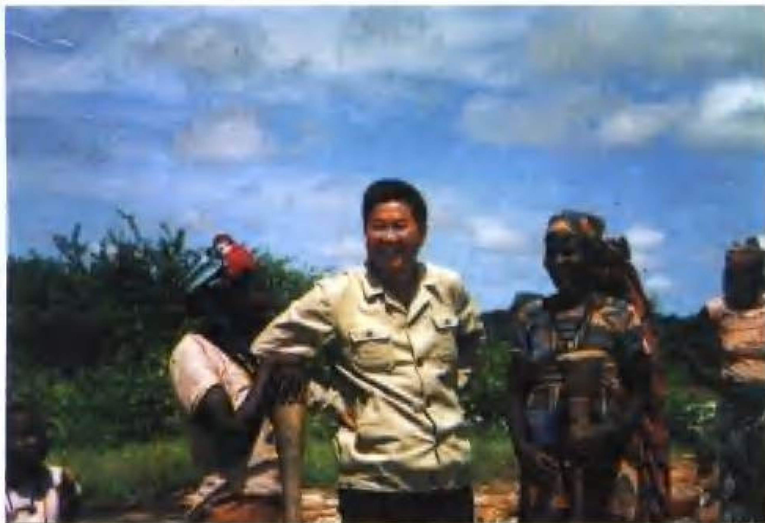
本书作者同几内亚山村妇女交谈