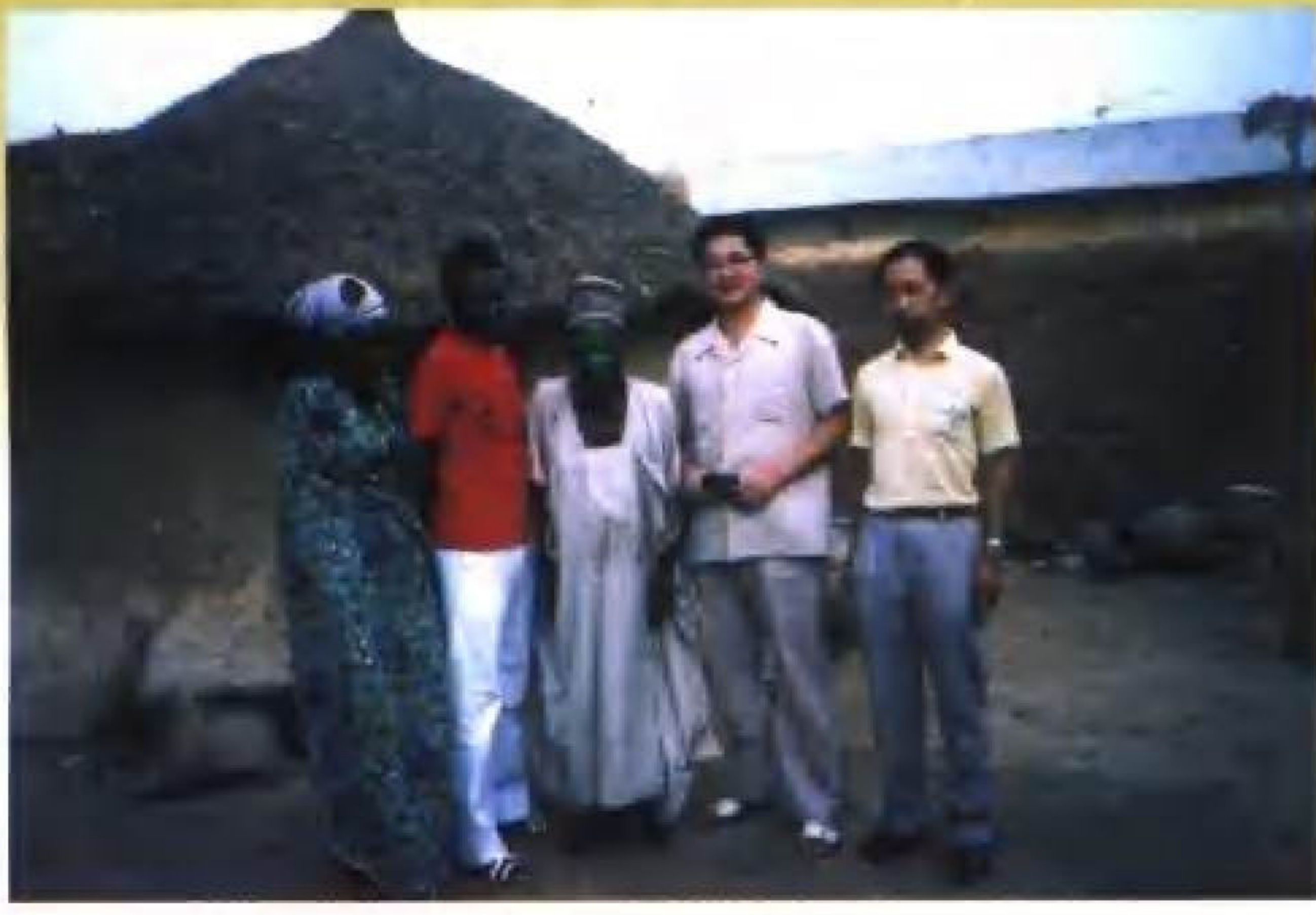
本书作者访问非洲百岁老人