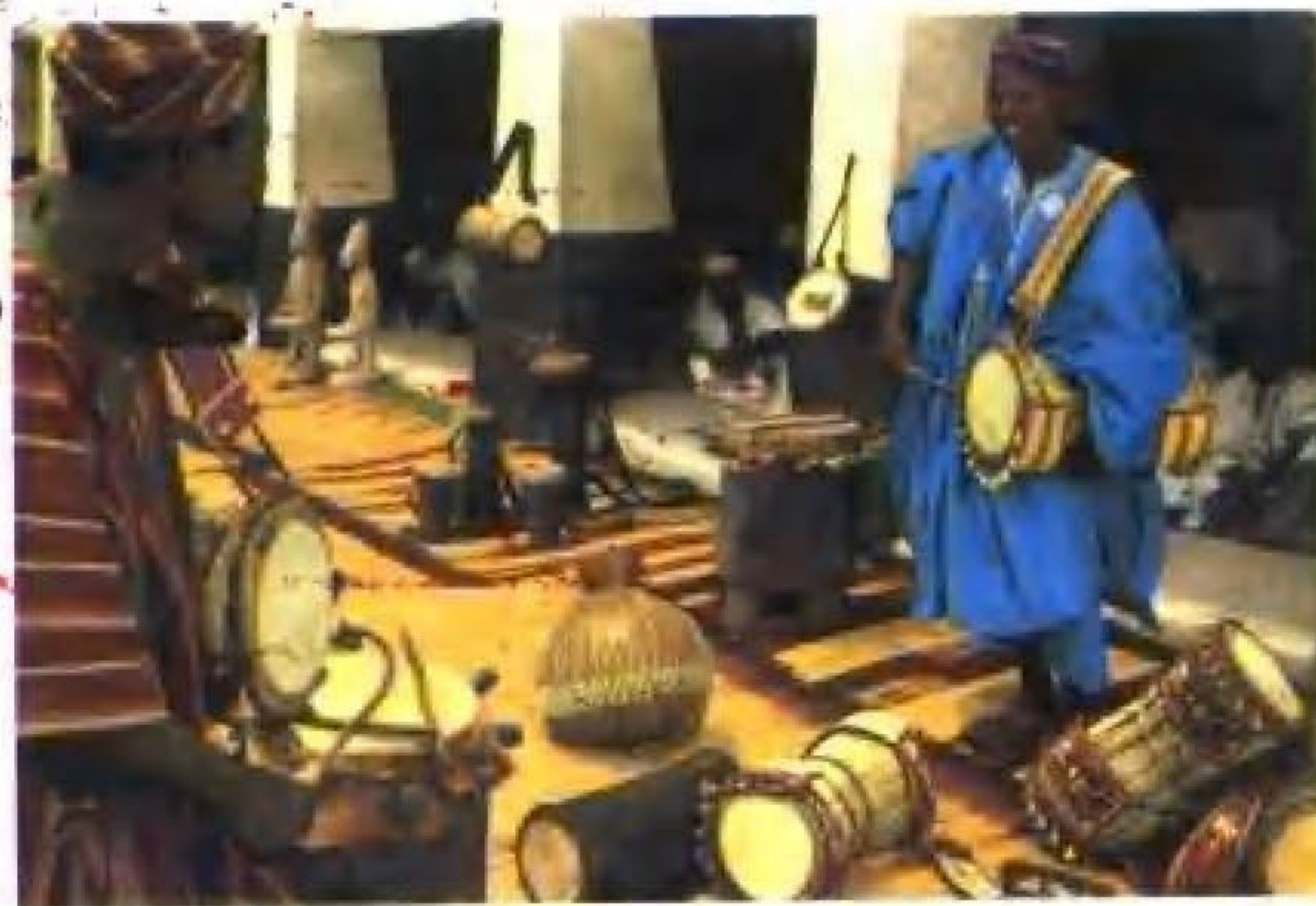
非洲民间工艺品市场