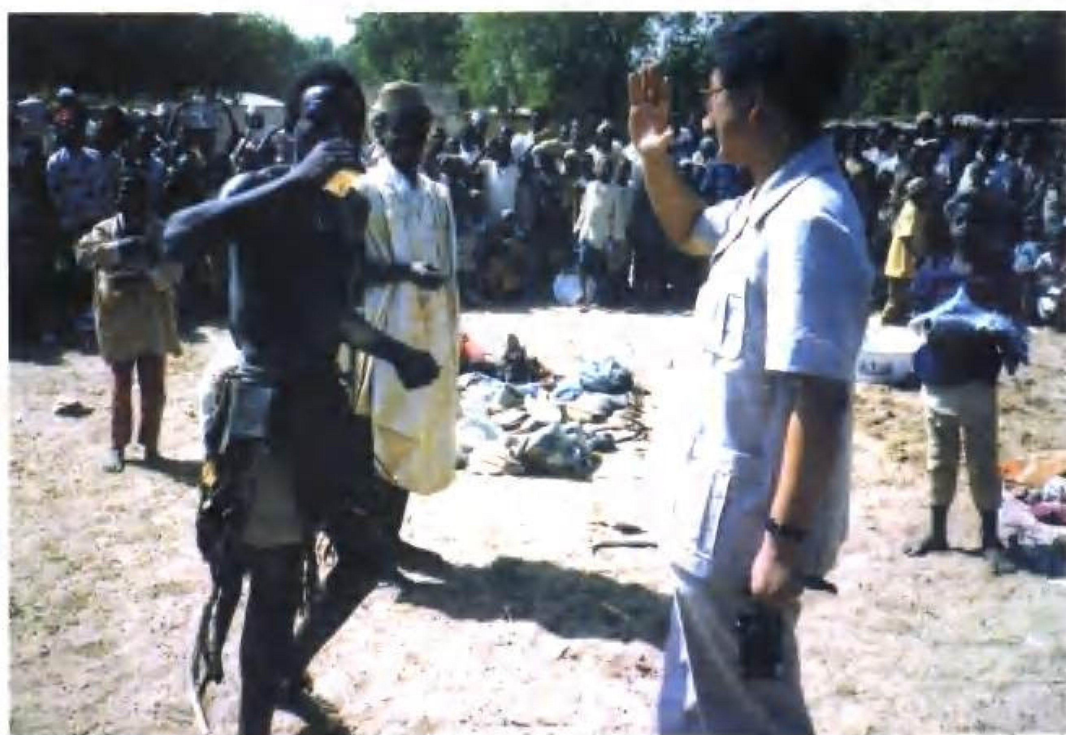
本书作者采访马里艺人