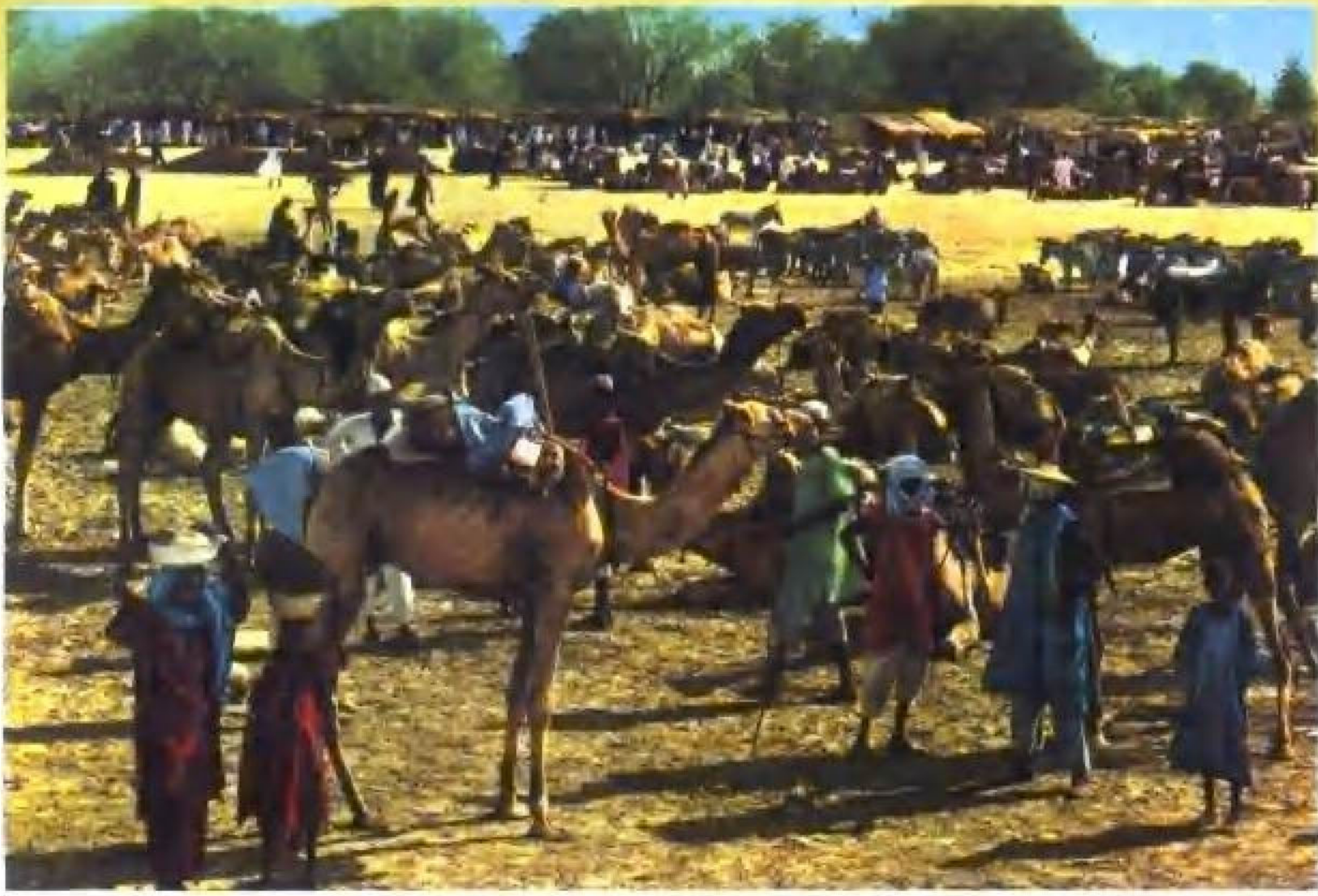
非洲集贸市场一角