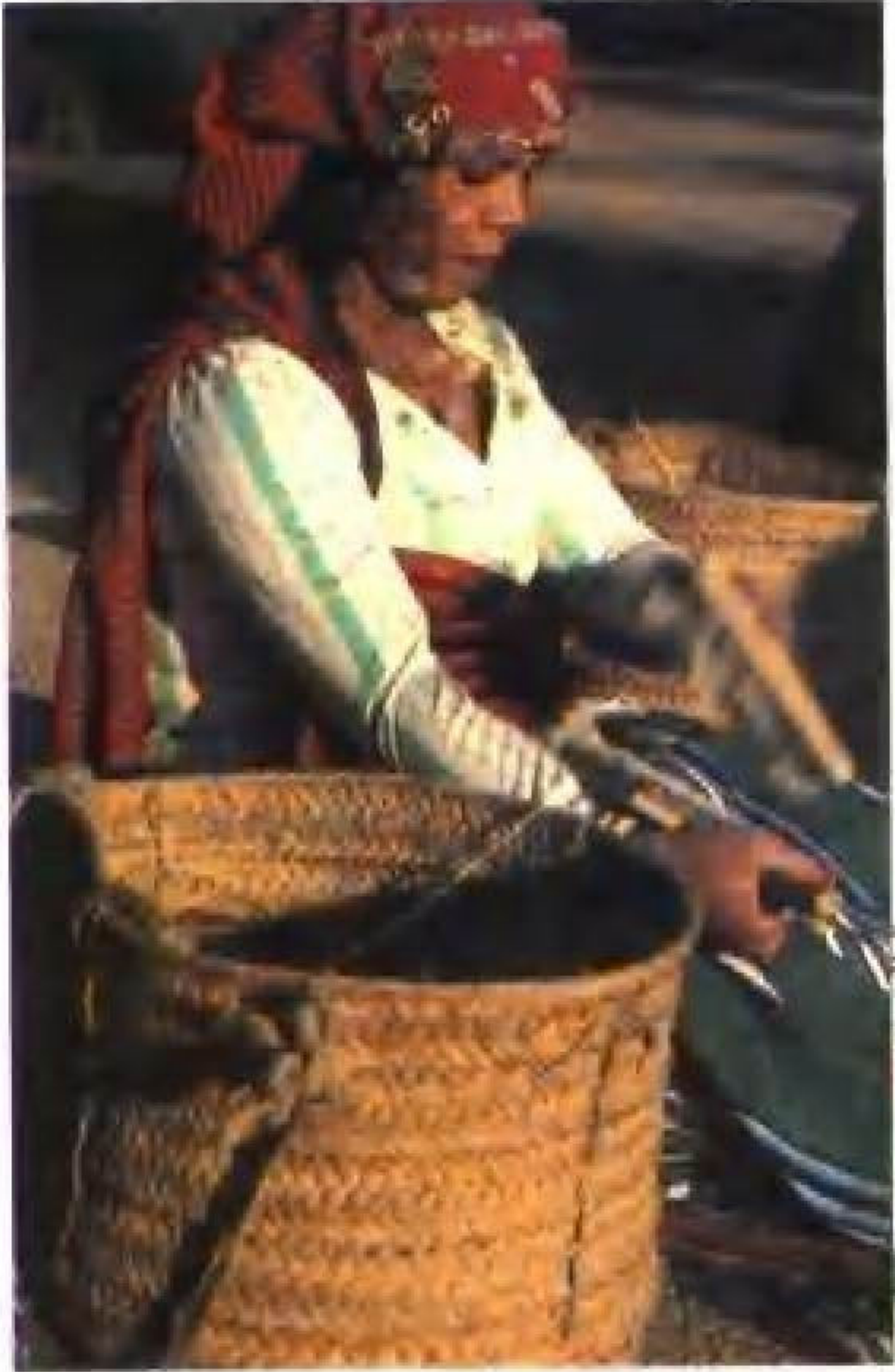
突尼斯民间女艺人