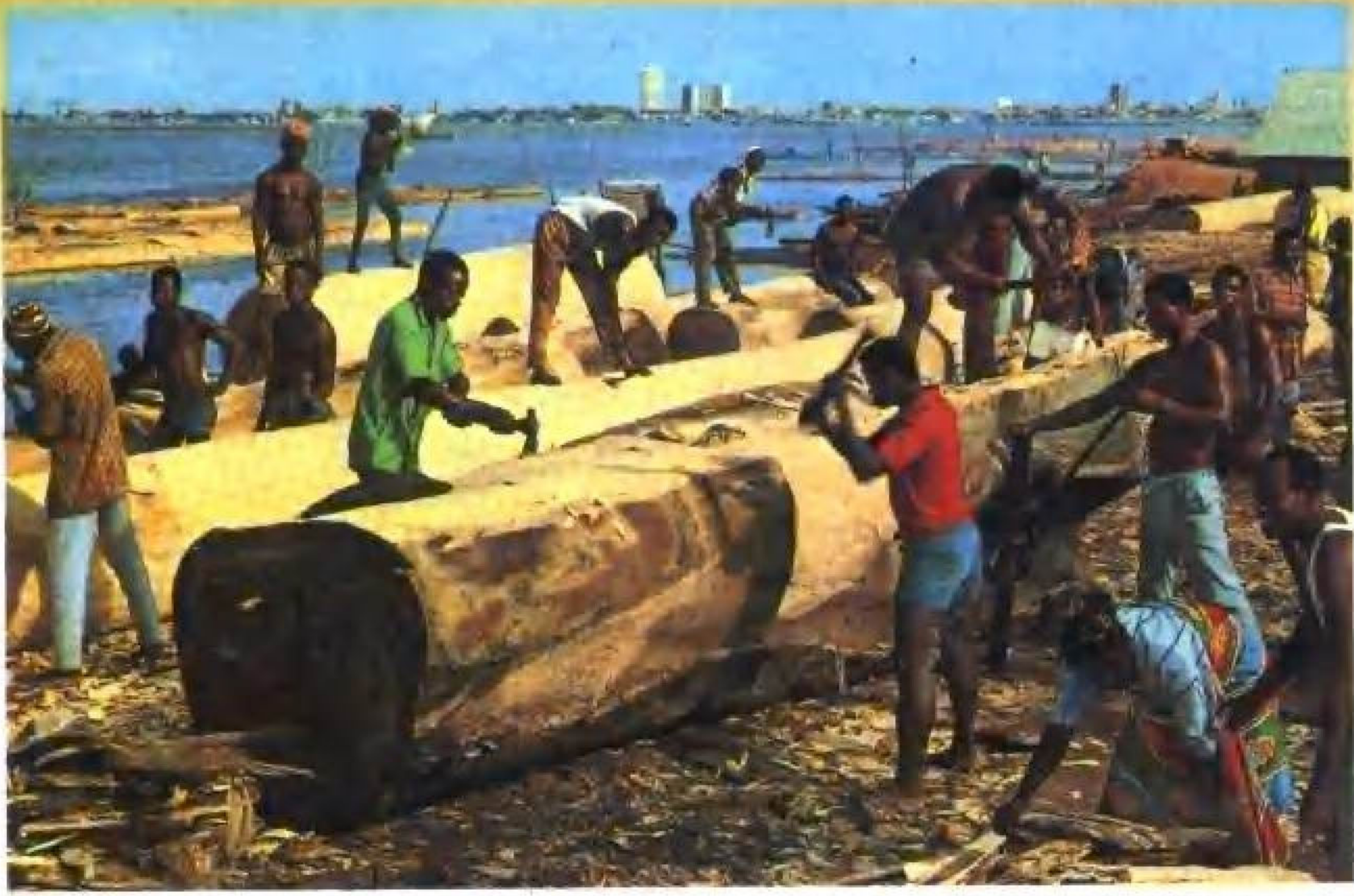
尼日利亚伐木工人