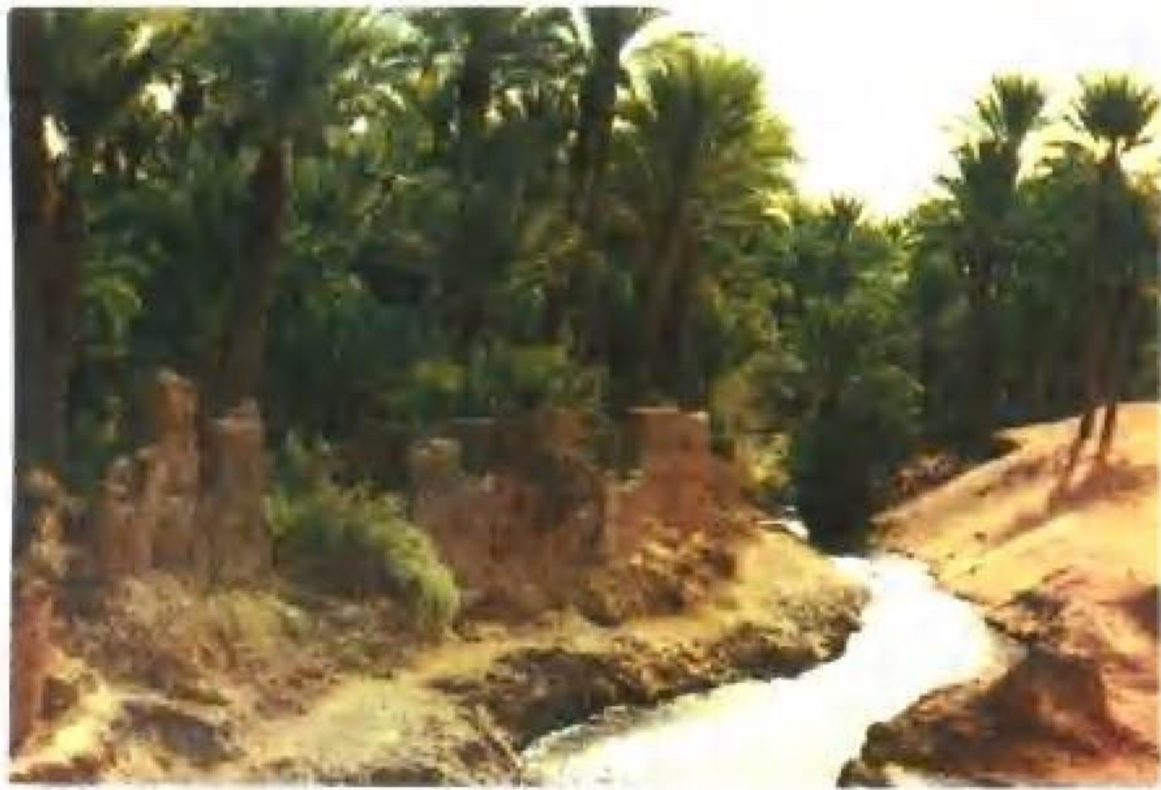
摩洛哥的沙漠绿洲