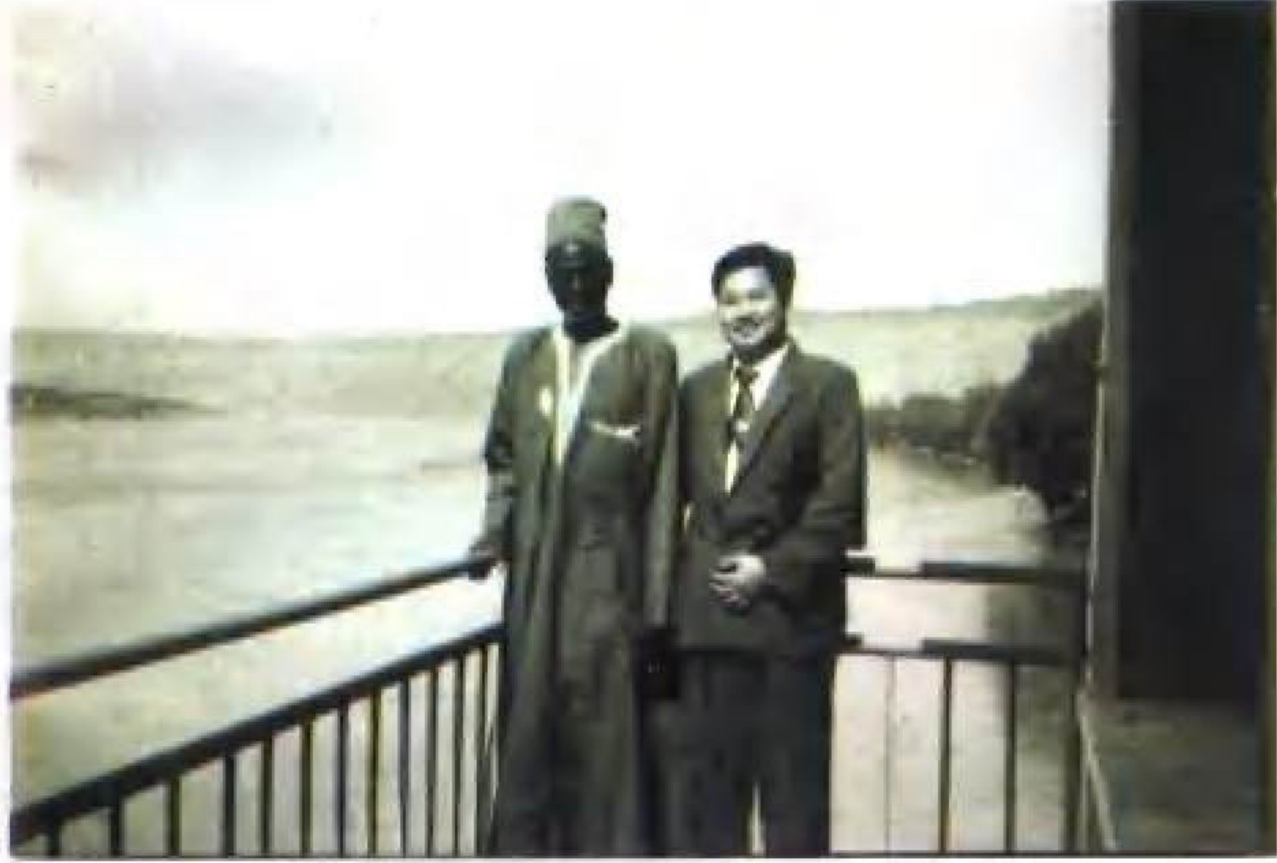
本书作者同尼日尔酋长在一起