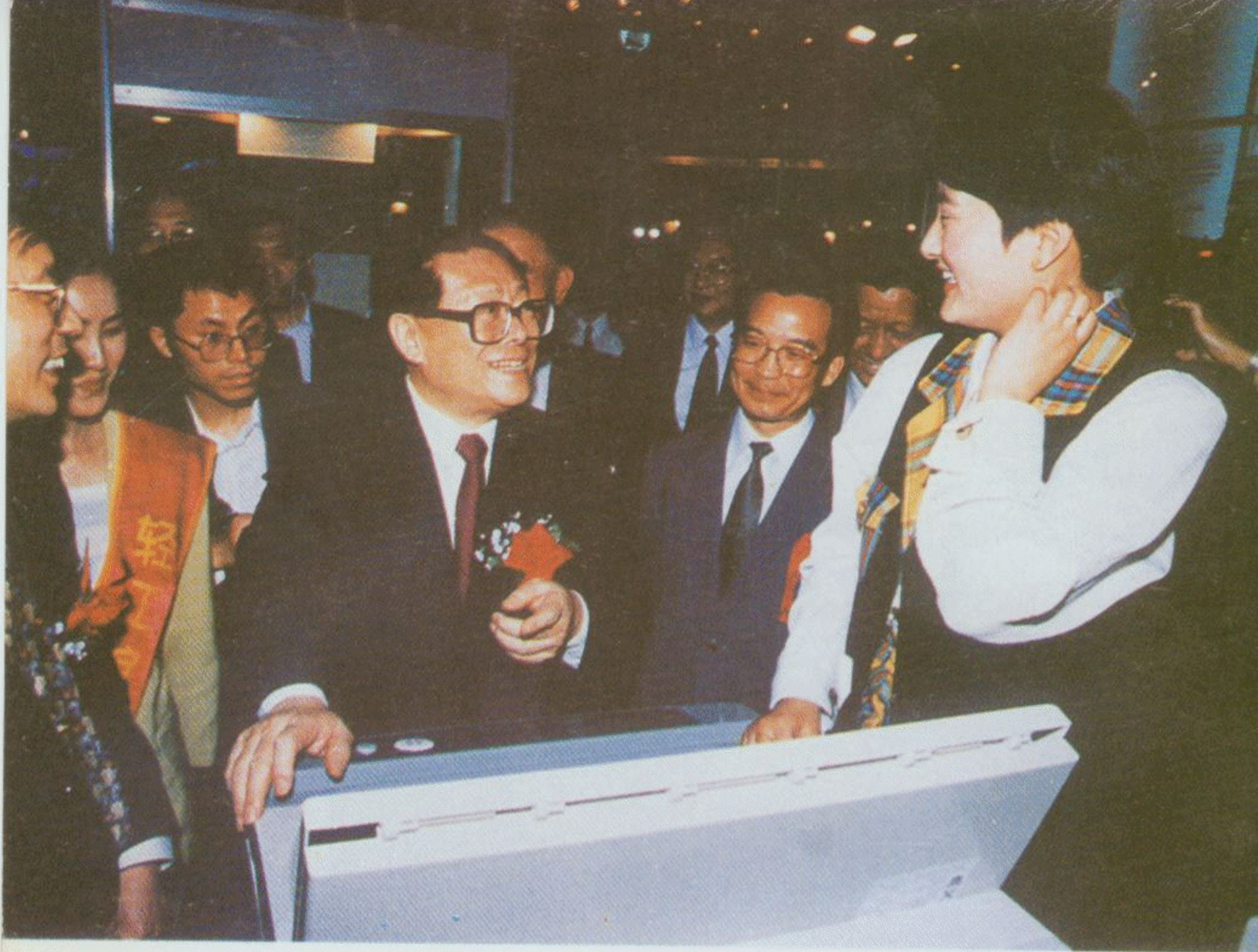
1995年4月在全国第二届工业企业进步成就展览会上，江泽民主席观看了合肥三洋人工智能全自动洗衣机。