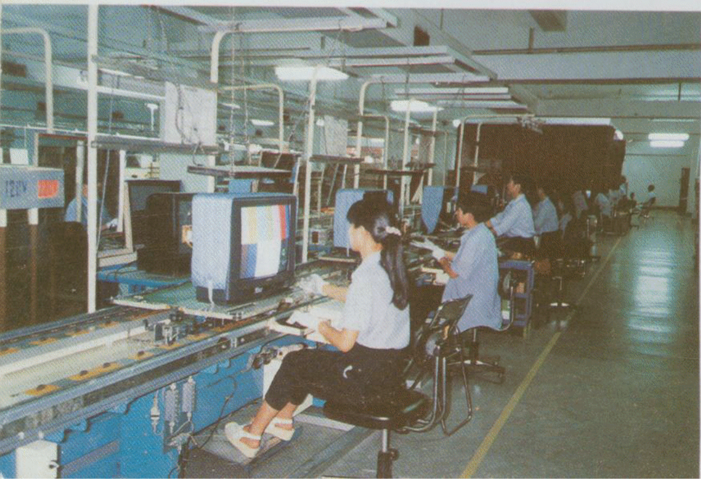
深圳华强三洋电子有限公司每年30万台彩电销往日本，占日本市场销售的三洋公司的彩电的三分之一。