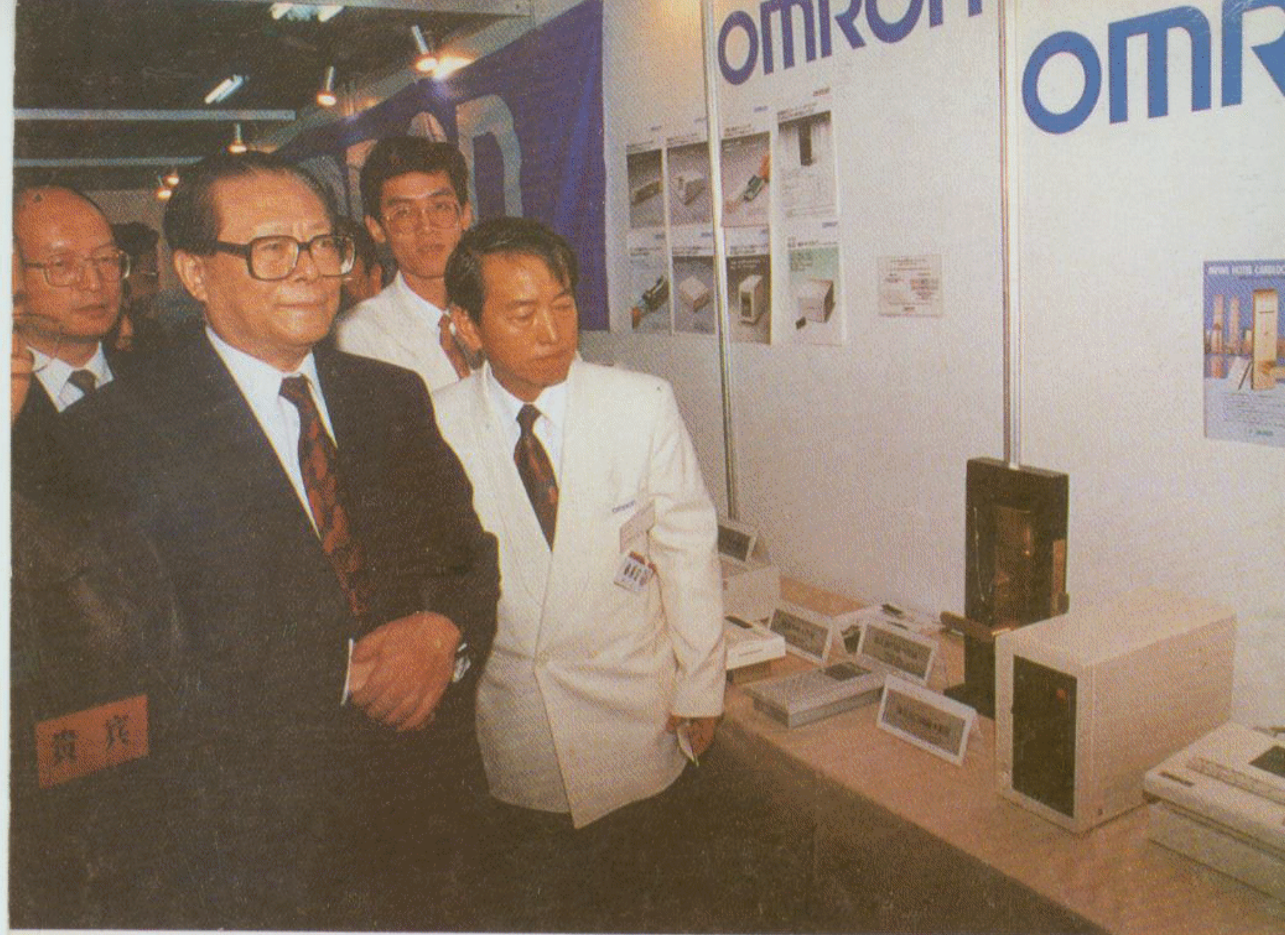
1993年江泽民主席在电子产品展示会上观看欧姆龙公司产品