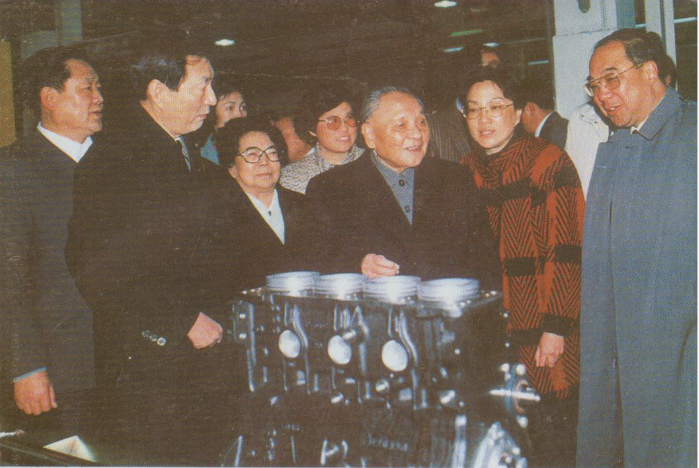
1991年2月6日,邓小平同志视察上海大众。