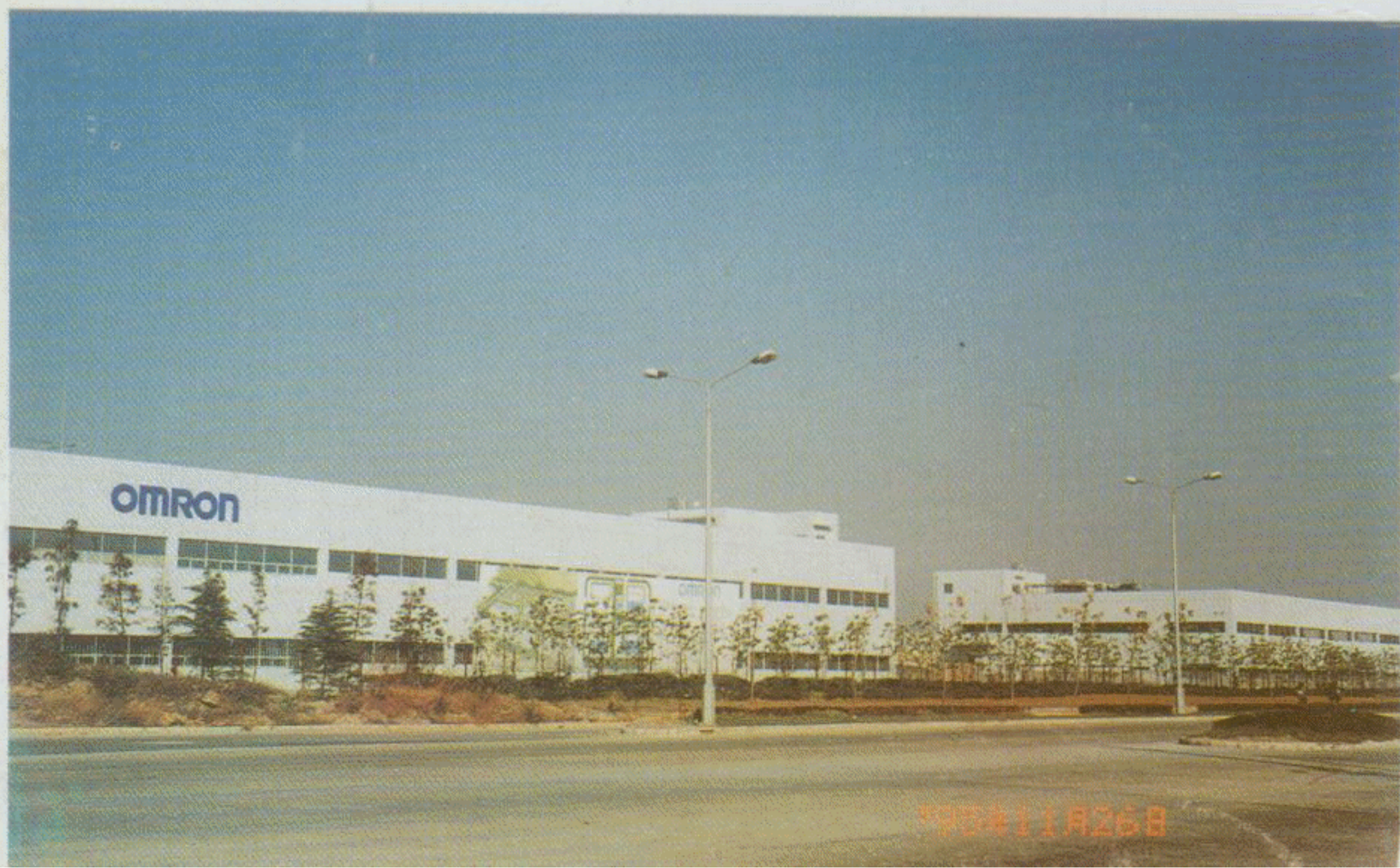
座落在上海浦东的欧姆龙公司在上海三家企业的生产基地