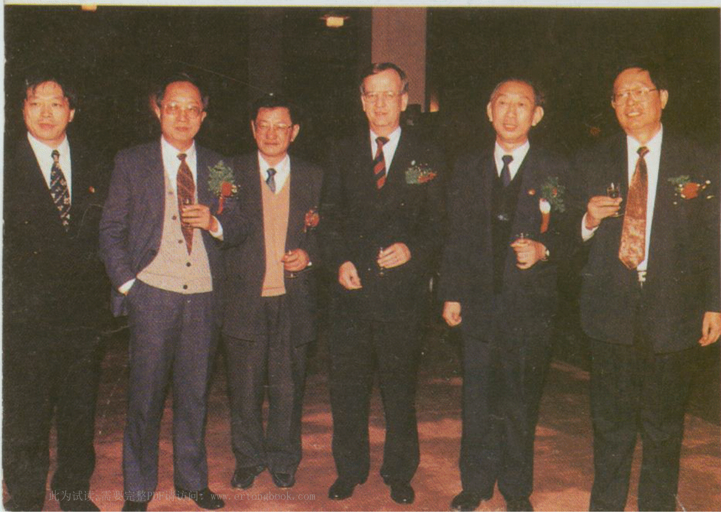
西门子公司与中国有关部门成立协调委员会，开展在机械、电气和电子工业方面长期全面的战略合作。1995年11月，双方庆祝这一合作十周年。