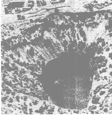
图 2 金伯利岩管现状——一个巨大的垂直深洞

它原来充满含钻石的蓝土，蓝土挖尽后遇到坚硬的原生金伯利岩，因含钻石太少，开采得不偿失，故此岩管被废弃