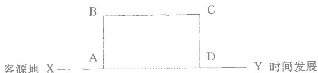
图 2—1 旅游活动的一般过程