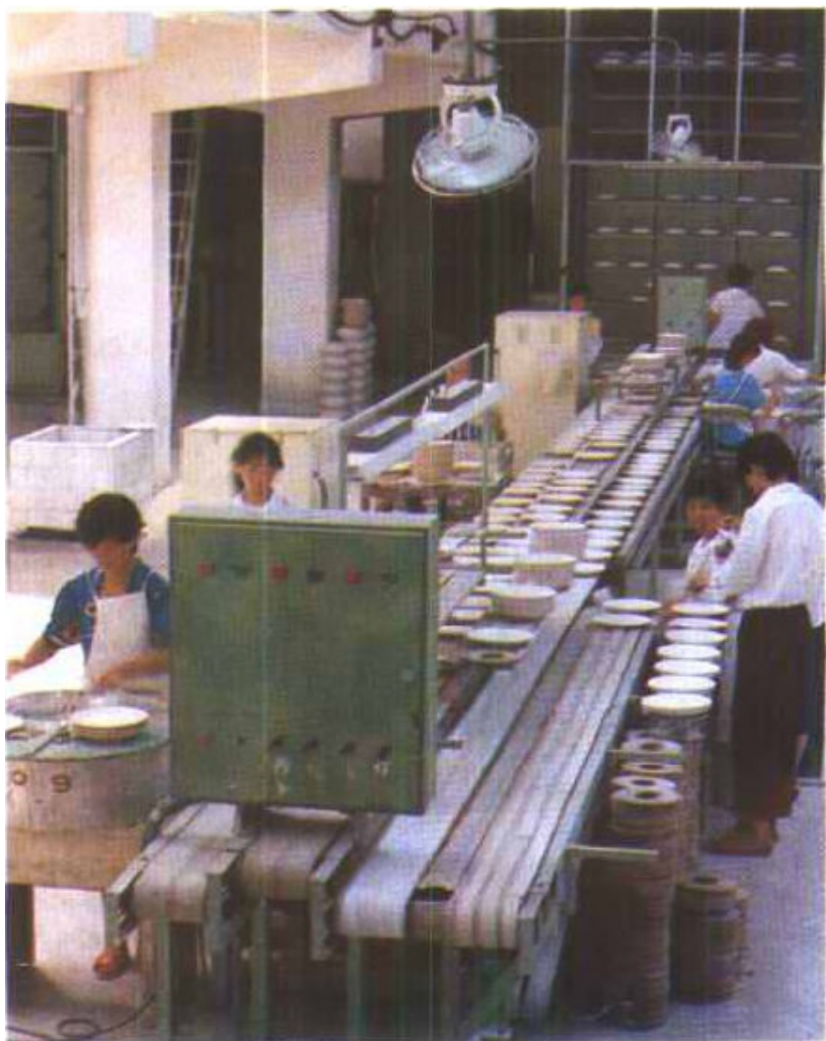
现景德镇宇宙瓷厂二车间链式干燥生产线