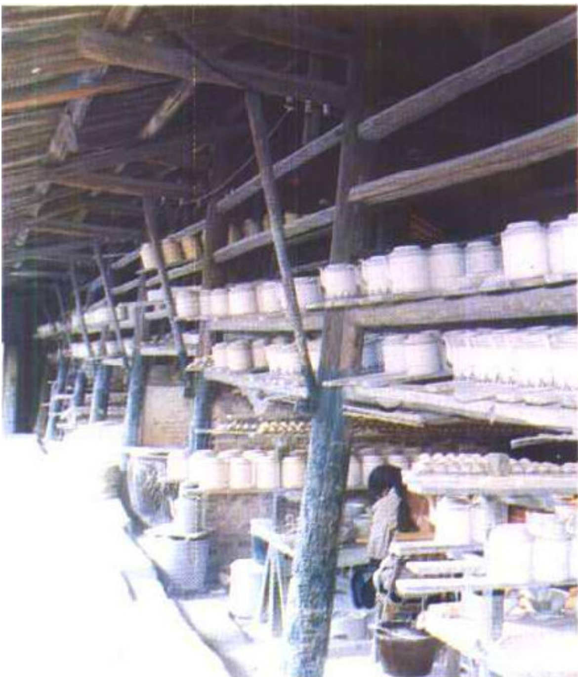
原景德镇陶瓷工场古坯房内景