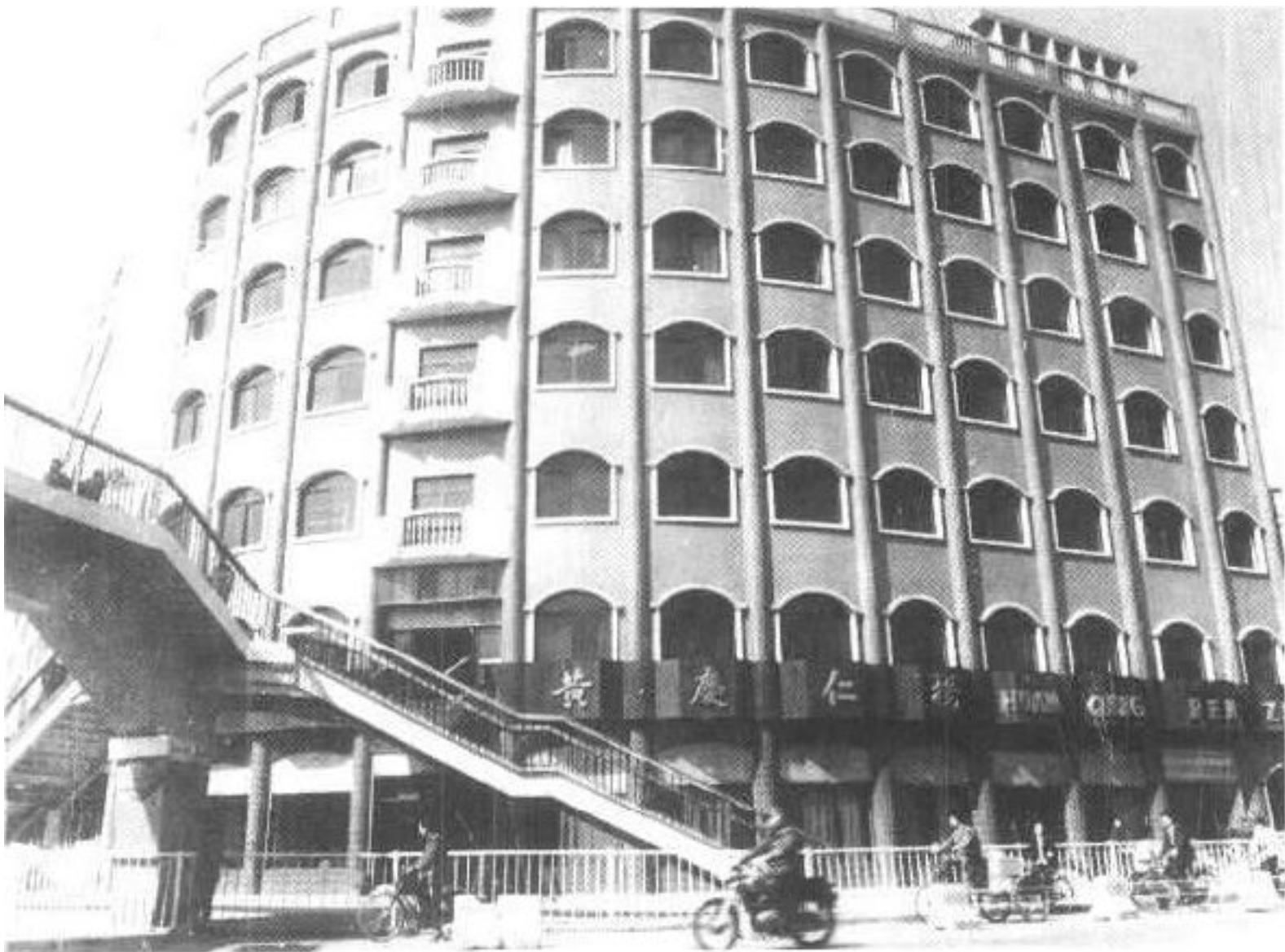
1989年4月1日落成的黄庆仁栈药店新建 营业大厦。