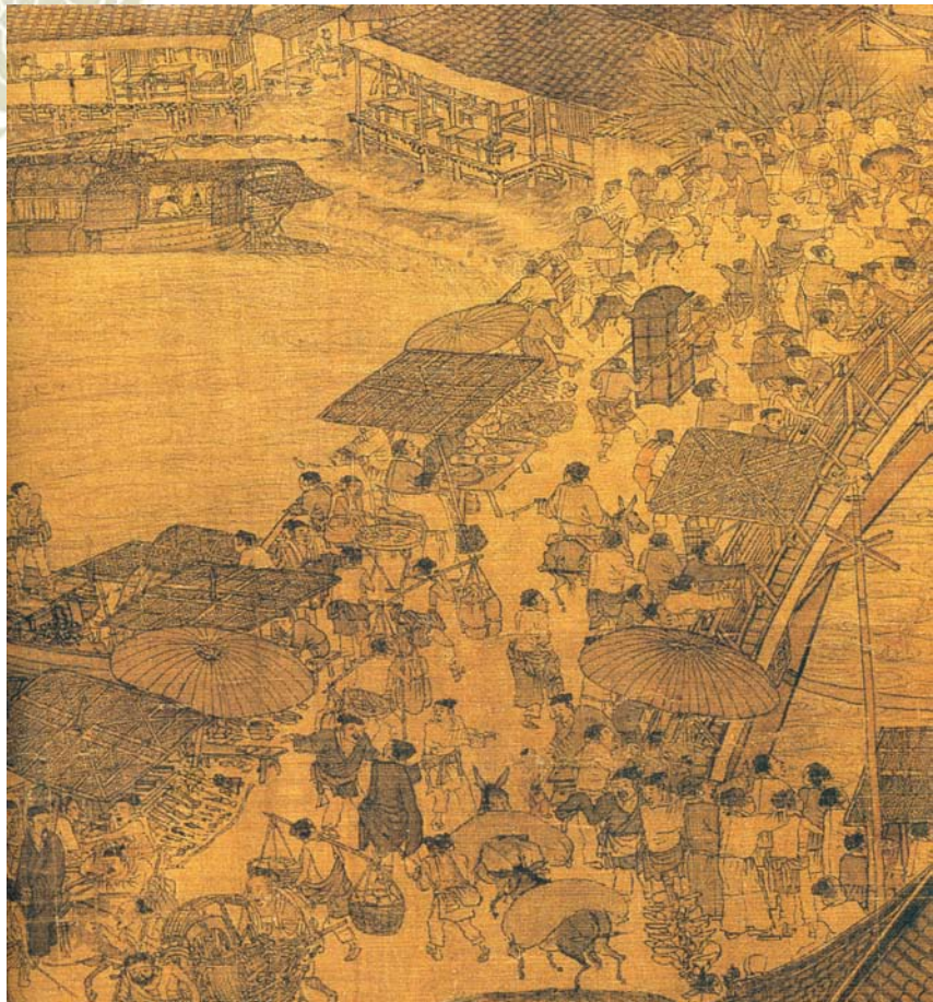
宋·张择端《清明上河图》